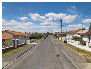
Le boulevard André-Laurent, vue depuis l'est.