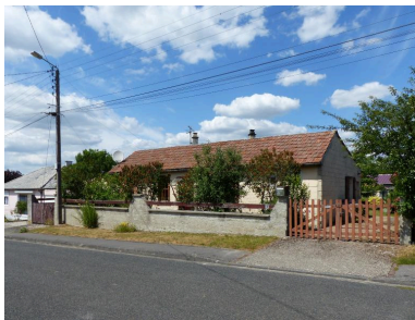
Maison chemisée ou reconstruite en briques. 5 boulevard Aristide-Briand. IVR32_20208005140NUCA