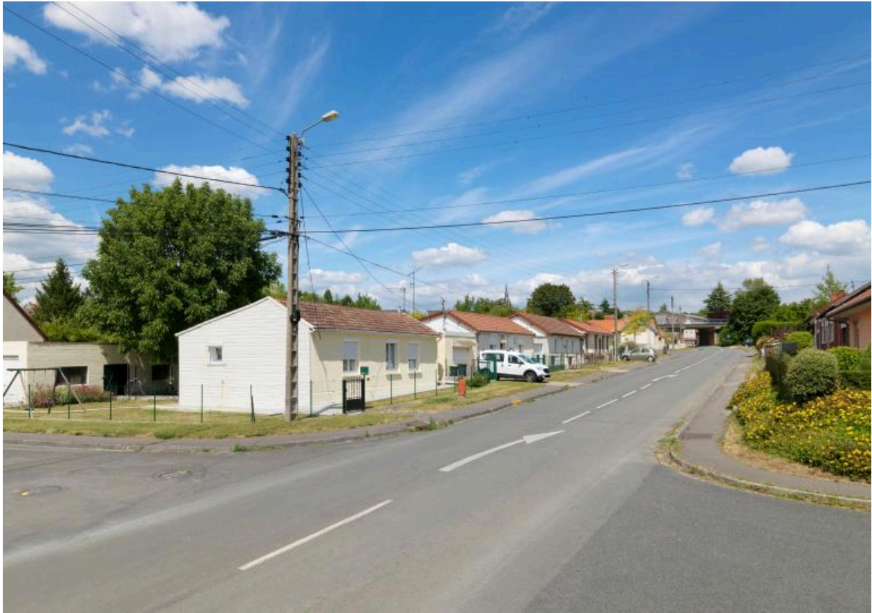
Rue de Cachy, vue depuis le sud.