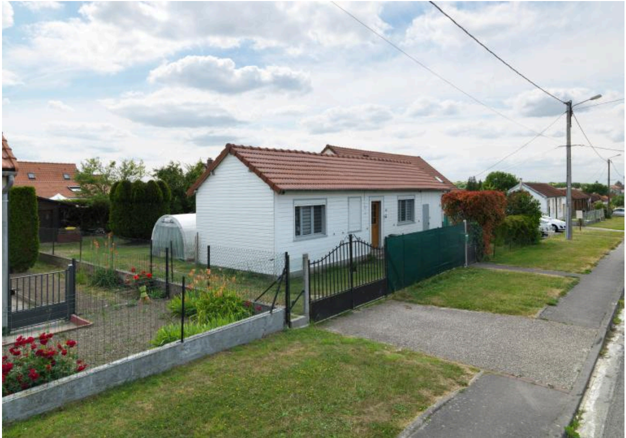
Maison restaurée, boulevard Jean-Jaurès.