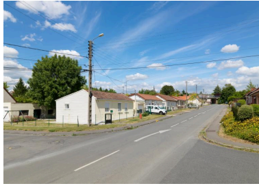
Rue de Cachy, vue depuis le sud. IVR32_20208000143NUC2A