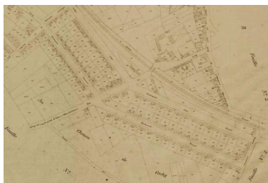
Extrait du cadastre de 1933. Section C, dite de l'Ouest, feuille C2 (AD Somme 73W_CP_696_7).