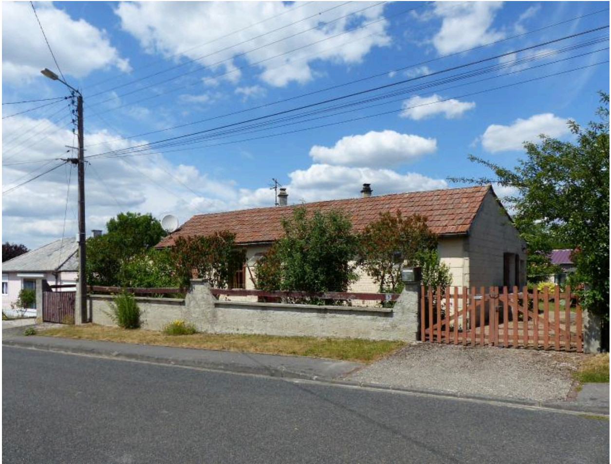
Maison chemisée ou reconstruite en briques. 5 boulevard Aristide-Briand.