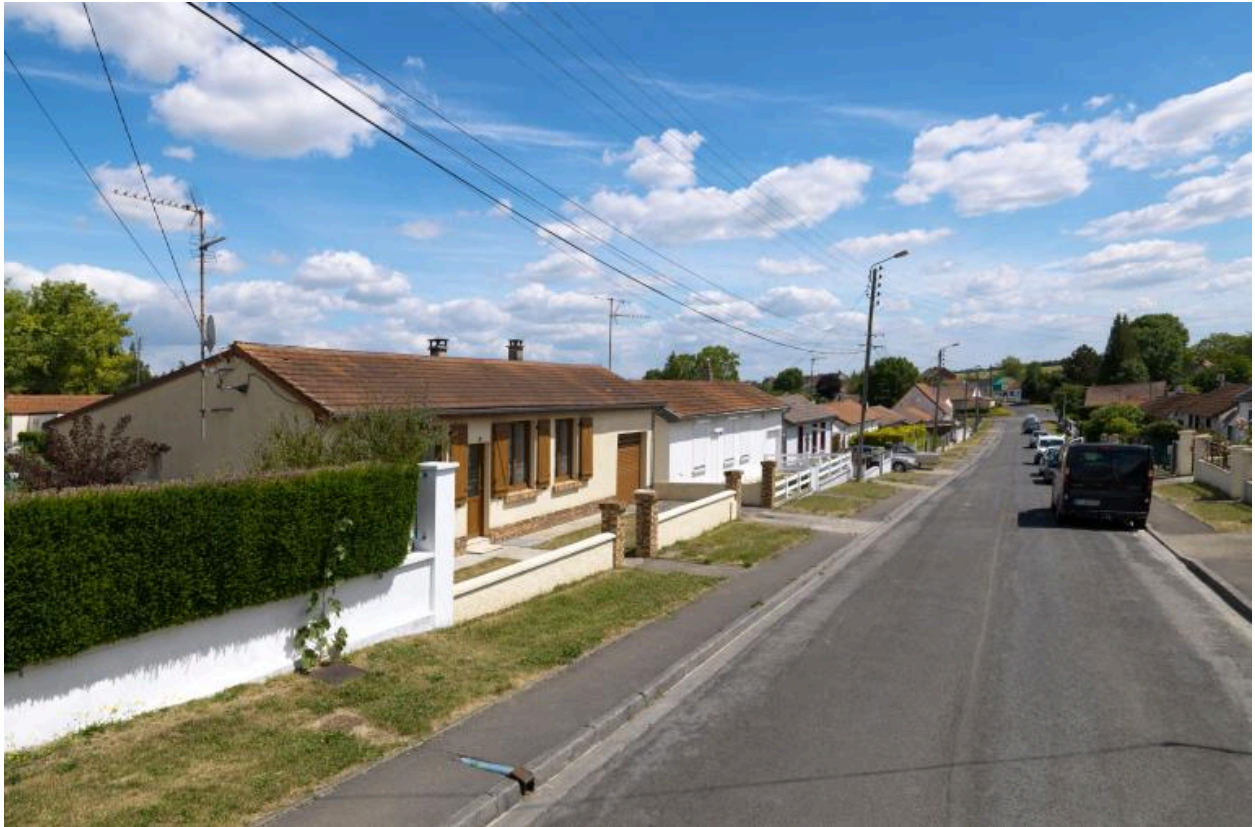
Le boulevard André-Laurent, vue depuis l'ouest.