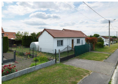
Maison restaurée, boulevard Jean-Jaurès.