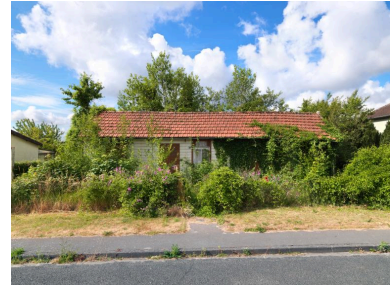
Maison conservée dans son état d'origine. Boulevard Aristide-Briand.