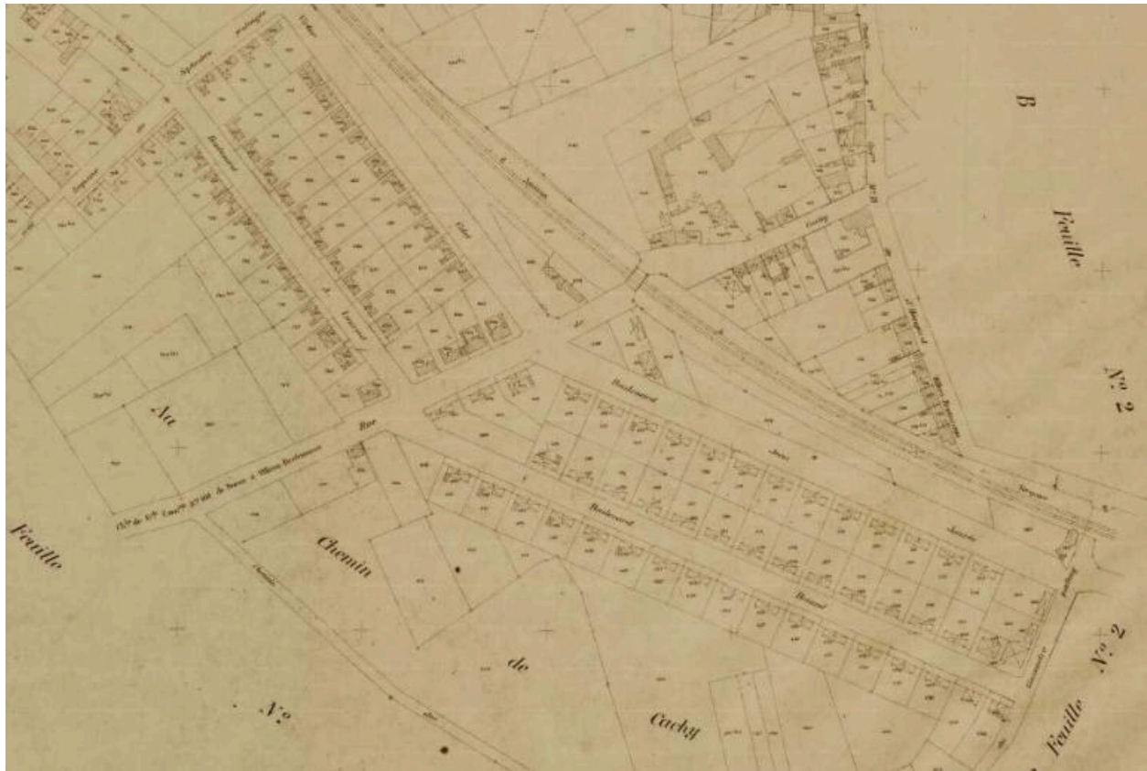
Extrait du cadastre de 1933. Section C, dite de l'Ouest, feuille C2 (AD Somme 73W_CP_696_7).