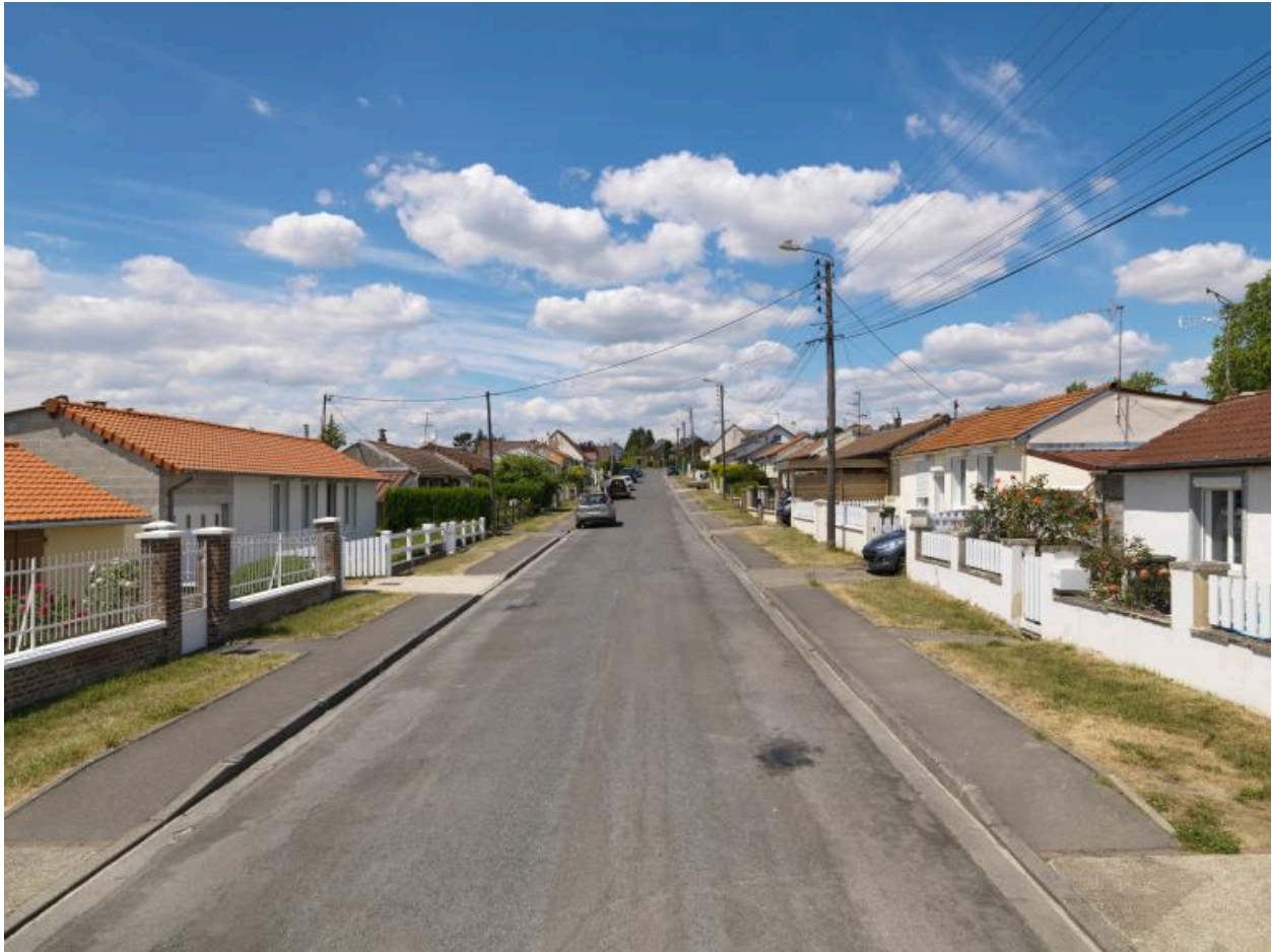
Le boulevard André-Laurent, vue depuis l'est.