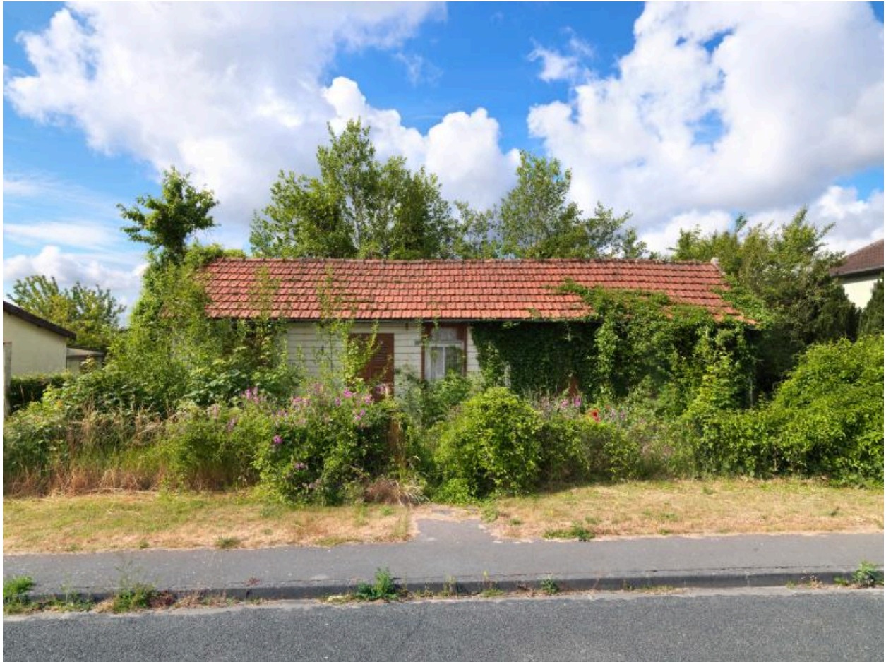
Maison conservée dans son état d'origine. Boulevard Aristide-Briand.