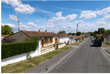
Le boulevard André-Laurent, vue depuis l'ouest.