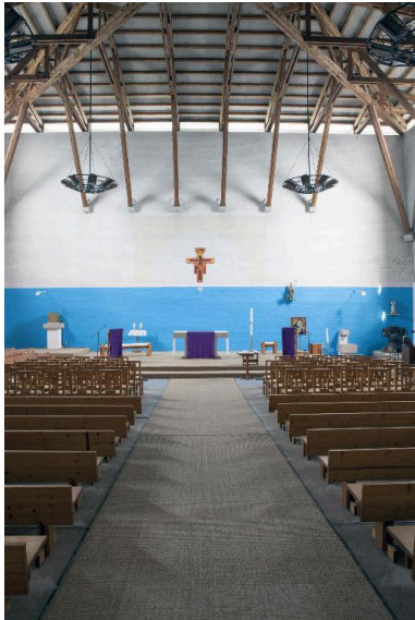
Vue générale vers l'autel. IVR31_20155900128NUCA