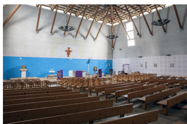
Vue de trois-quart intérieur. IVR31_20155900127NUCA