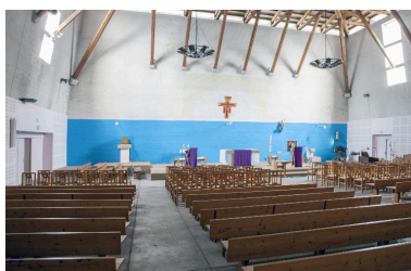
Vue générale vers le ch#oeur. IVR31_20155900132NUCA