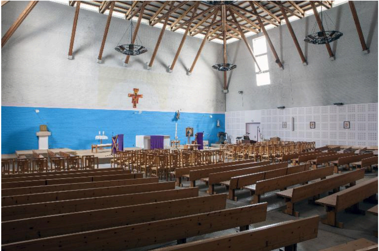
Vue de trois-quart intérieur.