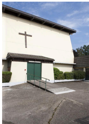
Élévation antérieure de l'église.