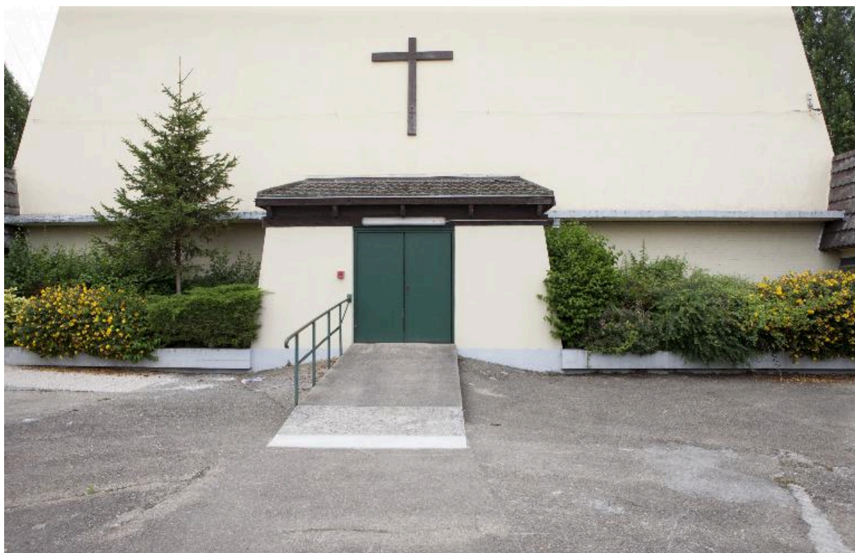
Entrée de l'église