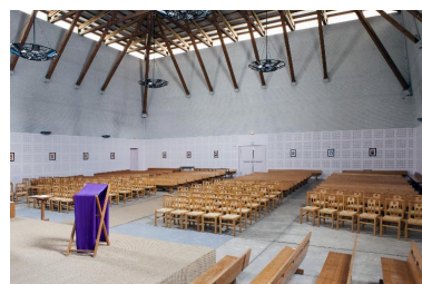
Vue générale vers l'entrée de l'église. IVR31_20155900131NUCA