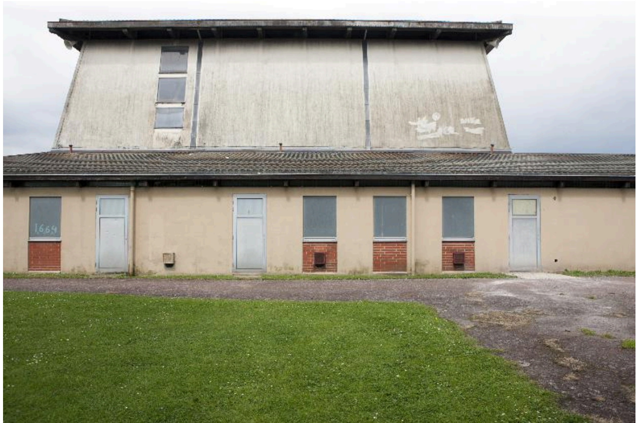
Élévation du flanc gauche de l'église.