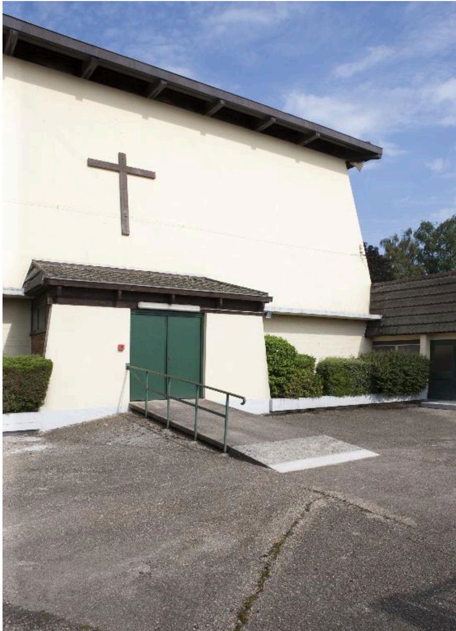
Élévation antérieure de l'église.