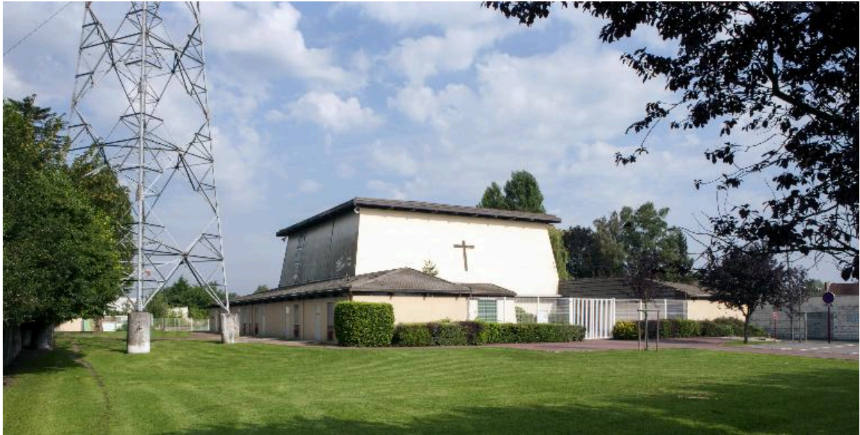
Vue de trois-quart, avant gauche de l'église.