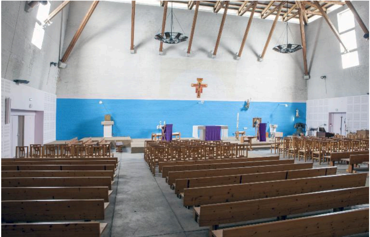
Vue générale vers le ch#oeur.