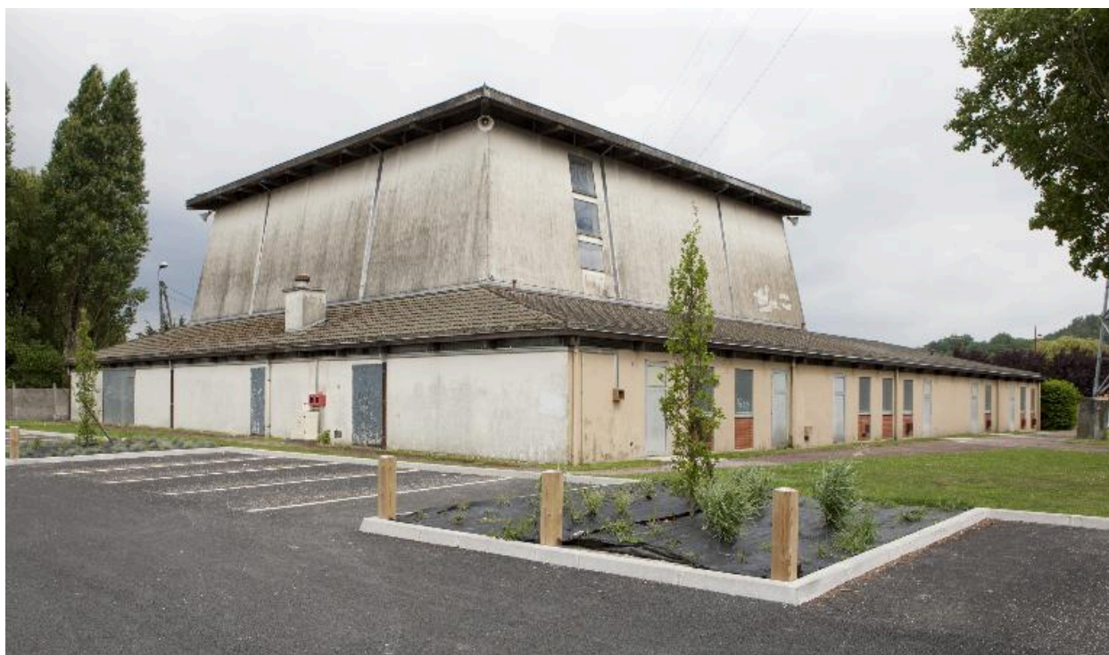
Vue de trois-quart, arrière gauche de l'église.