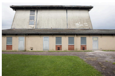
Élévation du flanc gauche de l'église. IVR31_20155900122NUCA