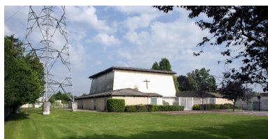
Vue de trois-quart, avant gauche de l'église.