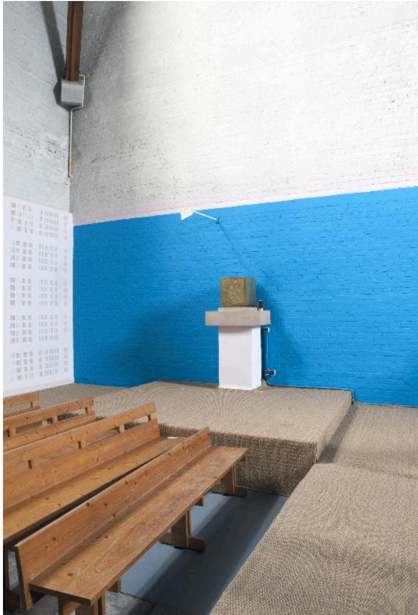
Vue du tabernacle.