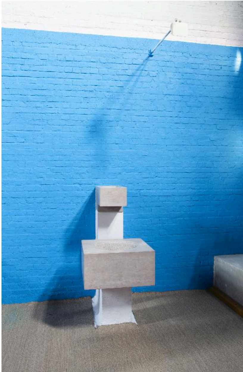
Vue des fonts baptismaux.