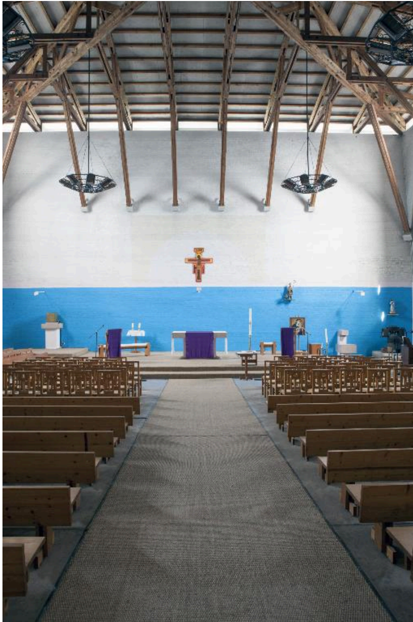
Vue générale vers l'autel.