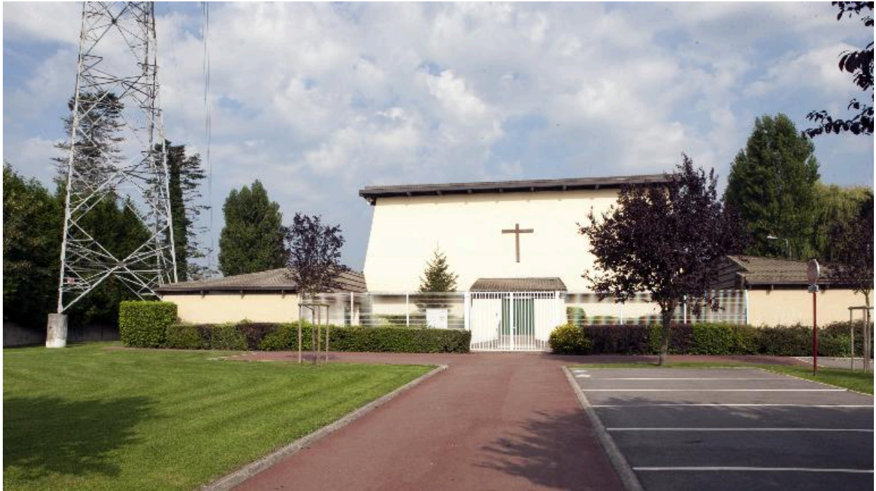
Élévation de la façade antérieure.