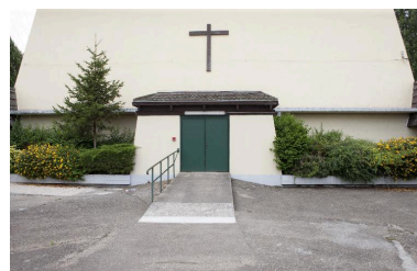
Entrée de l'église