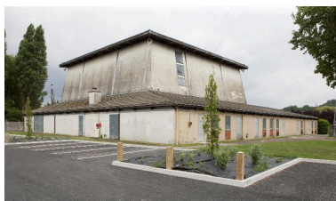
Vue de trois-quart, arrière gauche de l'église.