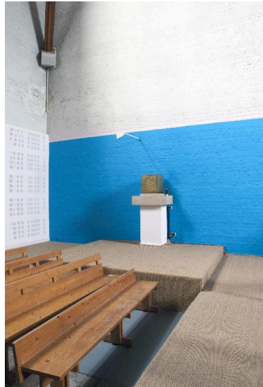
Vue du tabernacle.