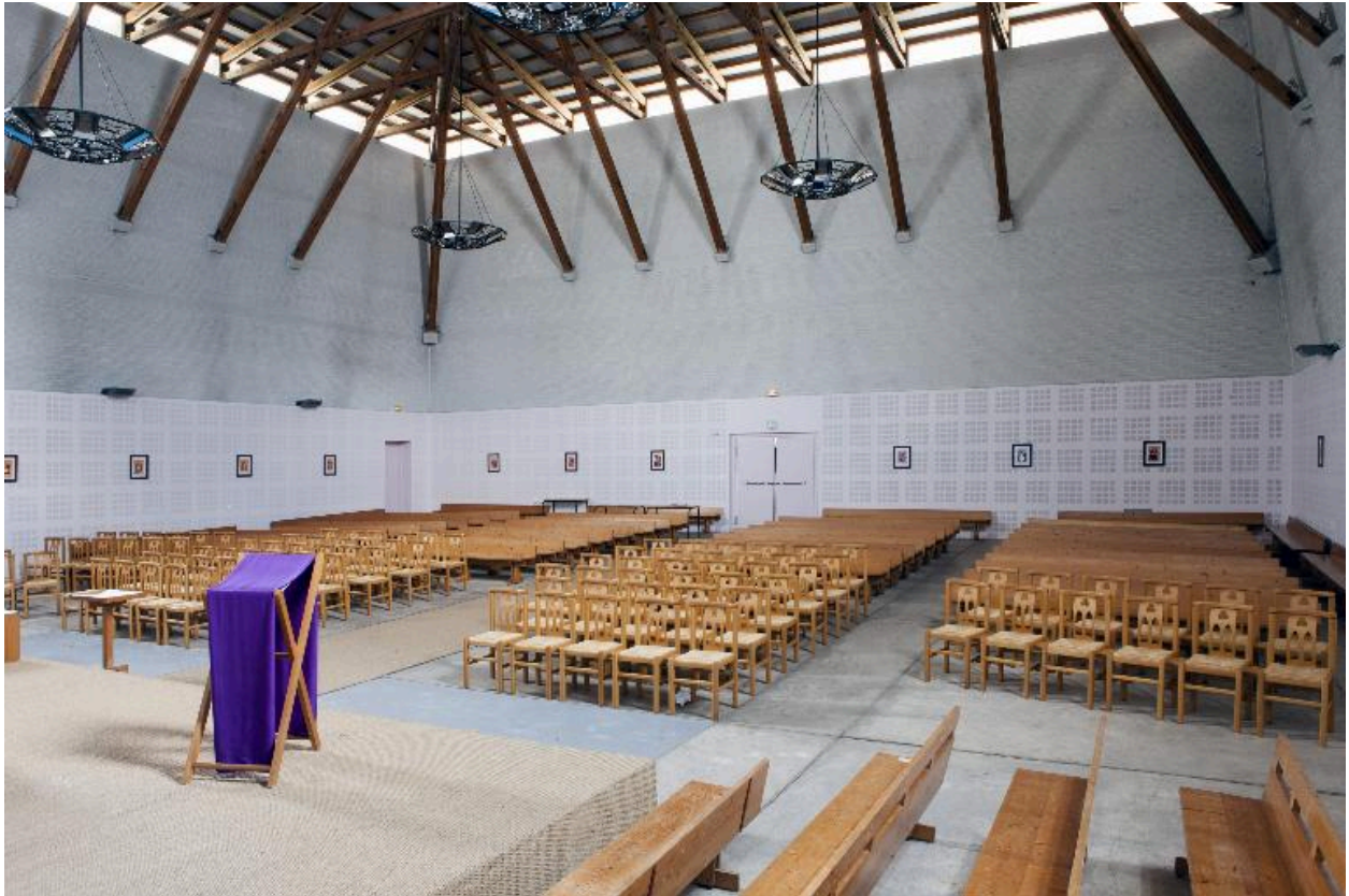
Vue générale vers l'entrée de l'église.