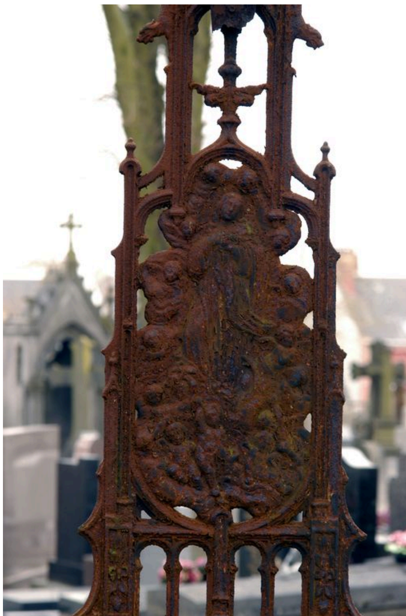
Vue de détail sur la partie basse de la croix (Assomption).