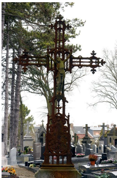
Vue de détail sur la croix en fonte moulée.