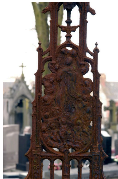
Vue de détail sur la partie basse de la croix (Assomption). IVR22_20058000281NUCA