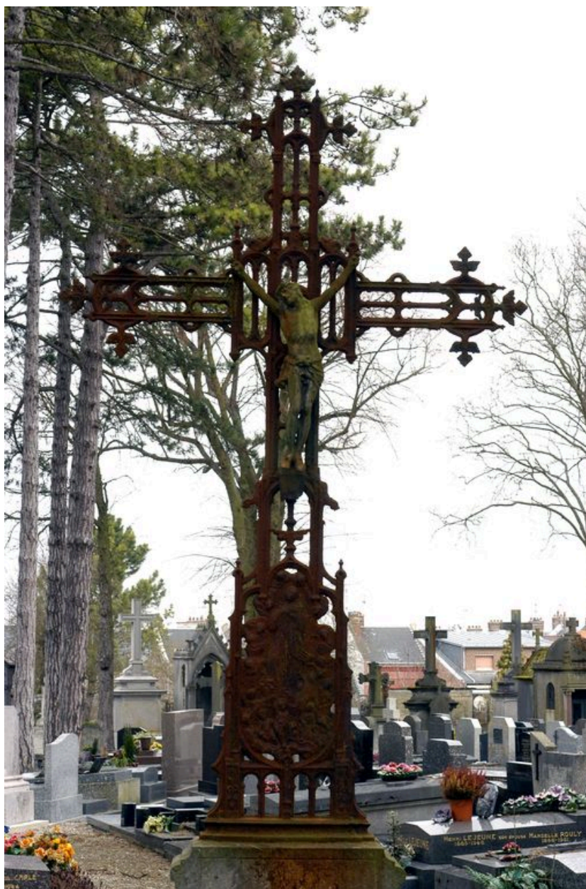
Vue de détail sur la croix en fonte moulée.