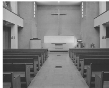
Vue intérieure vers le chœur.