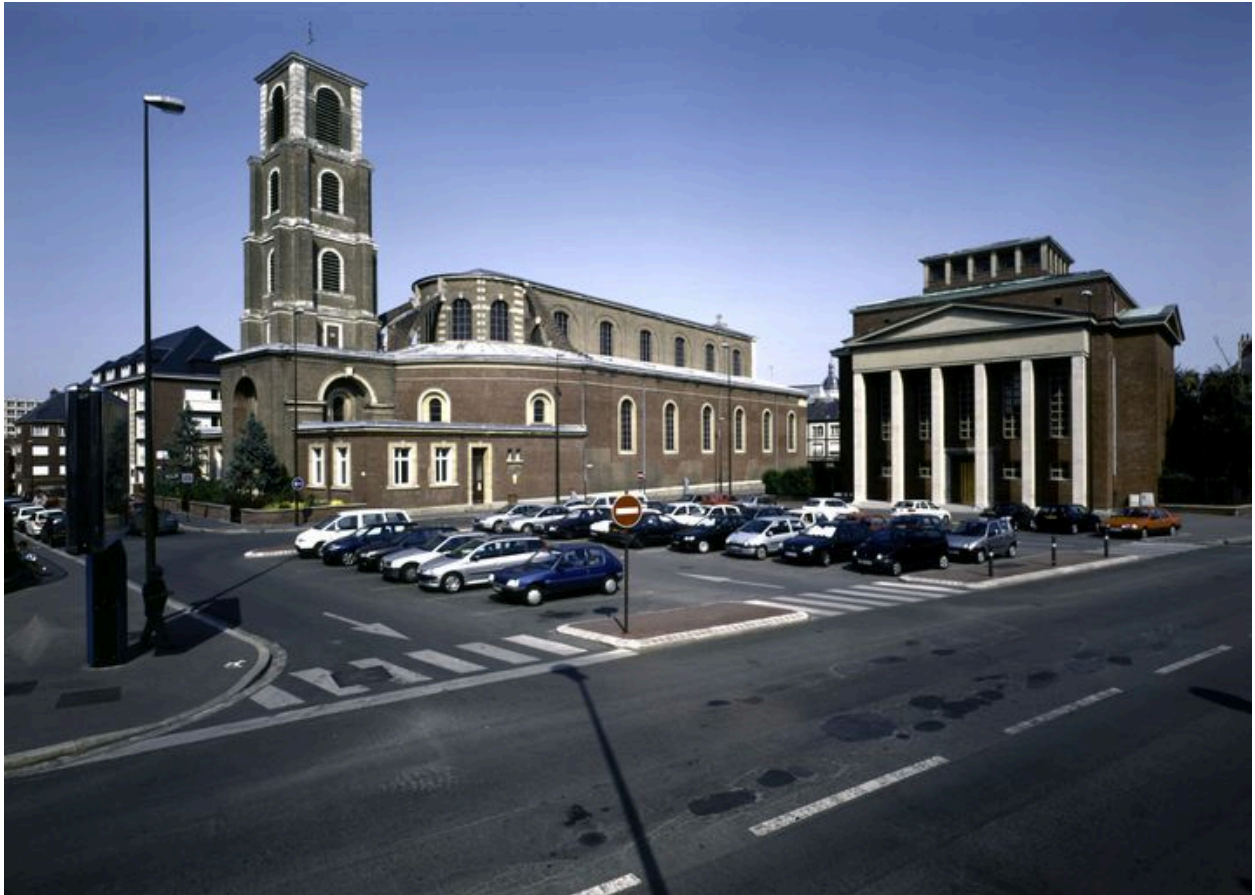
Vue de situation, depuis le sud-ouest.