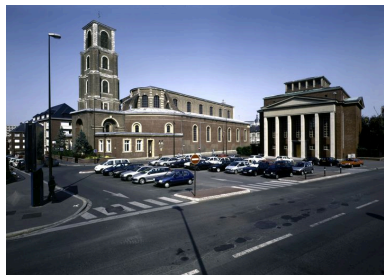
Vue de situation, depuis le sud-ouest.

Phot. Thierry Lefébure IVR22_20038000773PA