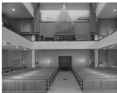
Vue intérieure depuis le chœur.