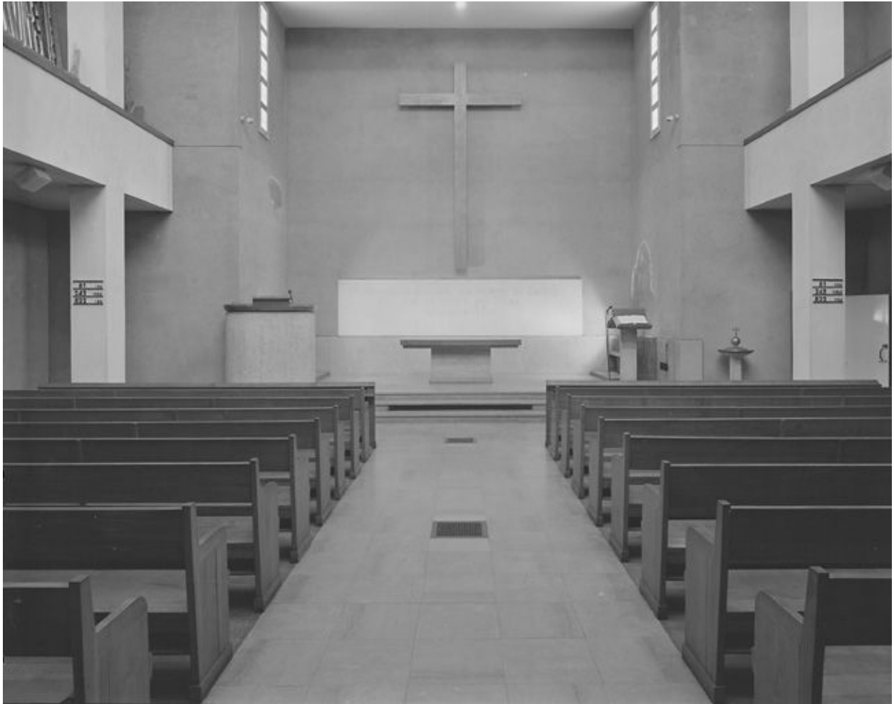
Vue intérieure vers le chœur.