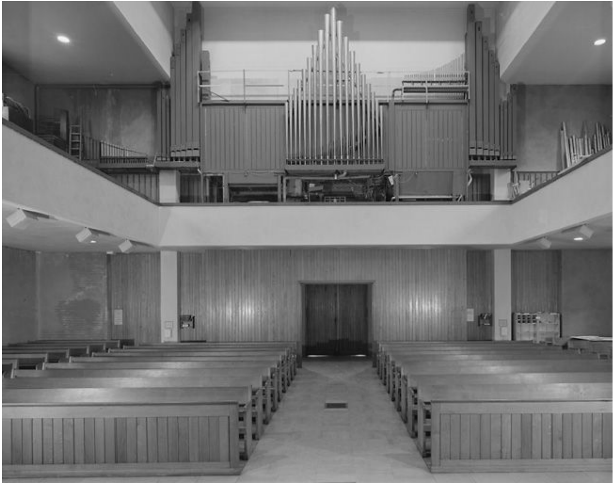
Vue intérieure depuis le chœur.