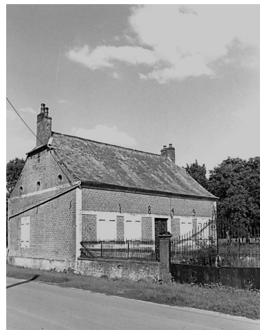
Logis depuis la rue. IVR22_19980202359Z