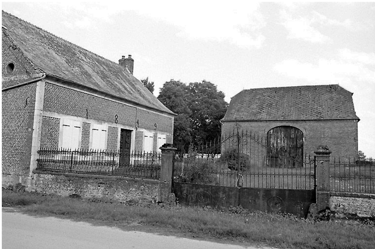
Vue générale de la ferme.