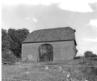
Grange traversante. IVR22_19980202358Z