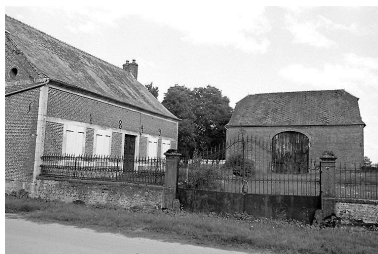
Vue générale de la ferme. IVR22_19980202360Z