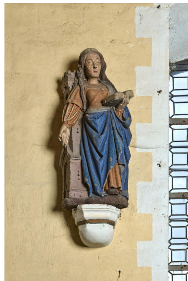
Statue de sainte Barbe, XVIe siècle, inscrite au titre des Monuments historiques.