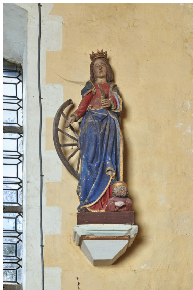
Statue de sainte Catherine, XVIIe siècle, inscrite au titre des Monuments historiques.