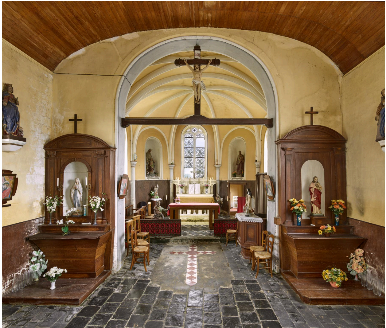
Vue intérieure vers le chœur et des deux autels latéraux.