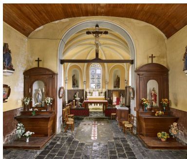
Vue intérieure vers le chœur et des deux autels latéraux.

IVR32_20236200211NUCA