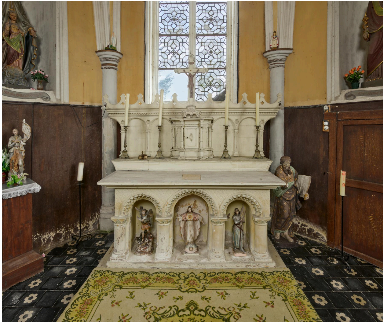
Maître-autel, XIXe siècle.