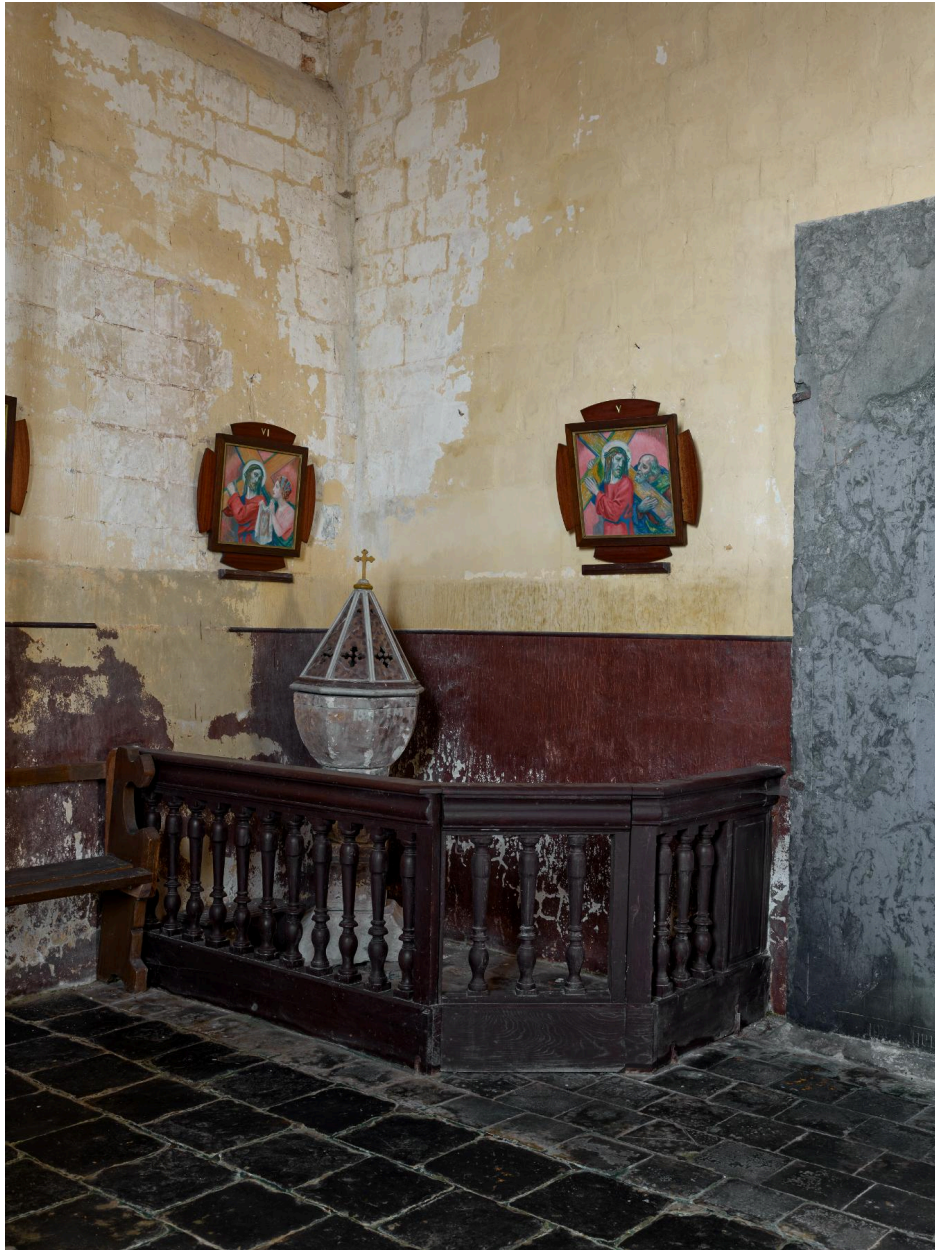
Fonts baptismaux, XIXe siècle.