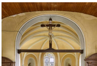
Poutre de gloire, XIXe siècle. IVR32_20236200212NUCA