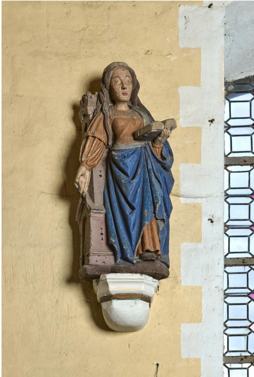
Statue de sainte Barbe, XVIe siècle, inscrite au titre des Monuments historiques.