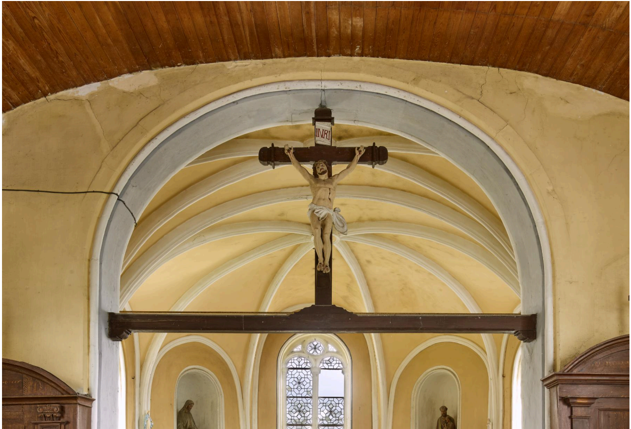
Poutre de gloire, XIXe siècle.