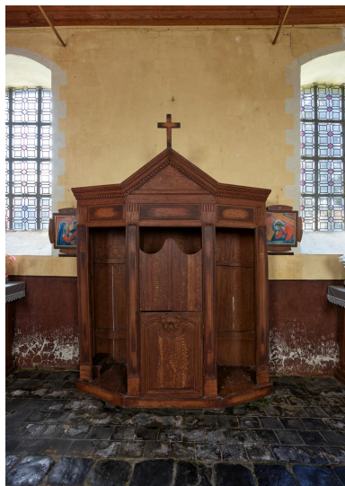
Confessionnal.