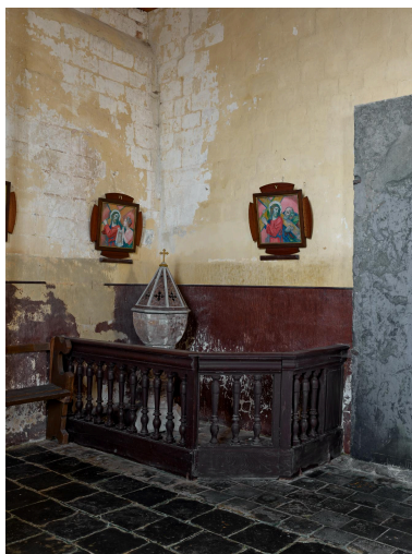
Fonts baptismaux, XIX e siècle.

IVR32_20236200211NUCA