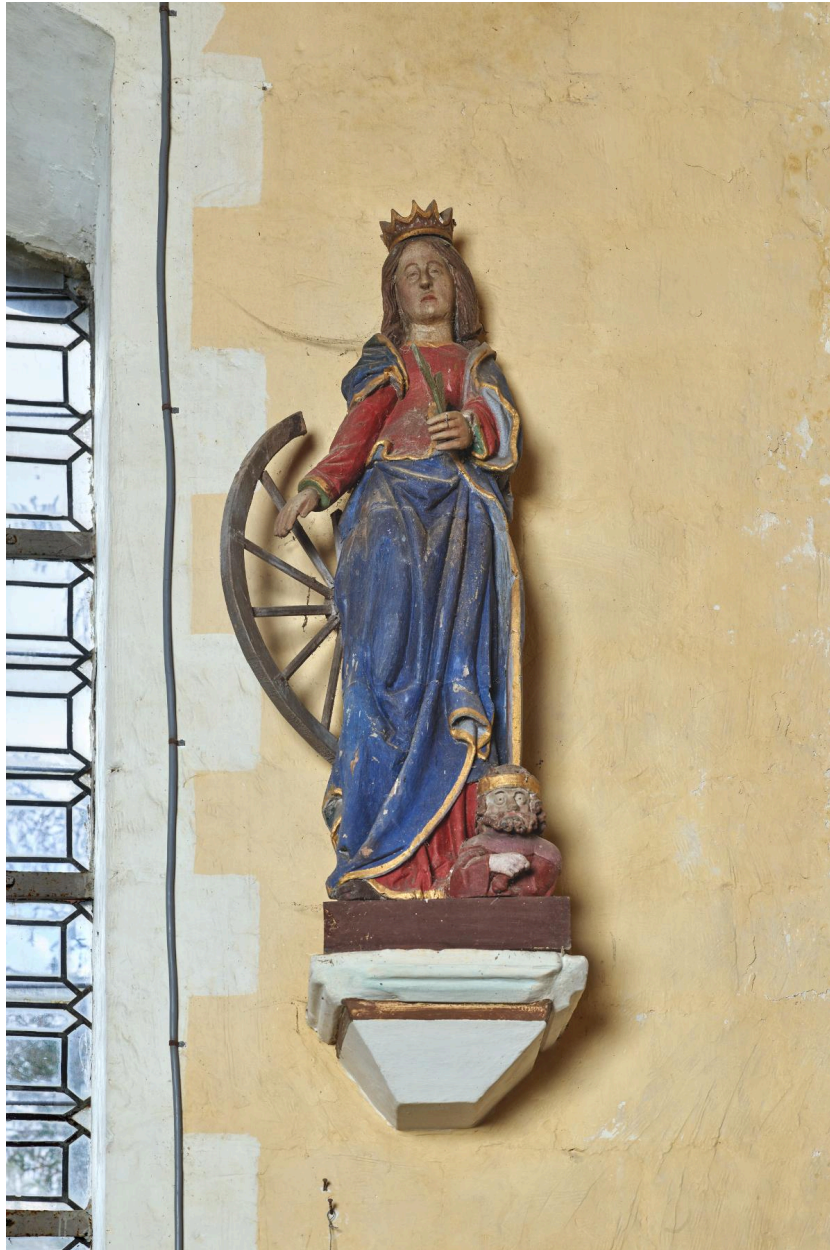
Statue de sainte Catherine, XVIIe siècle, inscrite au titre des Monuments historiques.