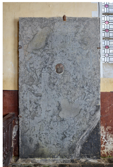
Dalle funéraire du XV e siècle.

IVR32_20236200207NUCA