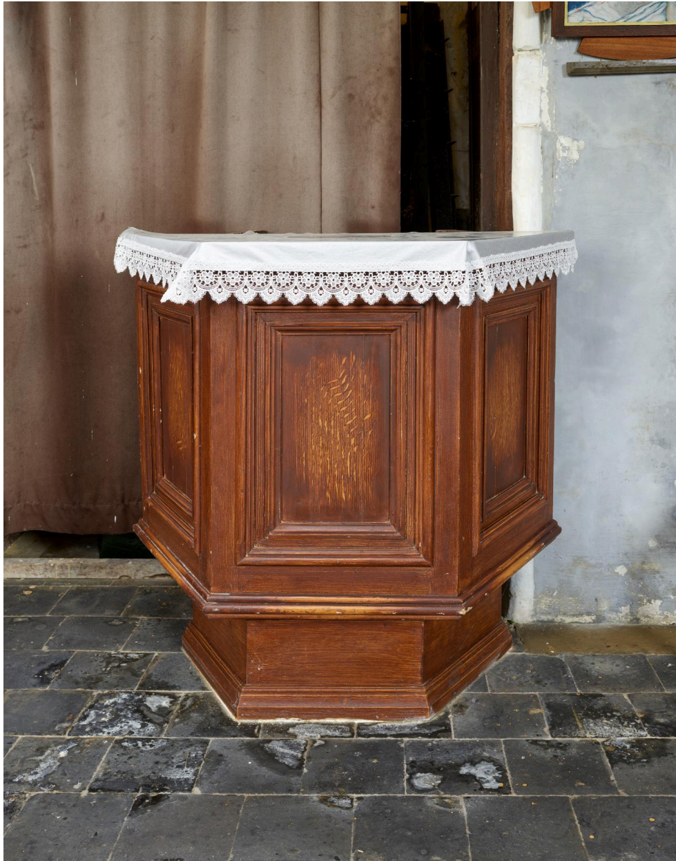
Cuve de l'ancienne chaire à prêcher.