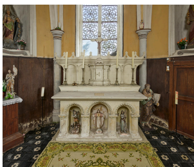
Maître-autel, XIXe siècle. IVR32_20236200215NUCA