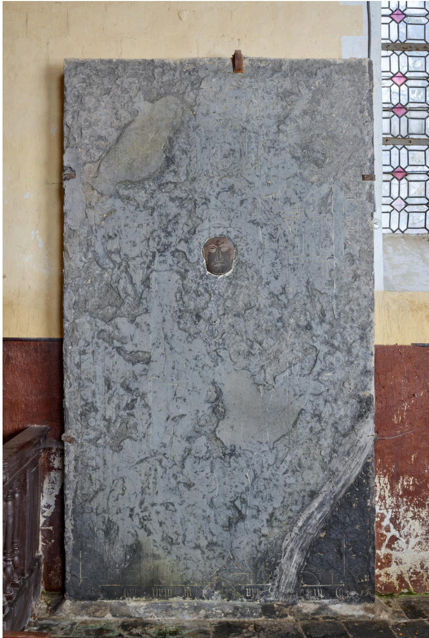
Dalle funéraire du XV e siècle.