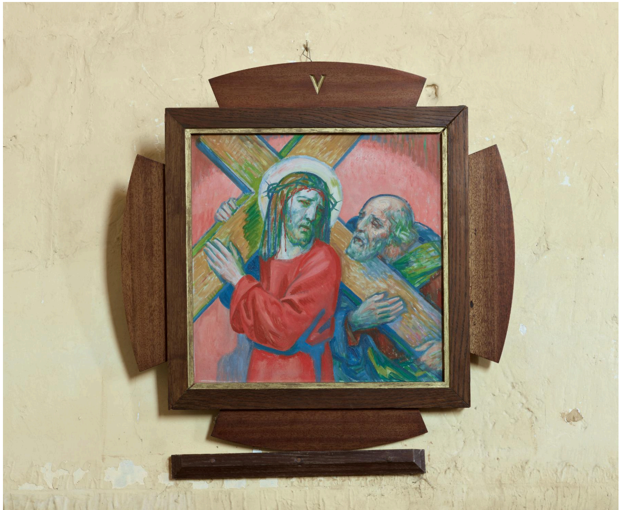
Station du chemin de croix, XXe siècle.