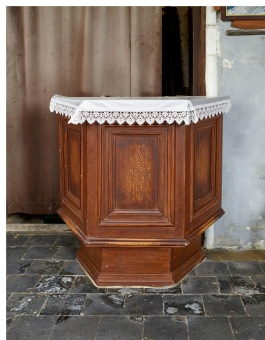
Cuve de l'ancienne chaire à prêcher.