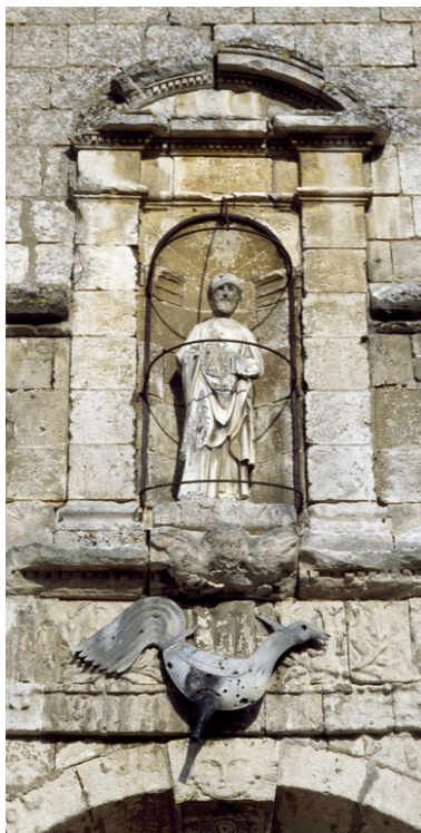
Edicule à niche abritant la statue de saint Pierre.