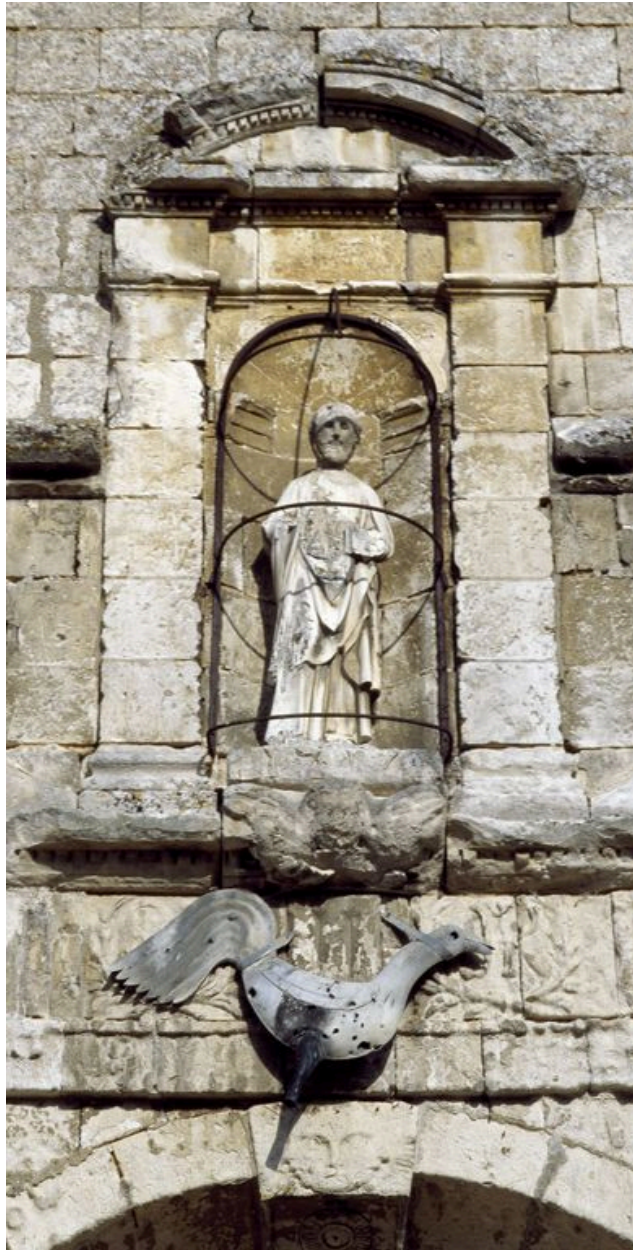
Edicule à niche abritant la statue de saint Pierre.