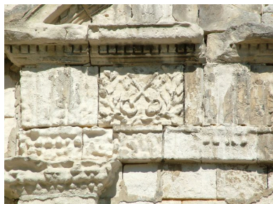
Détail de la frise ornée des clefs de saint Pierre.