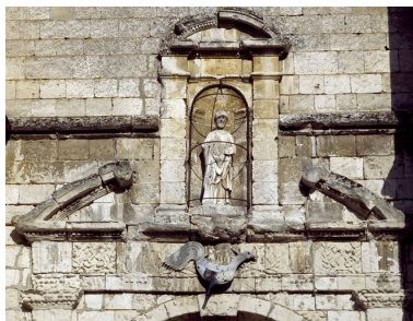
Frise, fronton brisé et édicule à niche. IVR22_20108000329XA

IVR22_20108000328XA