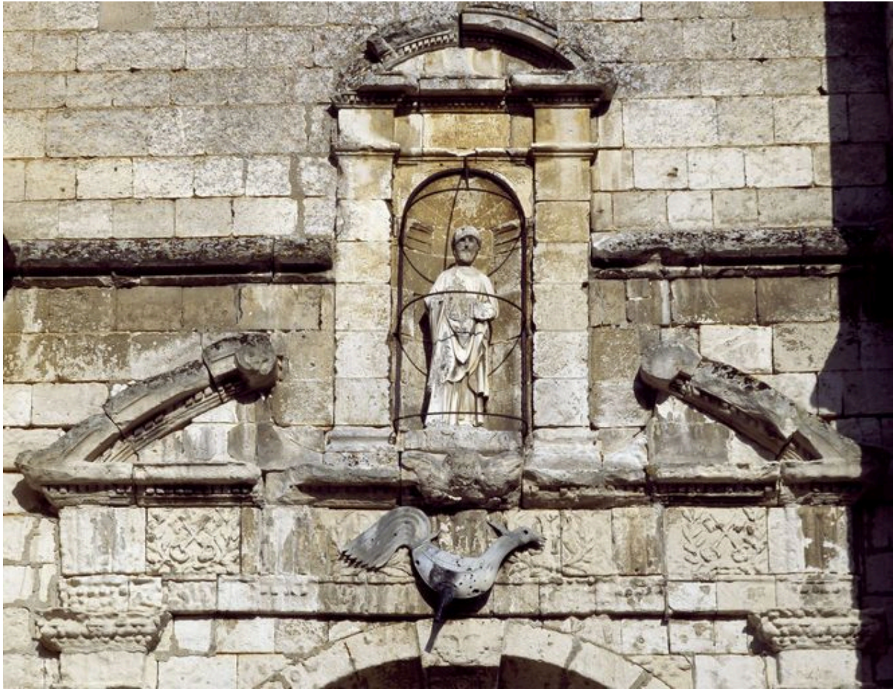
Frise, fronton brisé et édicule à niche.