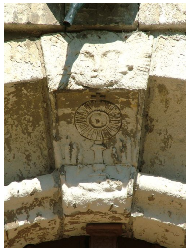
Clef de la porte ornée d'un soleil à tête humaine et d'un ostensor.

IVR22_20108001772NUCA