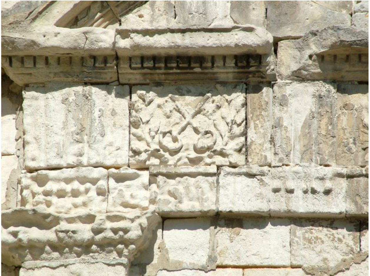
Détail de la frise ornée des clefs de saint Pierre.