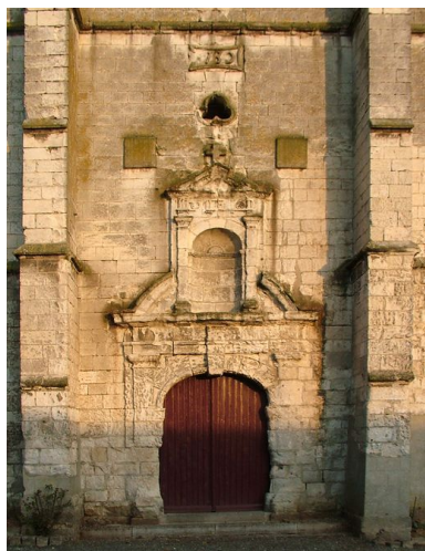
Le portail de l'église de La Chaussée-Tirancourt (Somme), portant la date de 1730.