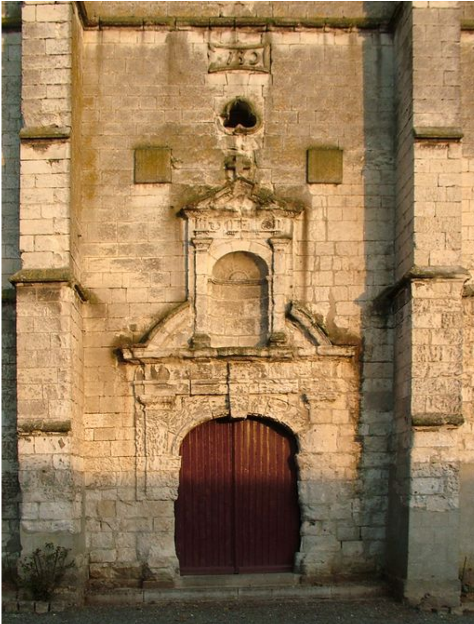
Le portail de l'église de La Chaussée-Tirancourt (Somme), portant la date de 1730.