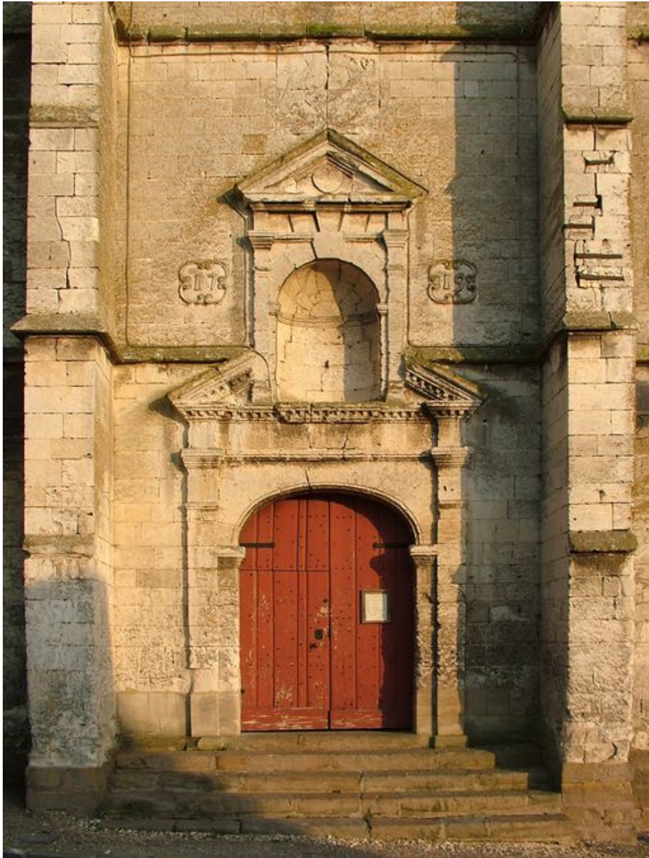
Le portail de l'église de Bourdon (Somme) portant la date de 1719.