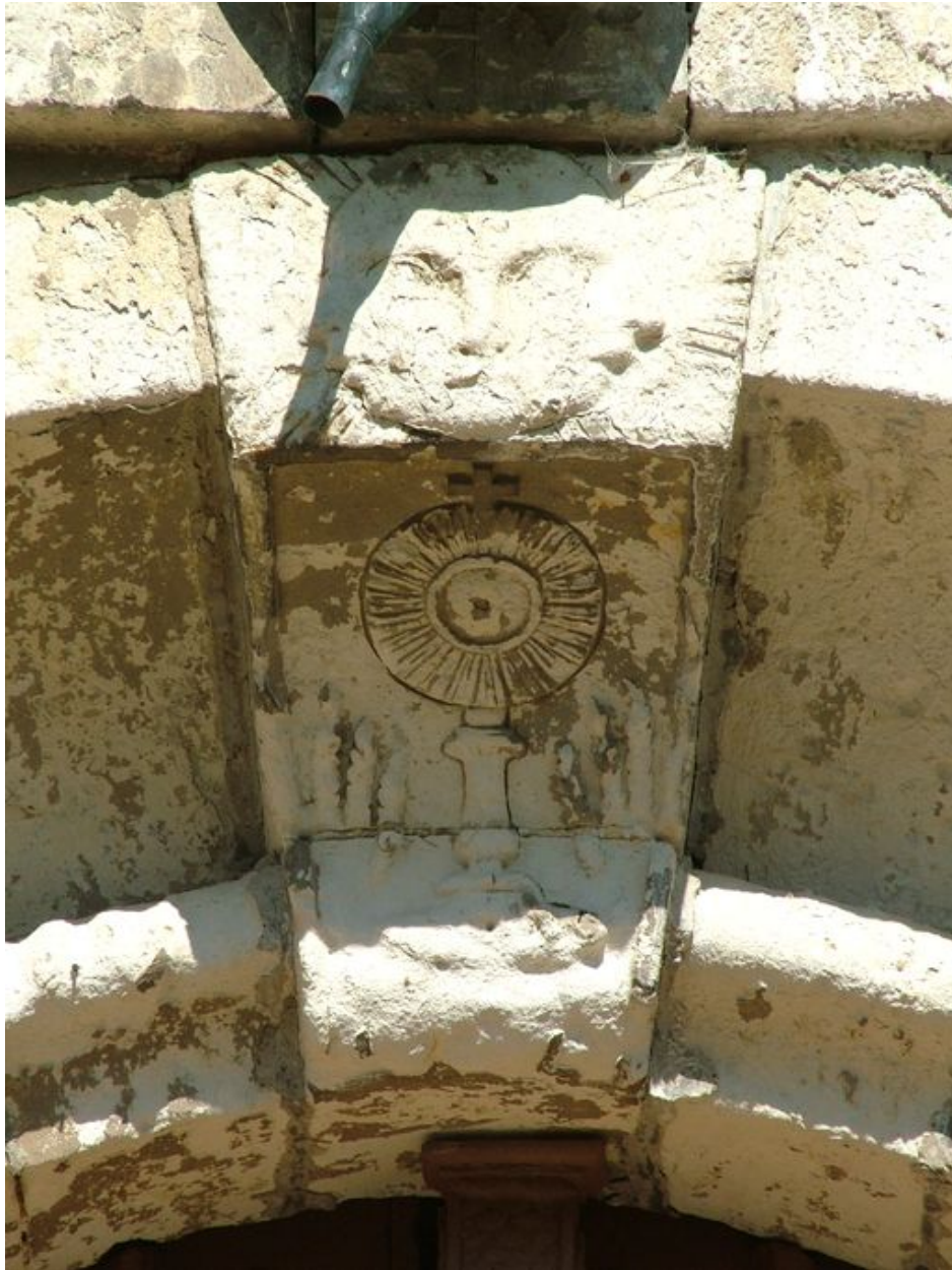
Clef de la porte ornée d'un soleil à tête humaine et d'un ostensor.