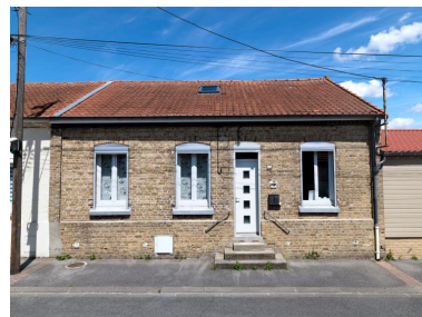
Vue de la façade d'un logement de la partie ouest de la cité. IVR32_20208000134NUC2A