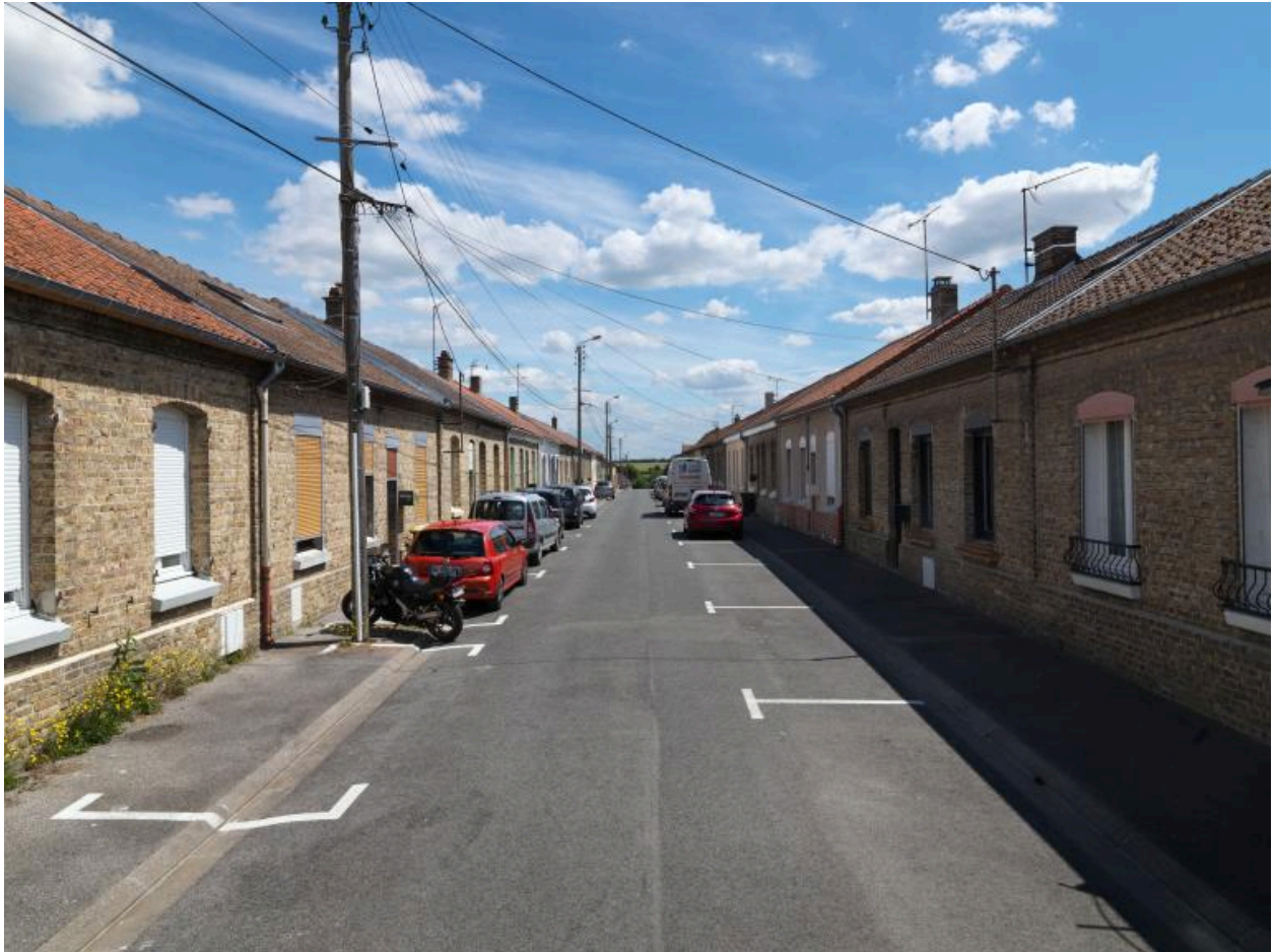
Vue générale de la partie ouest de la cité.