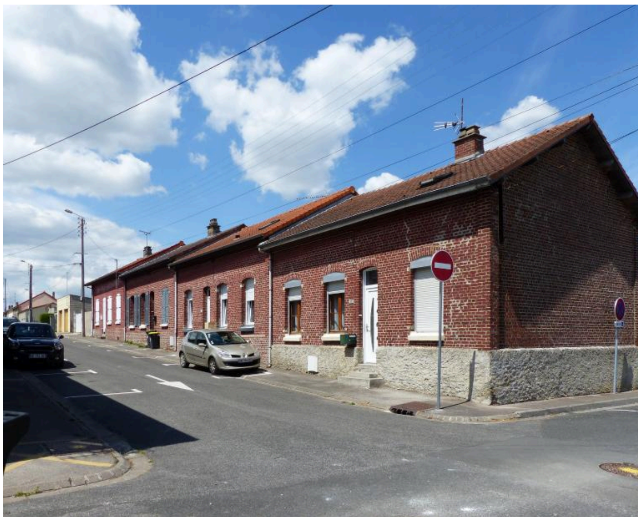
Vue de la partie est de la cité.