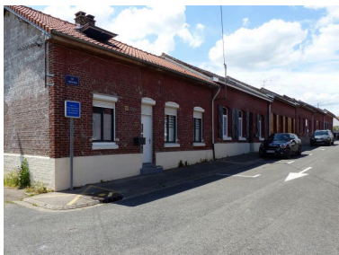
Vue de la partie est de la cité.