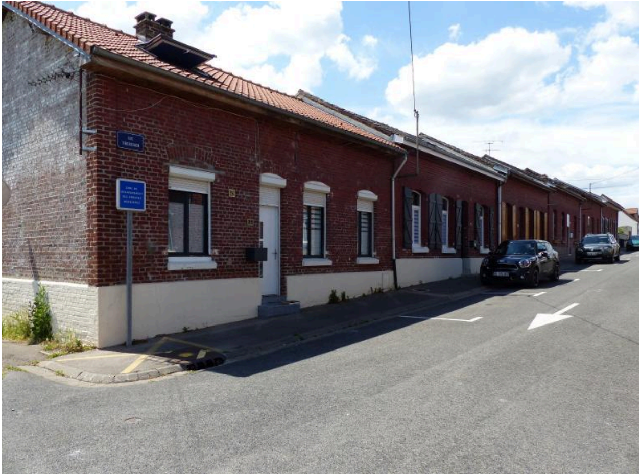
Vue de la partie est de la cite.