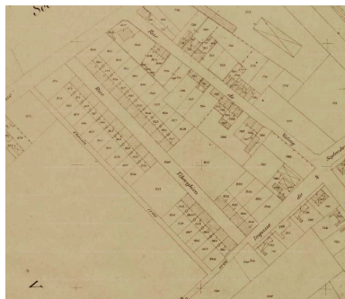
Extrait du cadastre de 1933. Section C, dite de l'Ouest, feuille C2 (AD Somme 73W_CP_696_7).