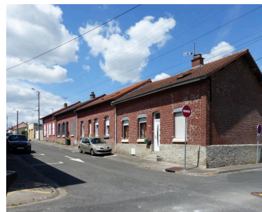
Vue de la partie est de la cité.