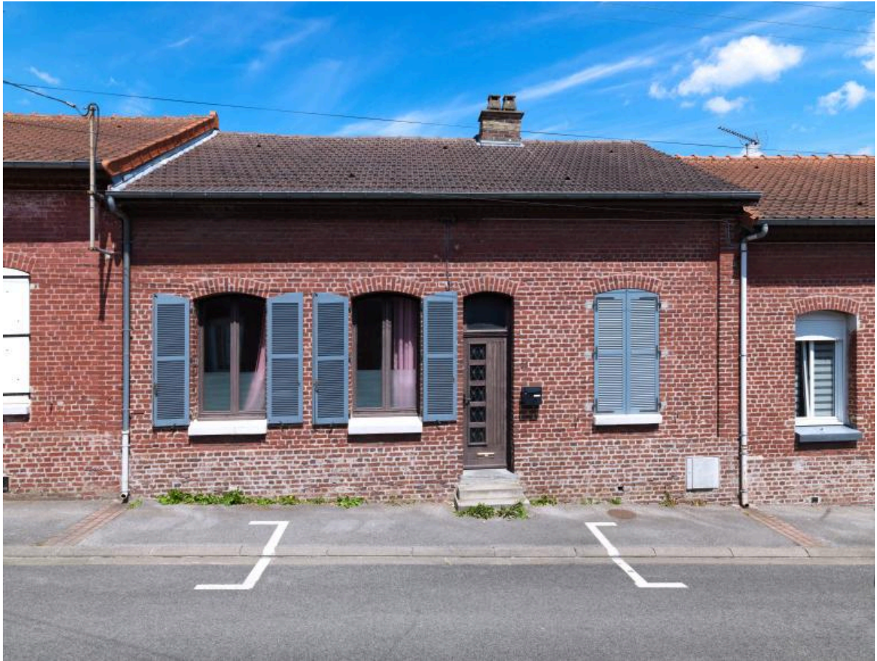
Vue de la façade d'un logement de la partie est de la cité.