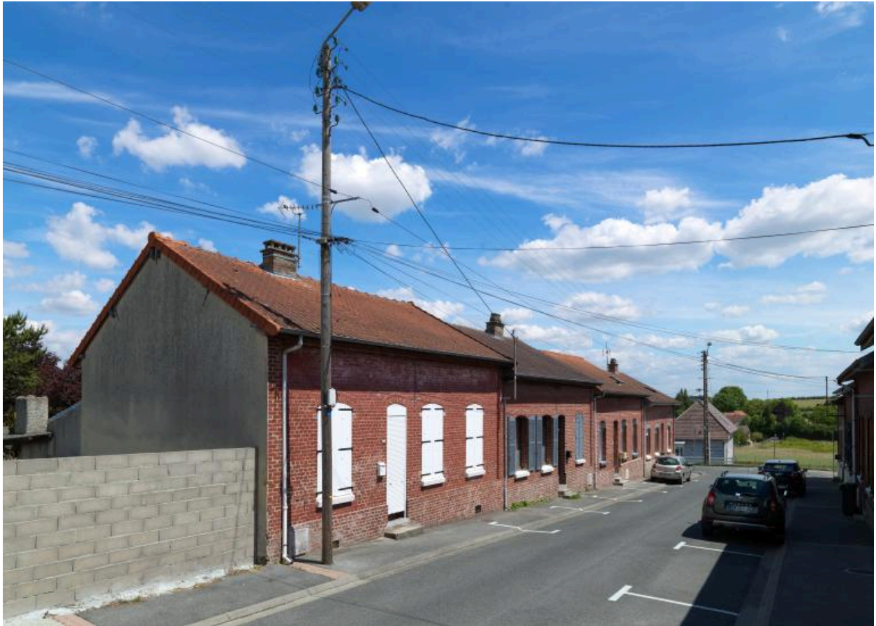
Vue de la rive nord de la partie est de la cité.