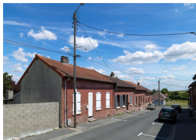
Vue de la rive nord de la partie est de la cité.