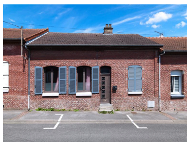
Vue de la façade d'un logement de la partie est de la cité. IVR32_20208000132NUC2A