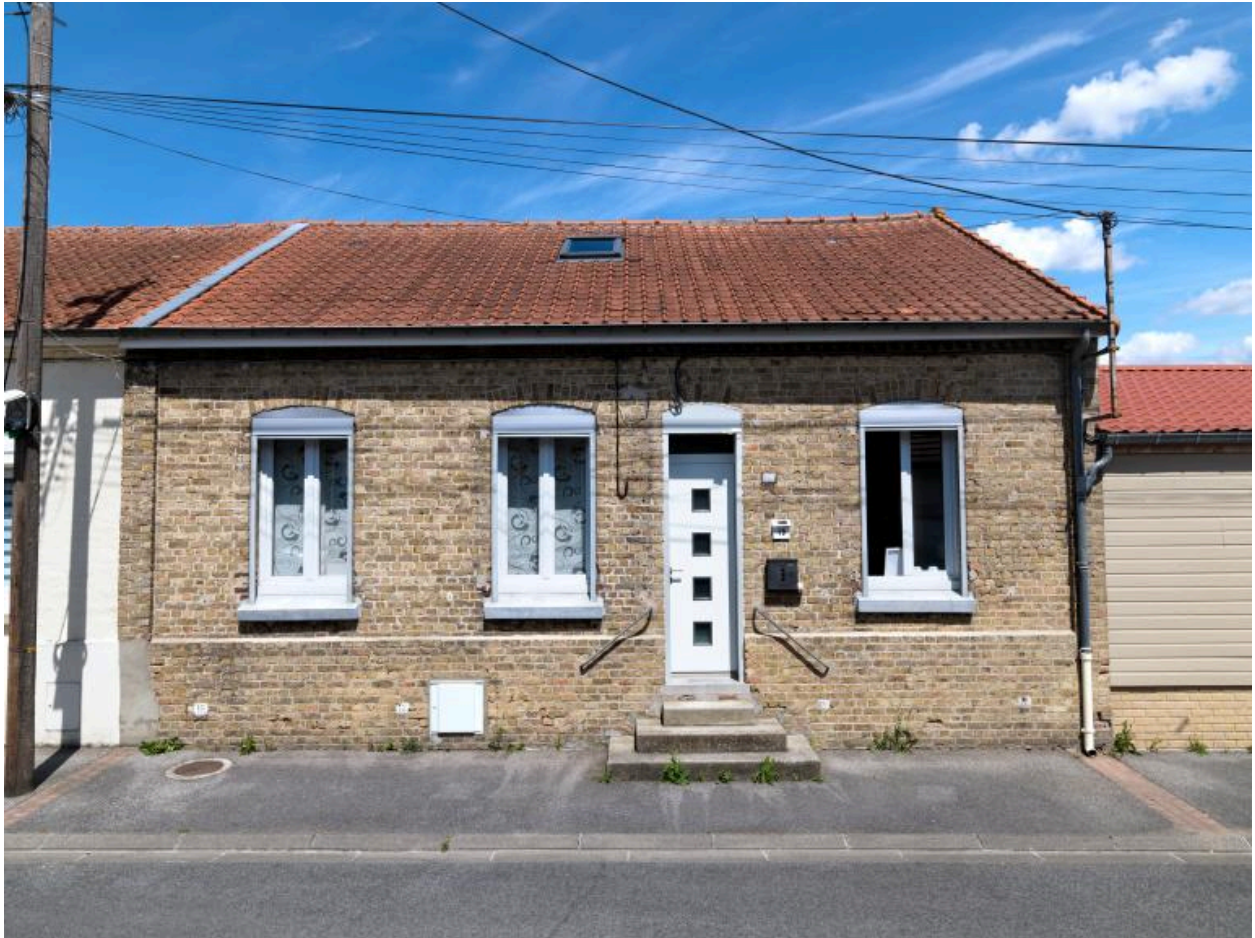
Vue de la façade d'un logement de la partie ouest de la cité.