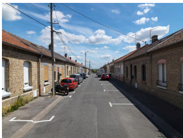
Vue générale de la partie ouest de la cité.