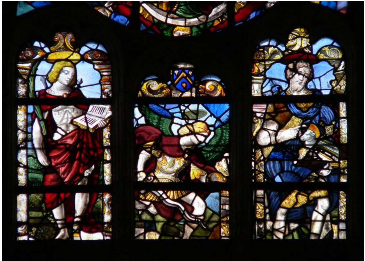
Vue des trois lancettes.