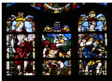
Vue des trois lancettes. IVR22_20090201011NUCA