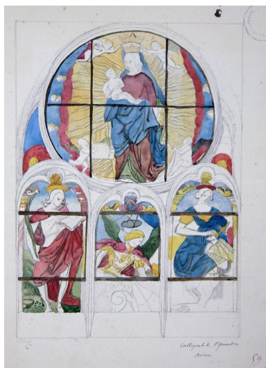
Dessin aquarellé de la verrière, vers 1869.