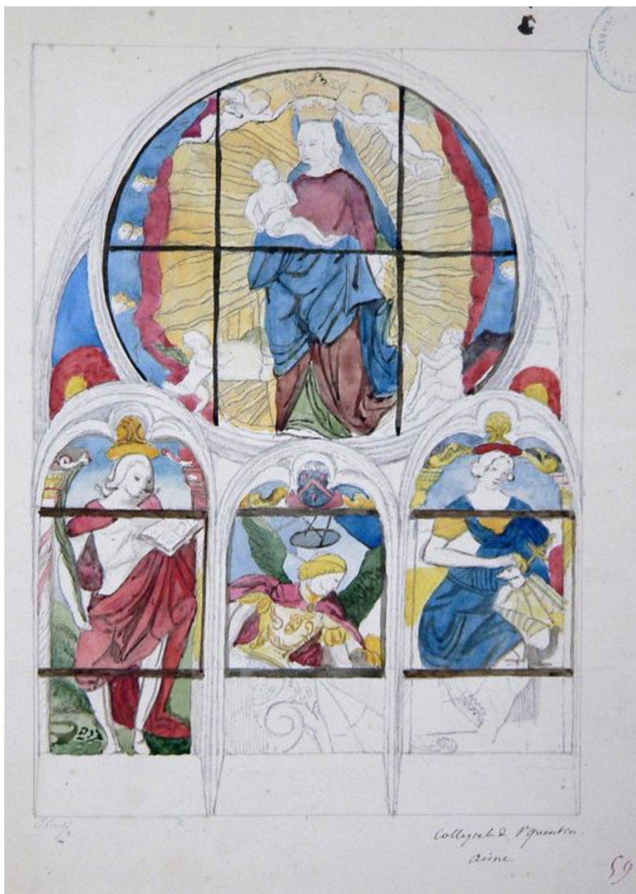
Dessin aquarellé de la verrière, vers 1869 (AMH, Médiathèque du Patrimoine : 82/02/2050).