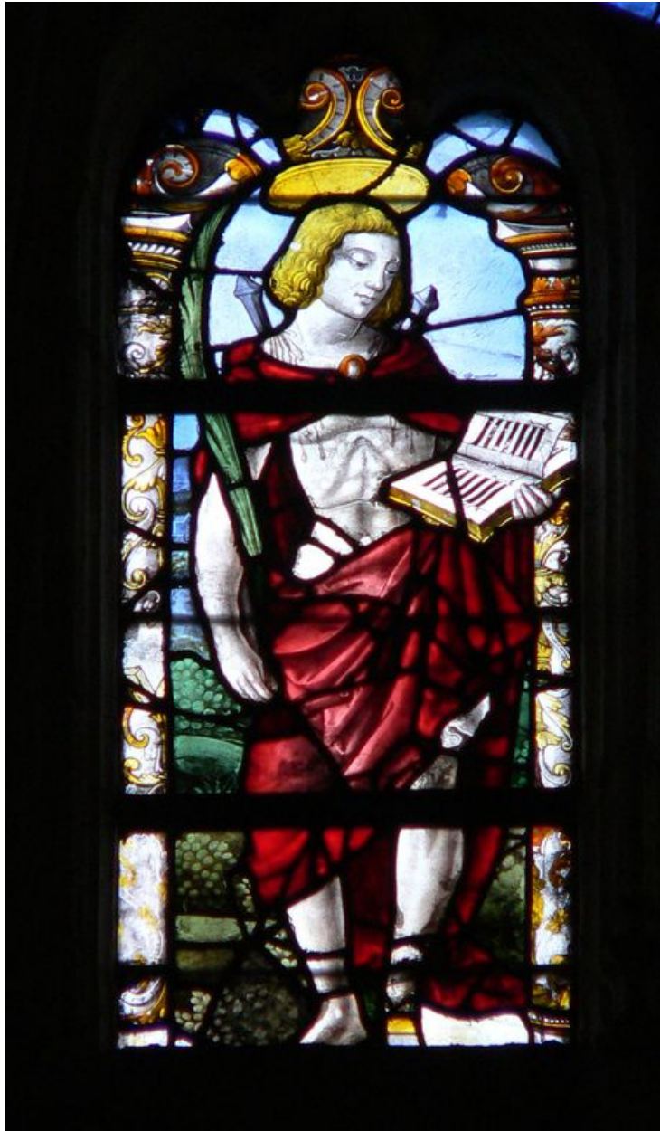
Vue de la lancette gauche représentant saint Quentin.