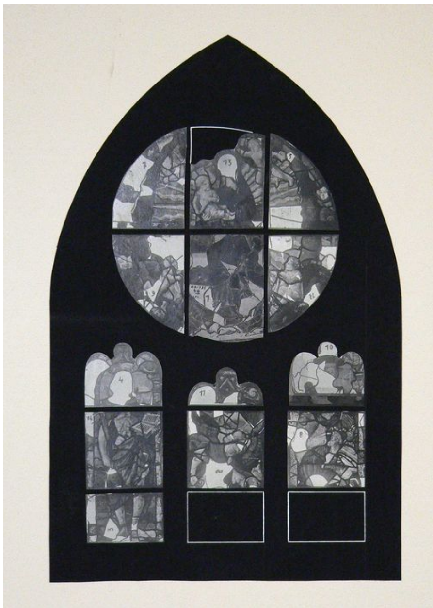
Montage photographique de la verrière, avant restauration, par le photographe Haas (AMH, Médiathèque du Patrimoine : 80/125/6).