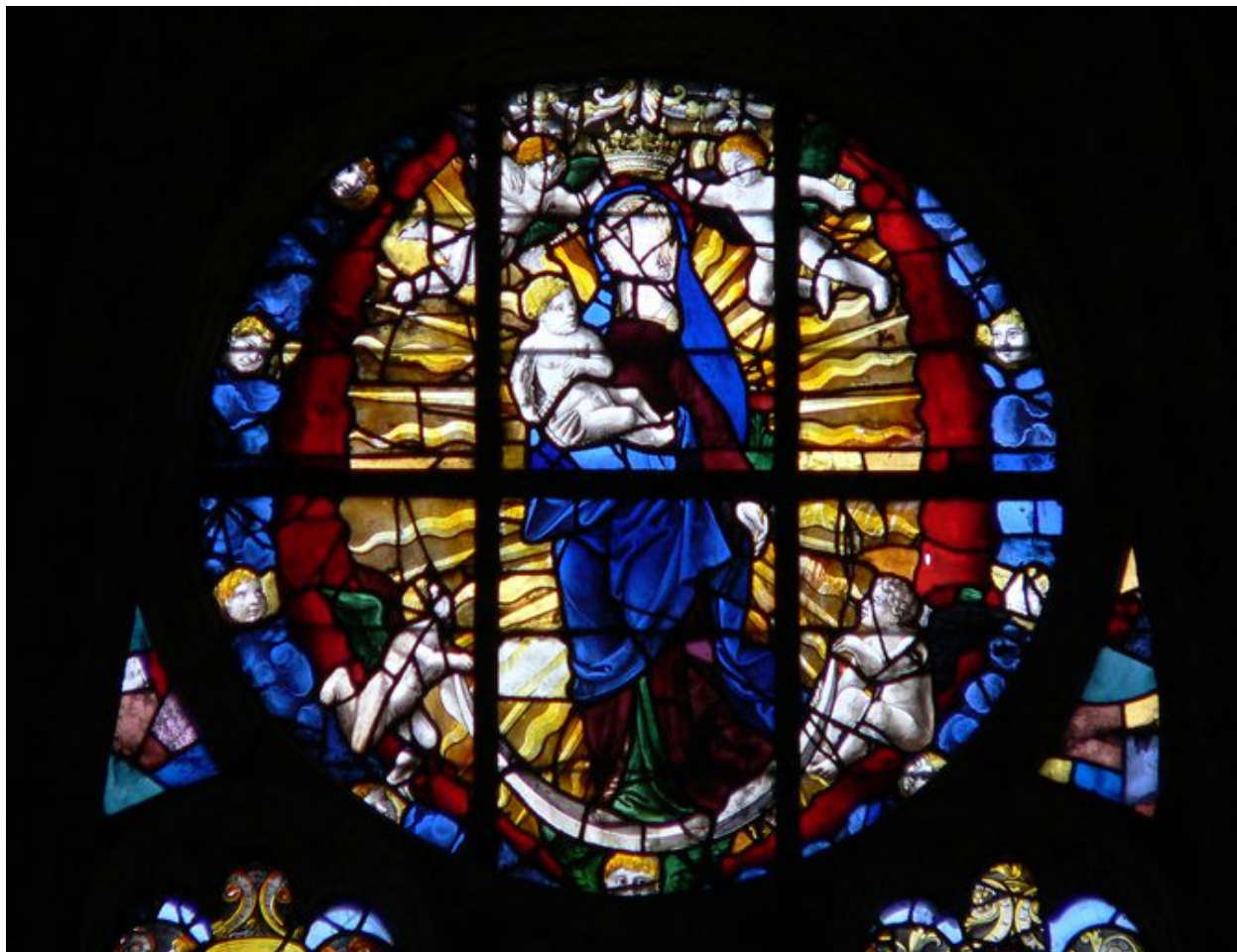
Vue de l'oculus de réseau représentant l'Immaculée Conception.