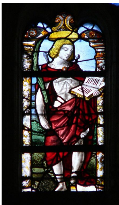
Vue de la lancette gauche représentant saint Quentin.