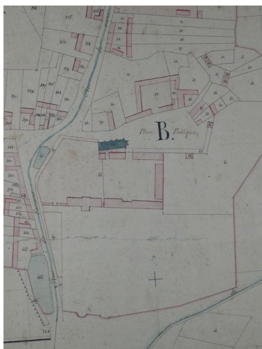
Extrait du cadastre napoléonien (DGI).