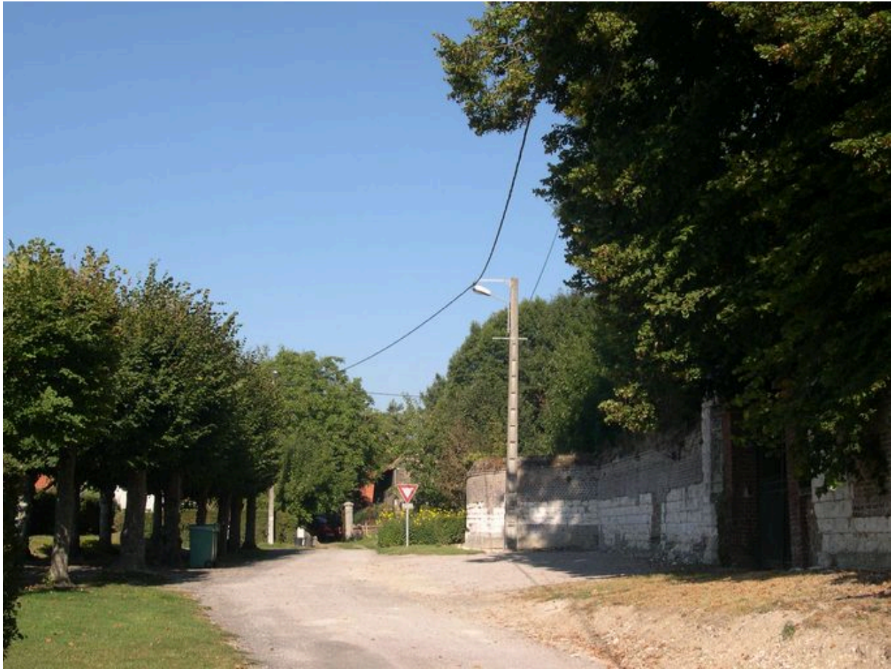
Le mur sud de la propriété, face à l'ancien bassin.