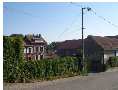
La ferme du château, vue du sud-ouest. IVR22_20038010735NUCA