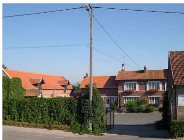
La ferme du château, vue du sud-est.