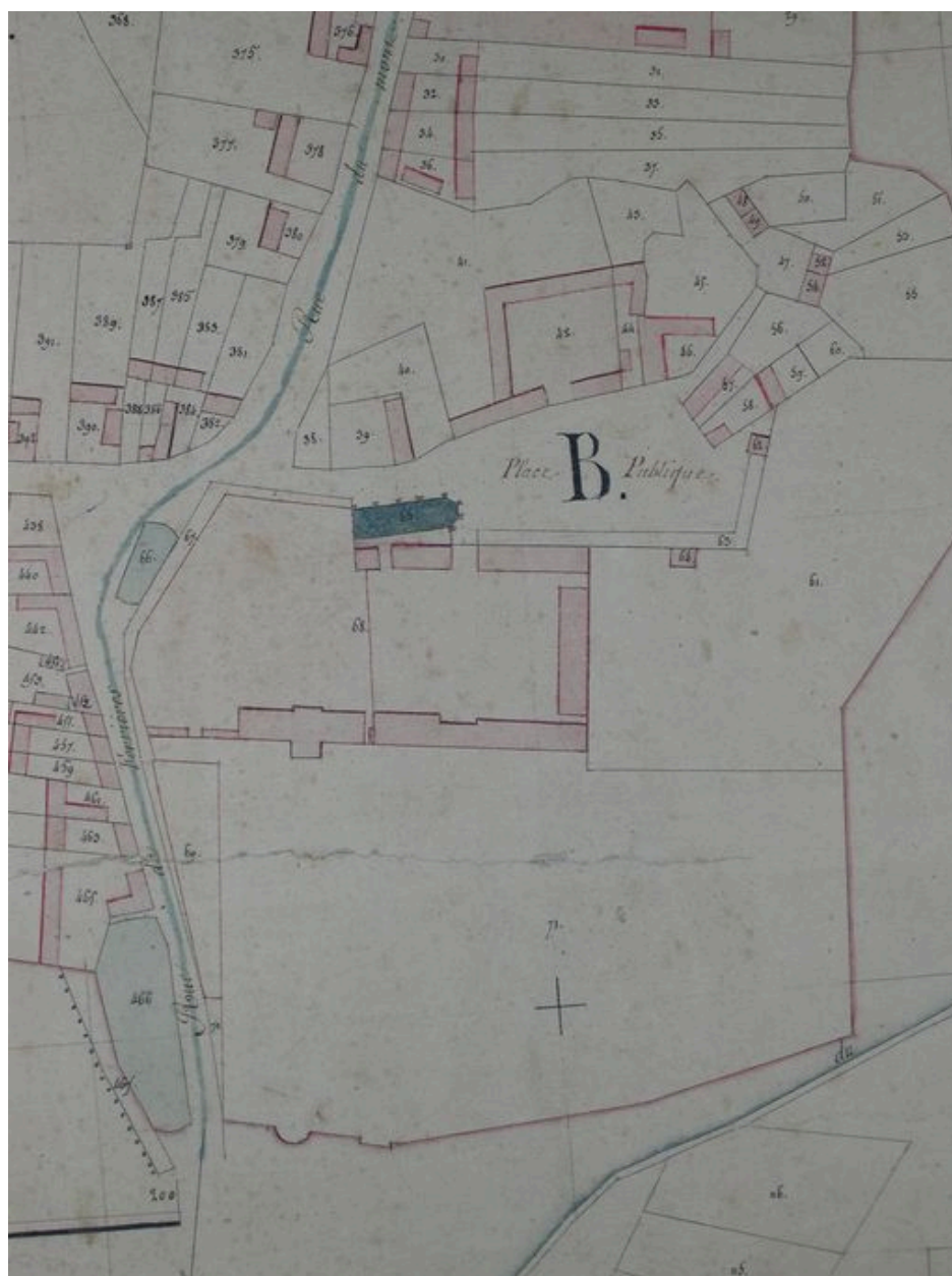
Extrait du cadastre napoléonien (DGI).