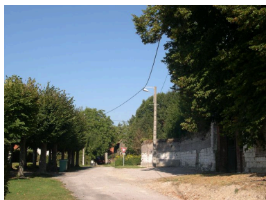
Le mur sud de la propriété, face à l'ancien bassin.