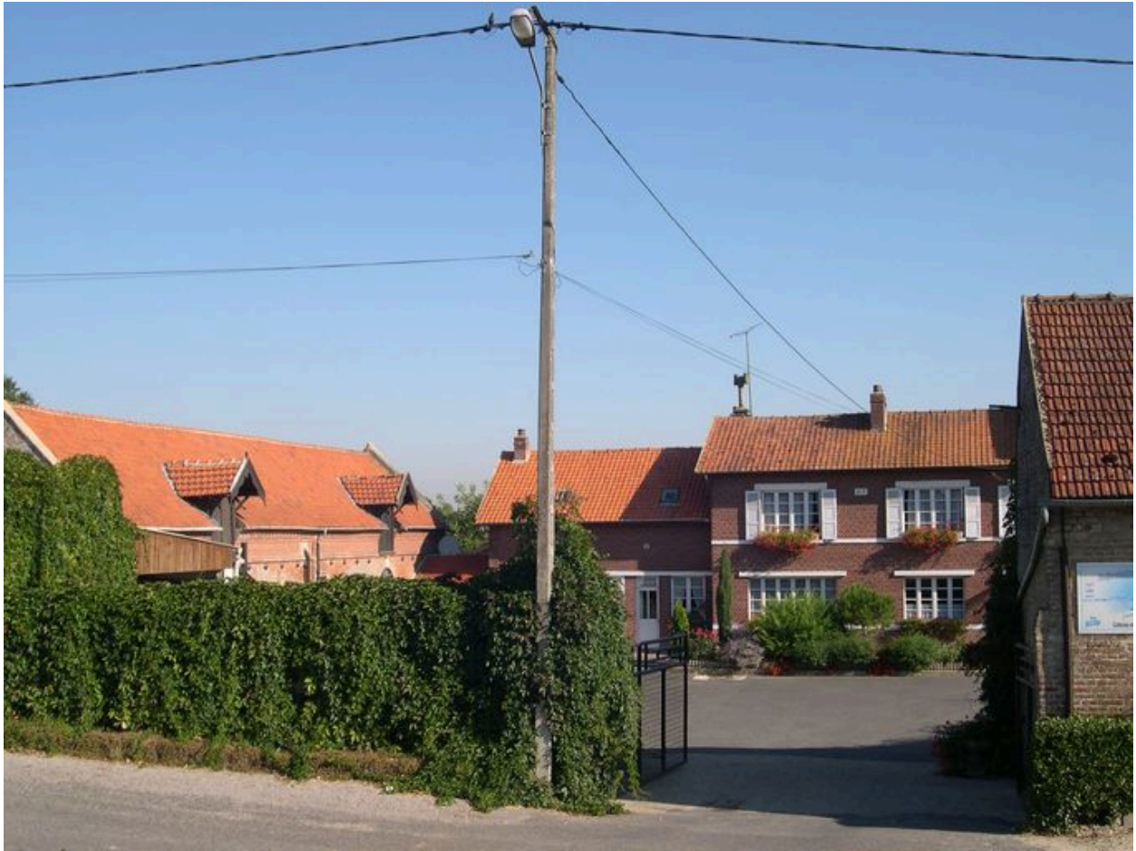
La ferme du château, vue du sud-est.