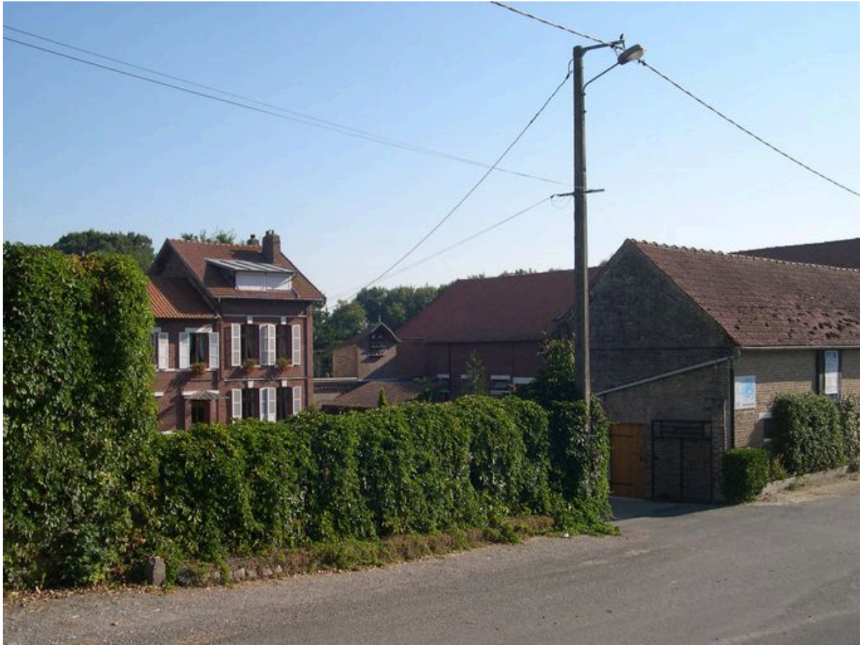
La ferme du château, vue du sud-ouest.