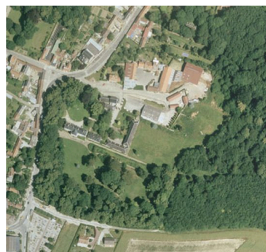
Vue aérienne.