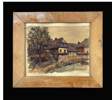
Vue du dessin : Vue d'une ferme à Dohis, avec un arbre.