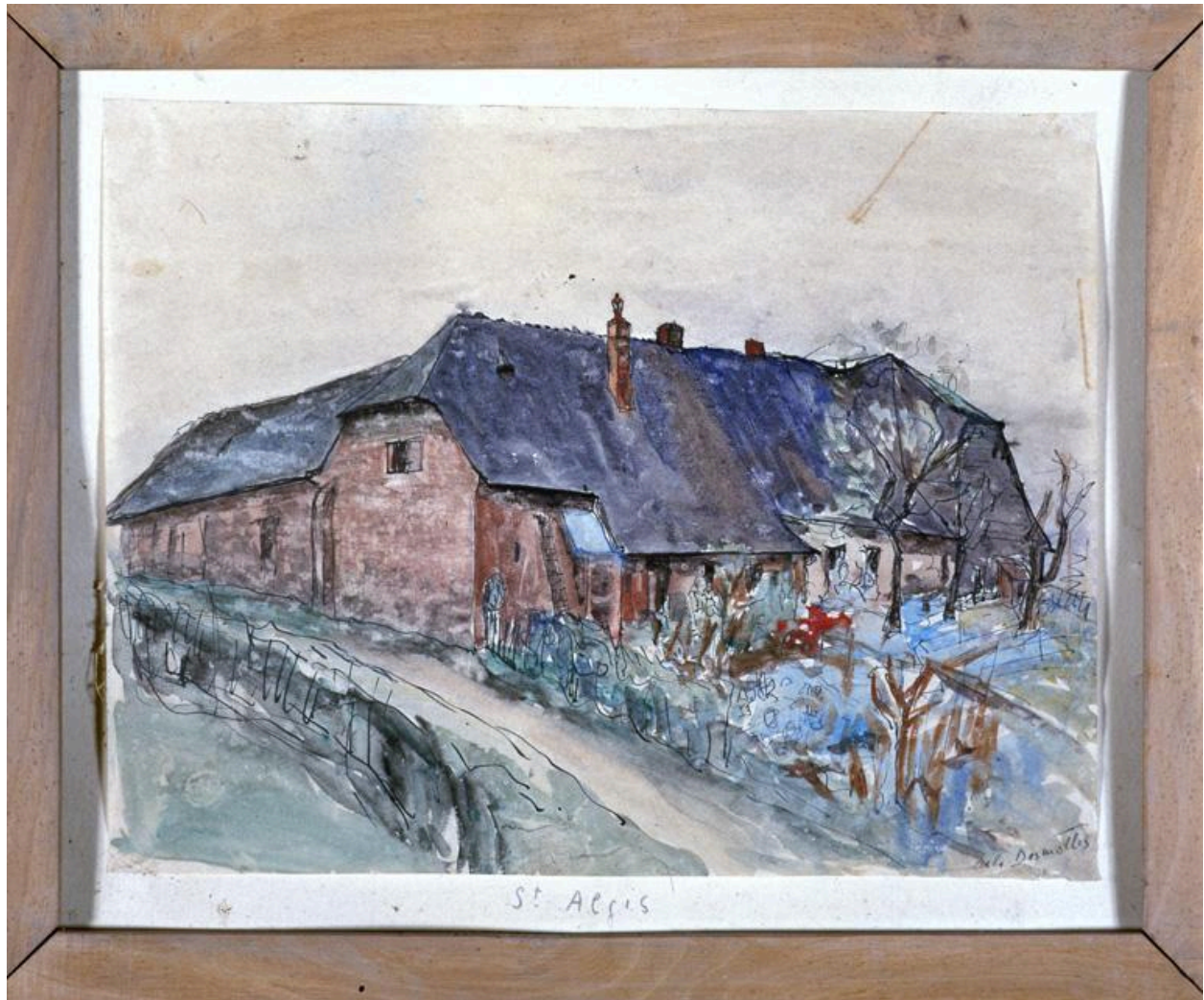
Vue du dessin : Vue d'une ferme à Saint-Algis.