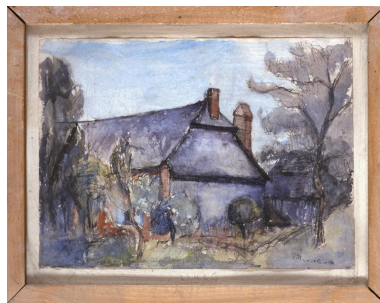
Vue du dessin : Vue d'une ferme à Dohis, depuis la route. IVR22_20010201972XA