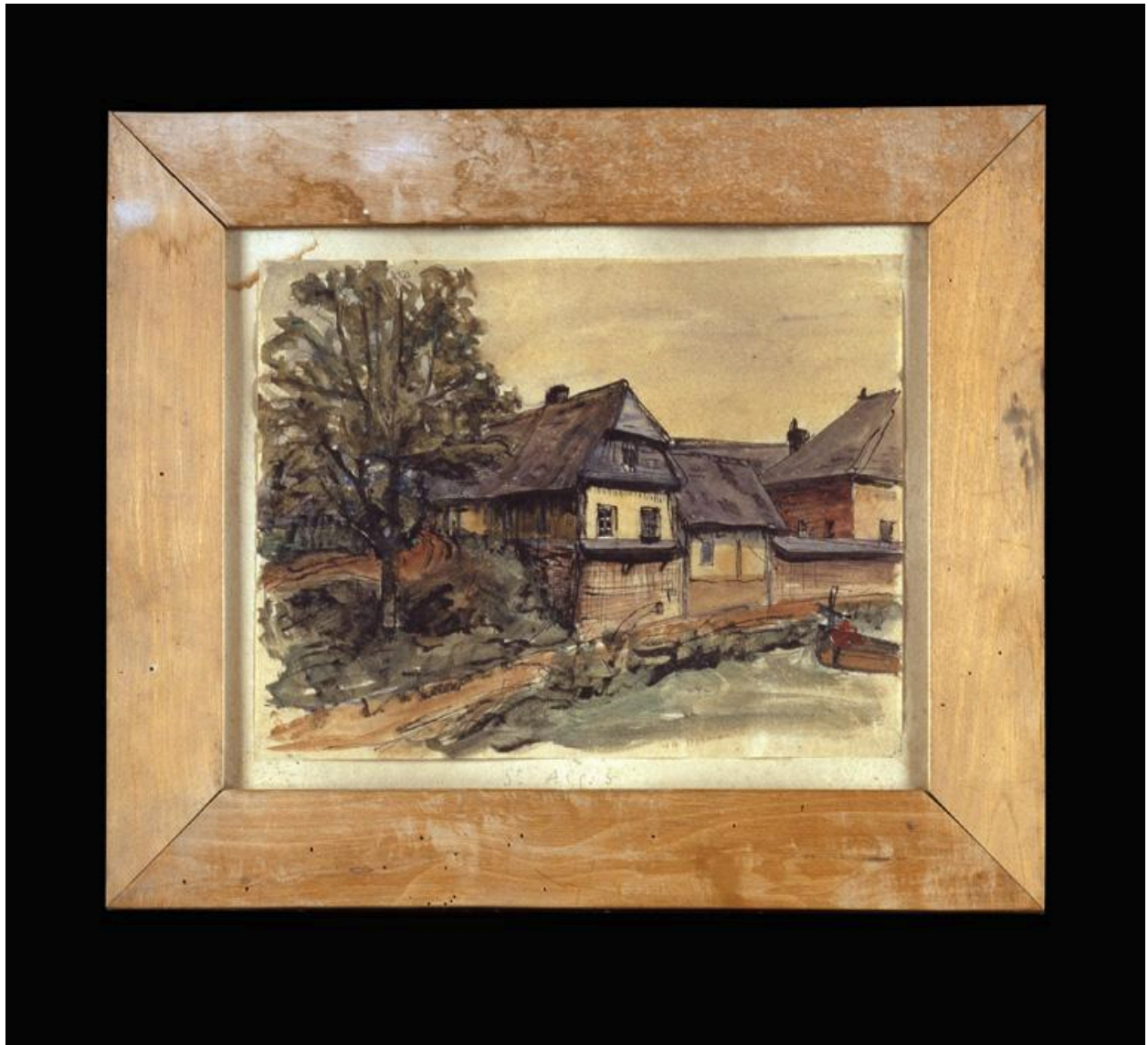
Vue du dessin : Vue d'une ferme à Dohis, avec un arbre.