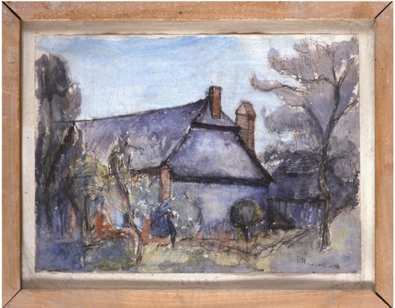
Vue du dessin : Vue d'une ferme à Dohis, depuis la route.