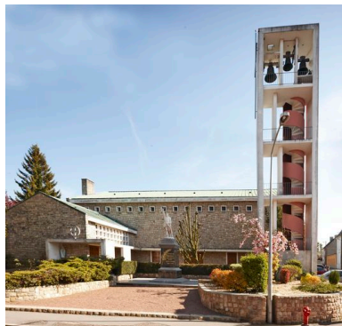
Vue générale. IVR31_20106200652NUCA