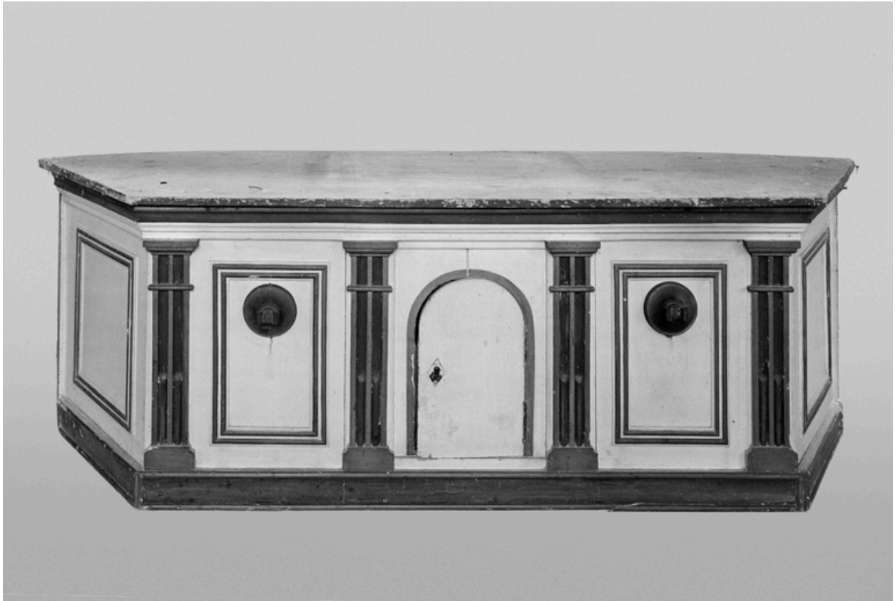
Ancien tabernacle d'un autel latéral.