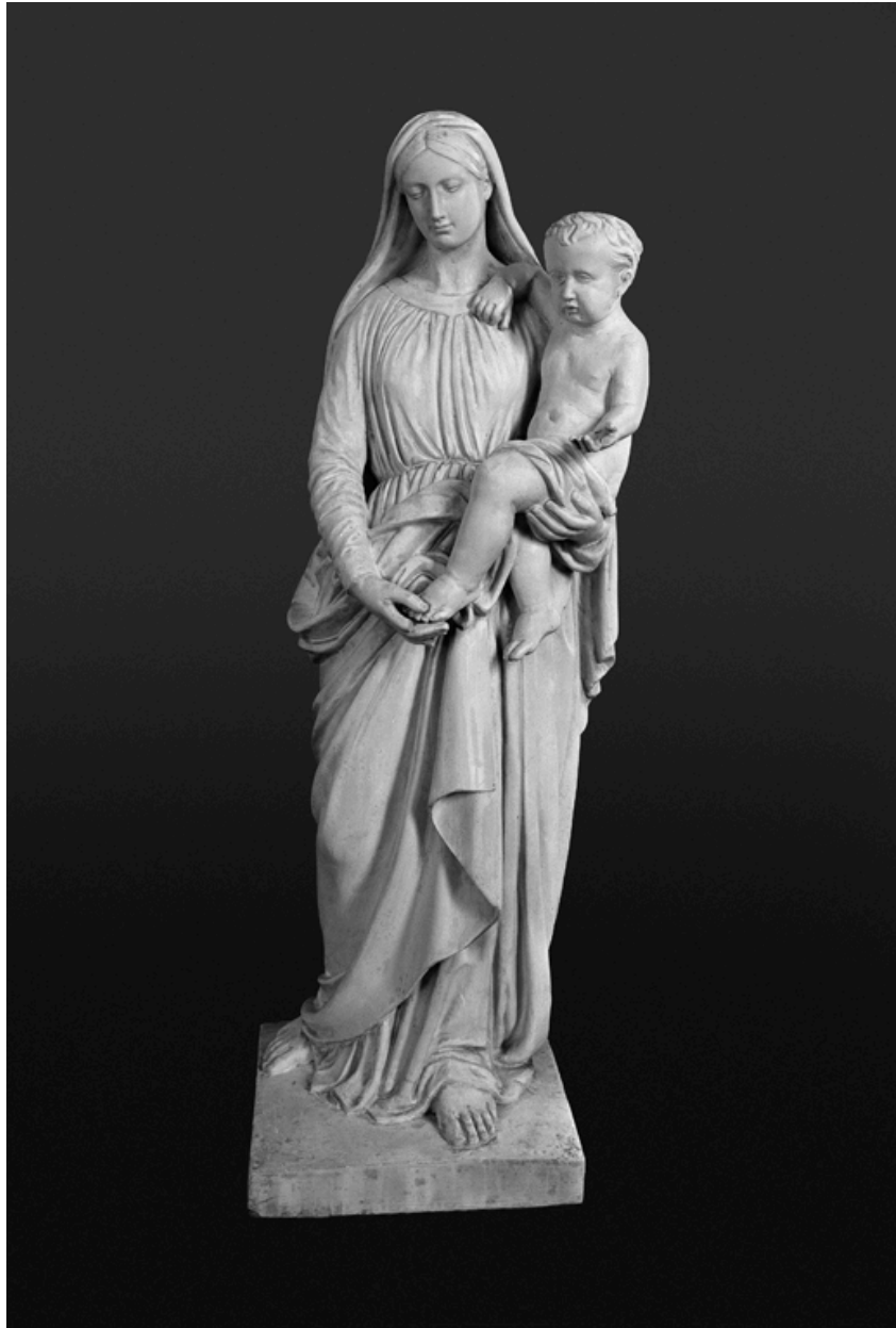
Statue de la Vierge à l'Enfant.