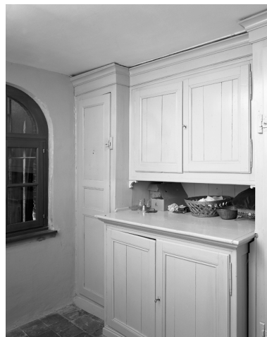
Le meuble de sacristie fermé. IVR22_19910201073V