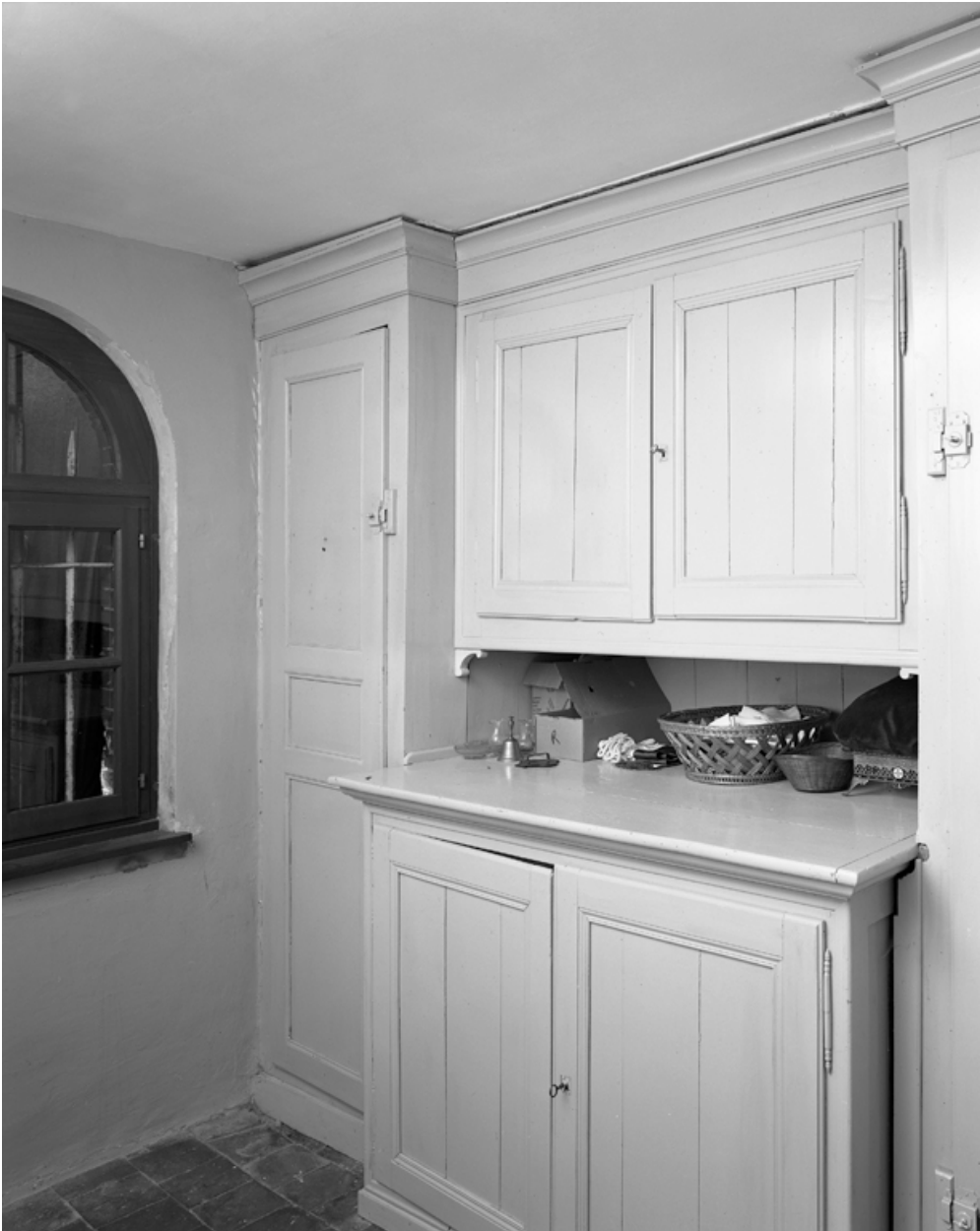
Le meuble de sacristie fermé.