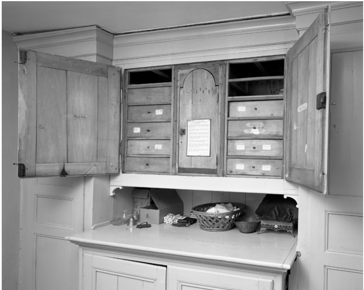
Le meuble de sacristie ouvert.