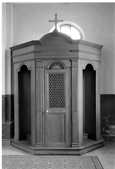
Confessionnal.