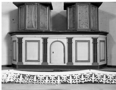
Ancien tabernacle d'un autel latéral.