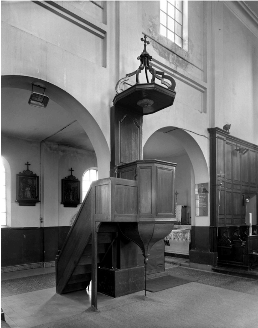
Chaire à prêcher.