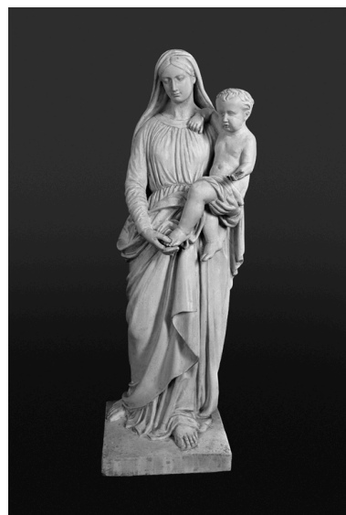
Statue de la Vierge à l'Enfant. IVR22_19910201054X