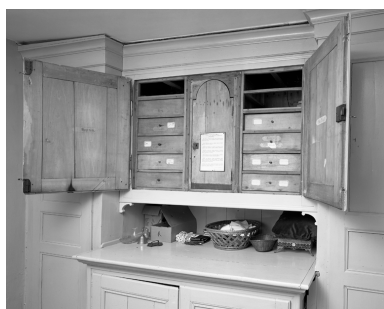
Le meuble de sacristie ouvert. IVR22_19910201074V