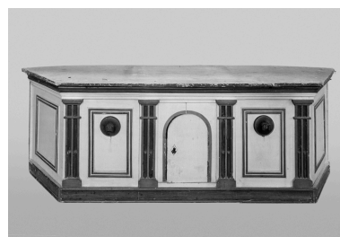
Ancien tabernacle d'un autel latéral. IVR22_19910201062X