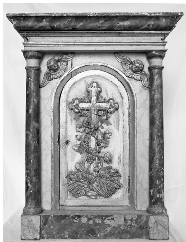
Tabernacle. IVR22_19910201057X