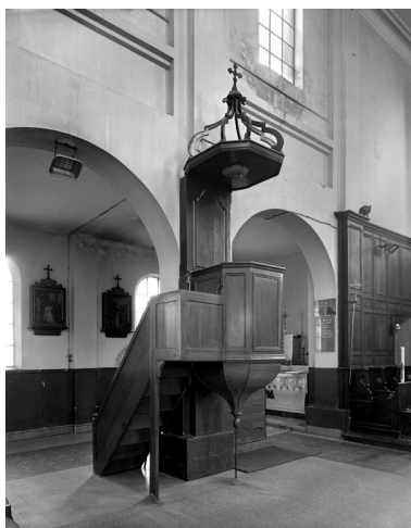
Chaise à prêcher. IVR22_19910201069V