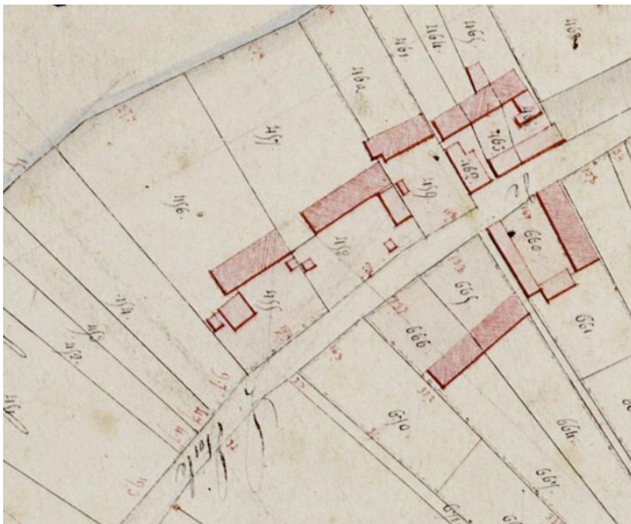
Détail du plan cadastral, section B2 développement, par Sannier Jeune et Honoré, 1834.(AD Somme ; 3P 1564/4).