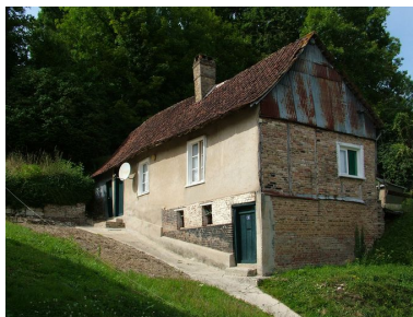
Vue générale. IVR22_20098005268NUCA