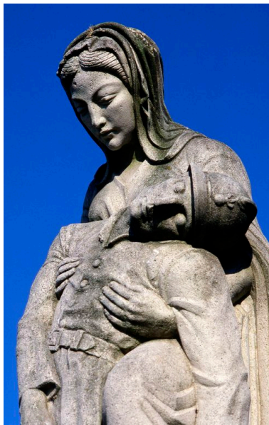
Vue générale. IVR22_19948000342ZA