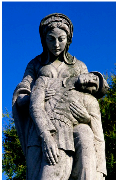
Vue générale. IVR22_19948000340ZA