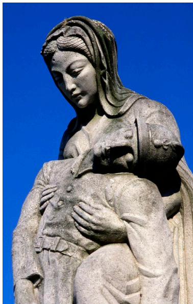
Vue générale. IVR22_19948000342ZA