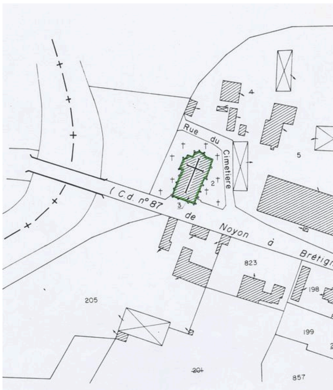
Plan de situation. Extrait du plan cadastral de 1982, section AI 3.