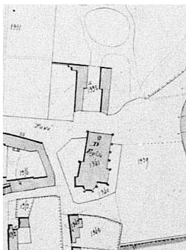
Extrait du cadastre napoléonien (DGI).