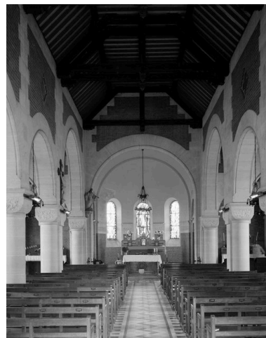
Vue intérieure vers le chœur. IVR22_19846001260V