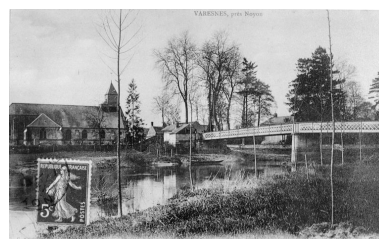
Vue avant 1914 (AP). IVR22_19856000229XB