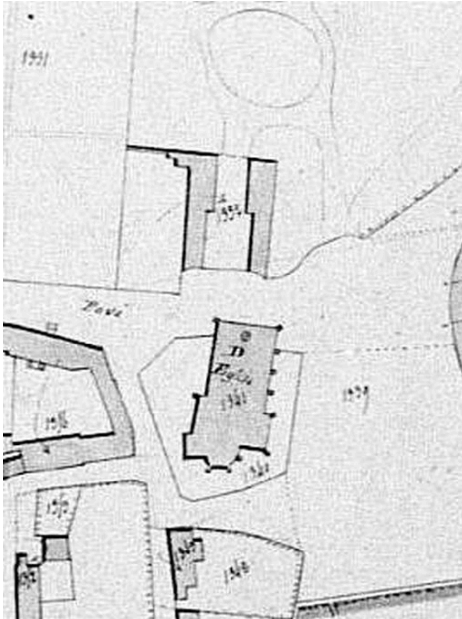
Extrait du cadastre napoléonien (DGI).