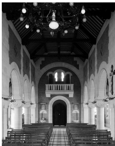
Vue intérieure vers l'entrée.