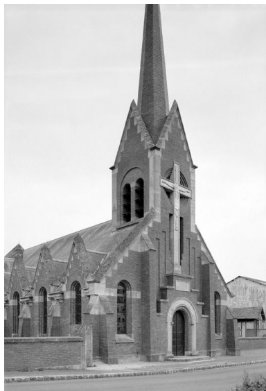
Façade occidentale. IVR22_19846001076X