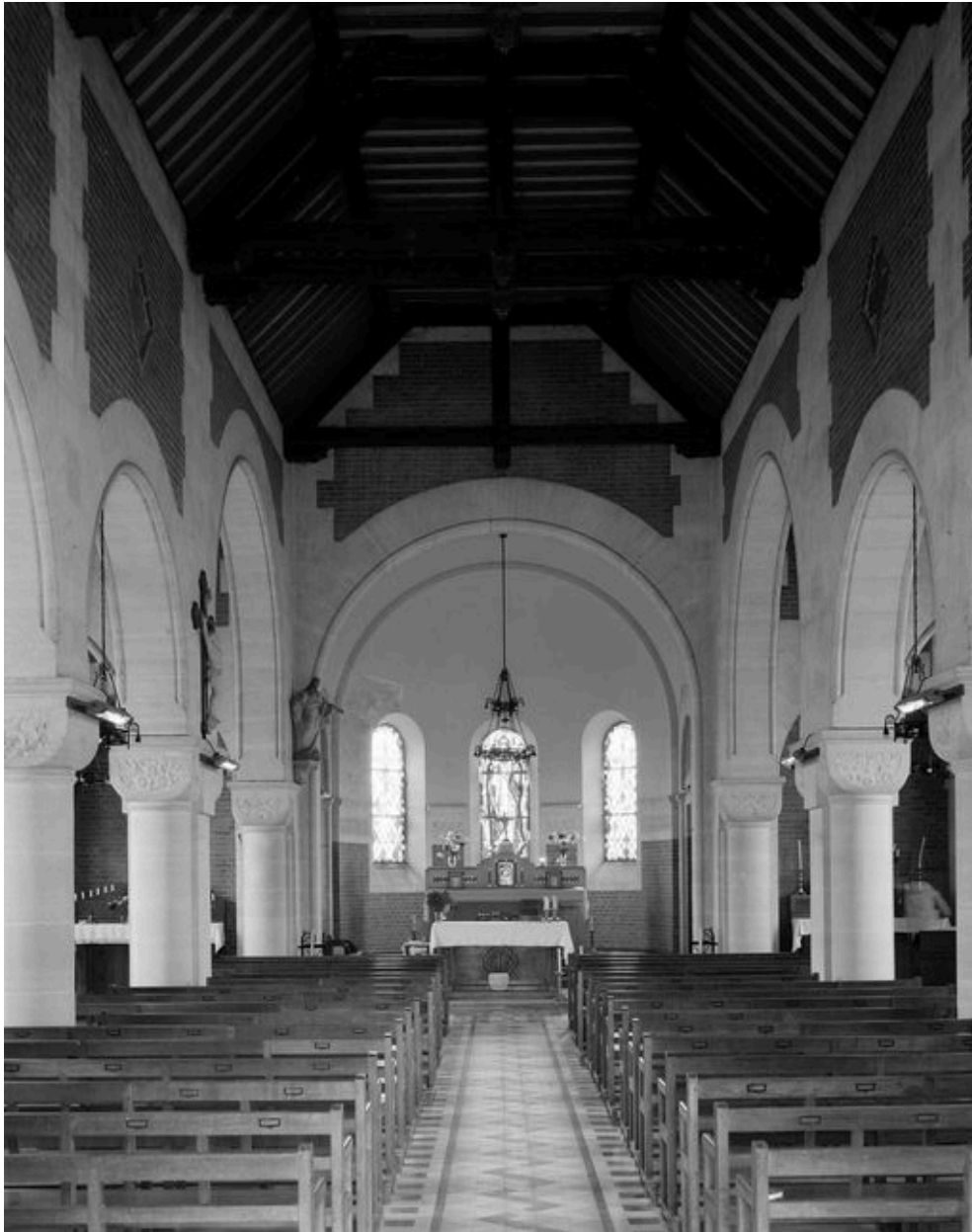
Vue intérieure vers le choeur.