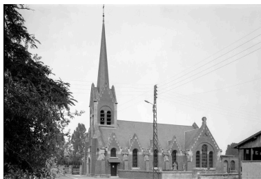
Élévation sud. IVR22_19846001075X