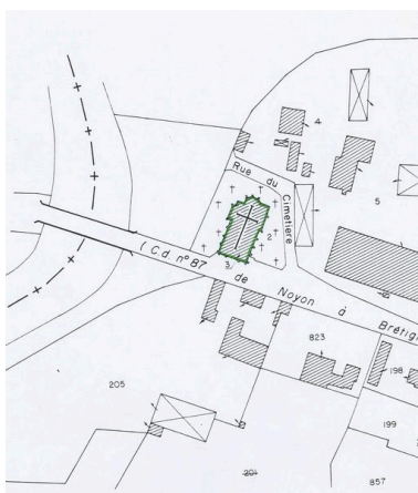
Plan de situation. Extrait du plan cadastral de 1982, section AI 3.