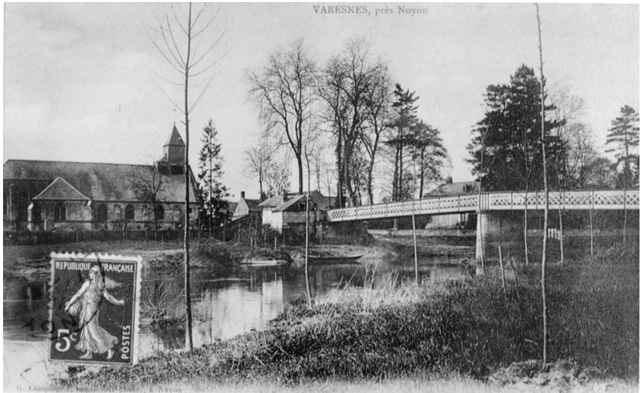
Vue avant 1914.