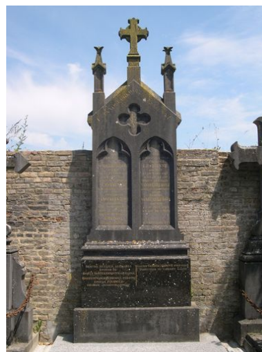
Vue de la stèle. IVR22_20058002143NUCA