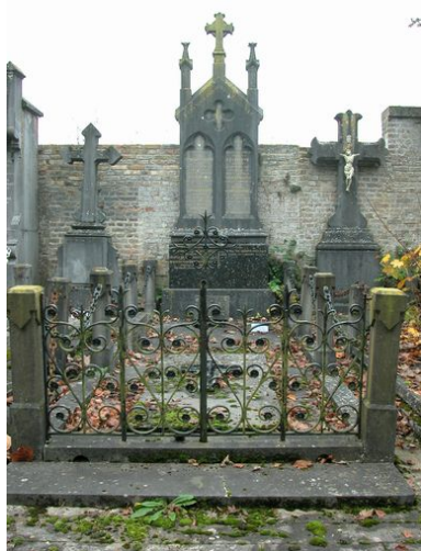
Vue générale, avec la grille. IVR22_20048001200NUCA