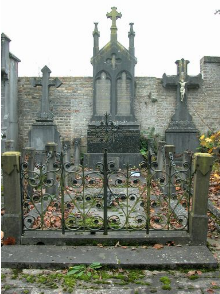
Vue générale, avec la grille.