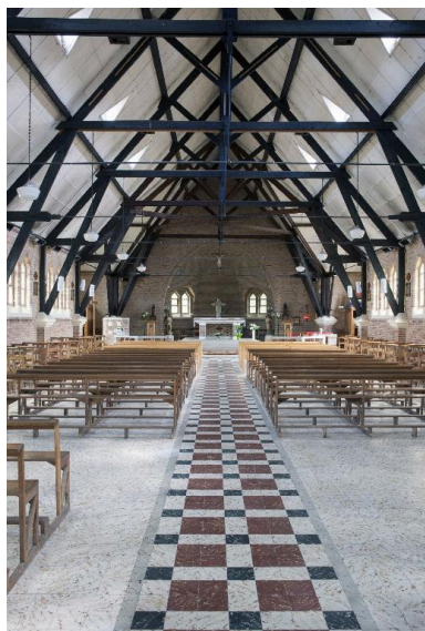
Vue générale vers le chœur. IVR31_20155900159NUCA