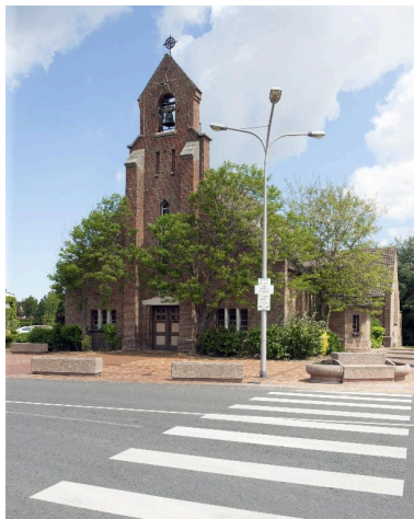
Vue de trois-quart de l'élévation antérieure et côté droit. IVR31_20155900158NUCA