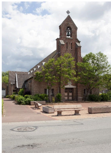
Vue de trois-quart de l'élévation antérieure et côté gauche. IVR31_20155900157NUCA