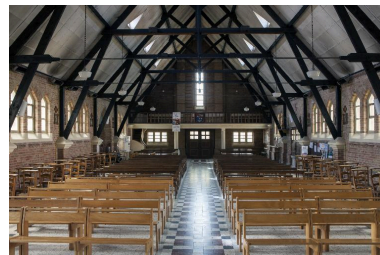
Vue générale depuis le chœur.