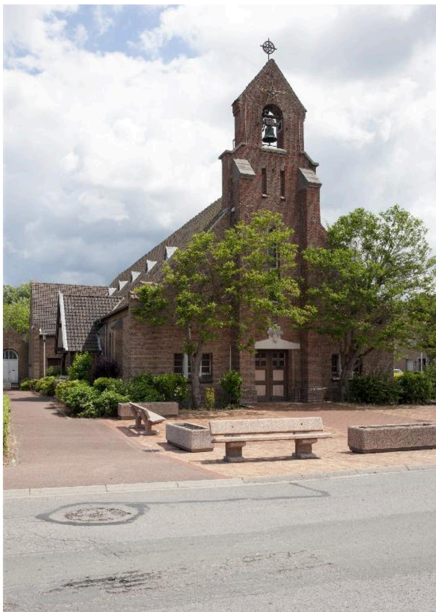
Vue de trois-quart de l'élévation antérieure et côté gauche.