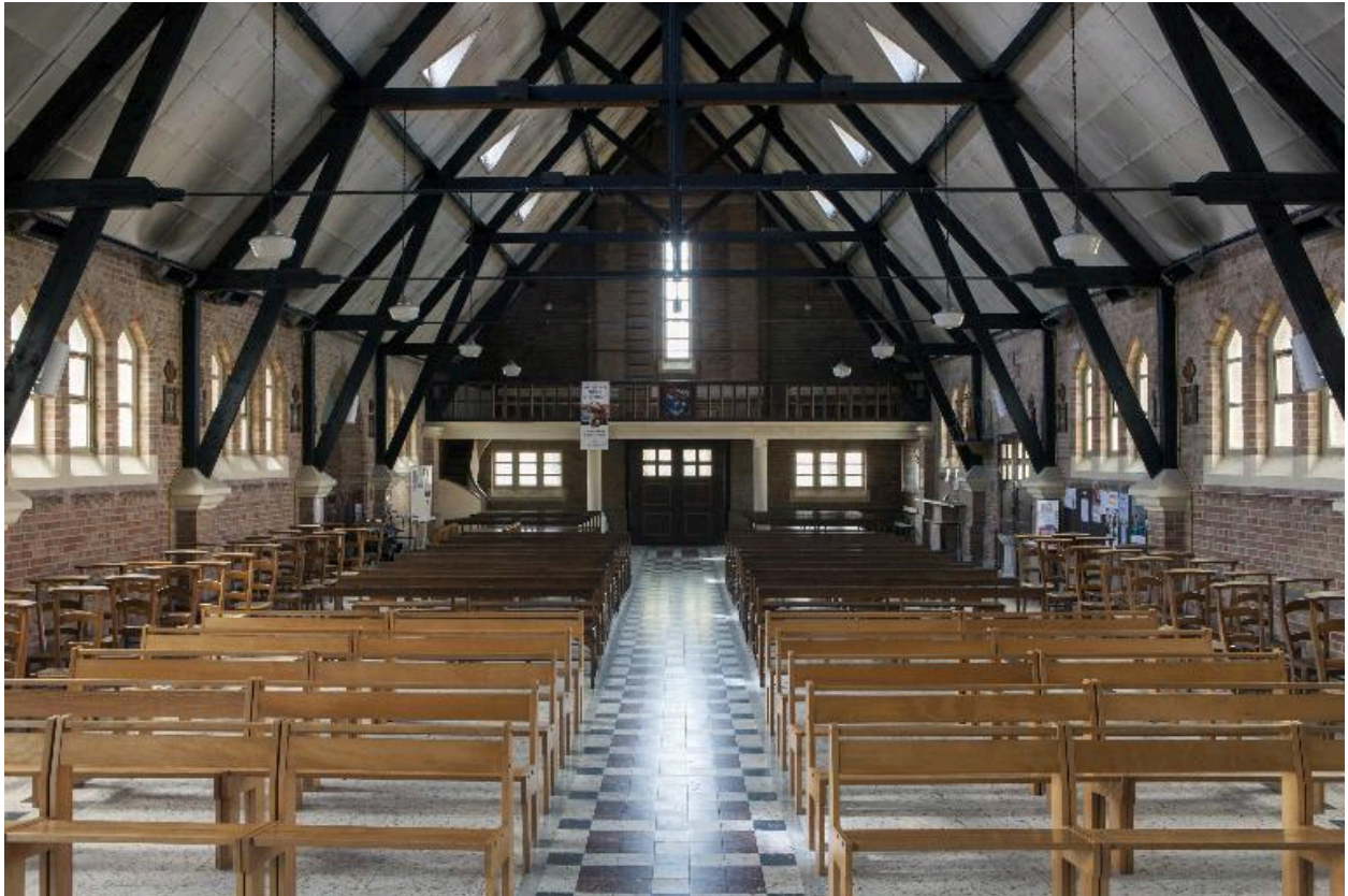
Vue générale depuis le chœur.