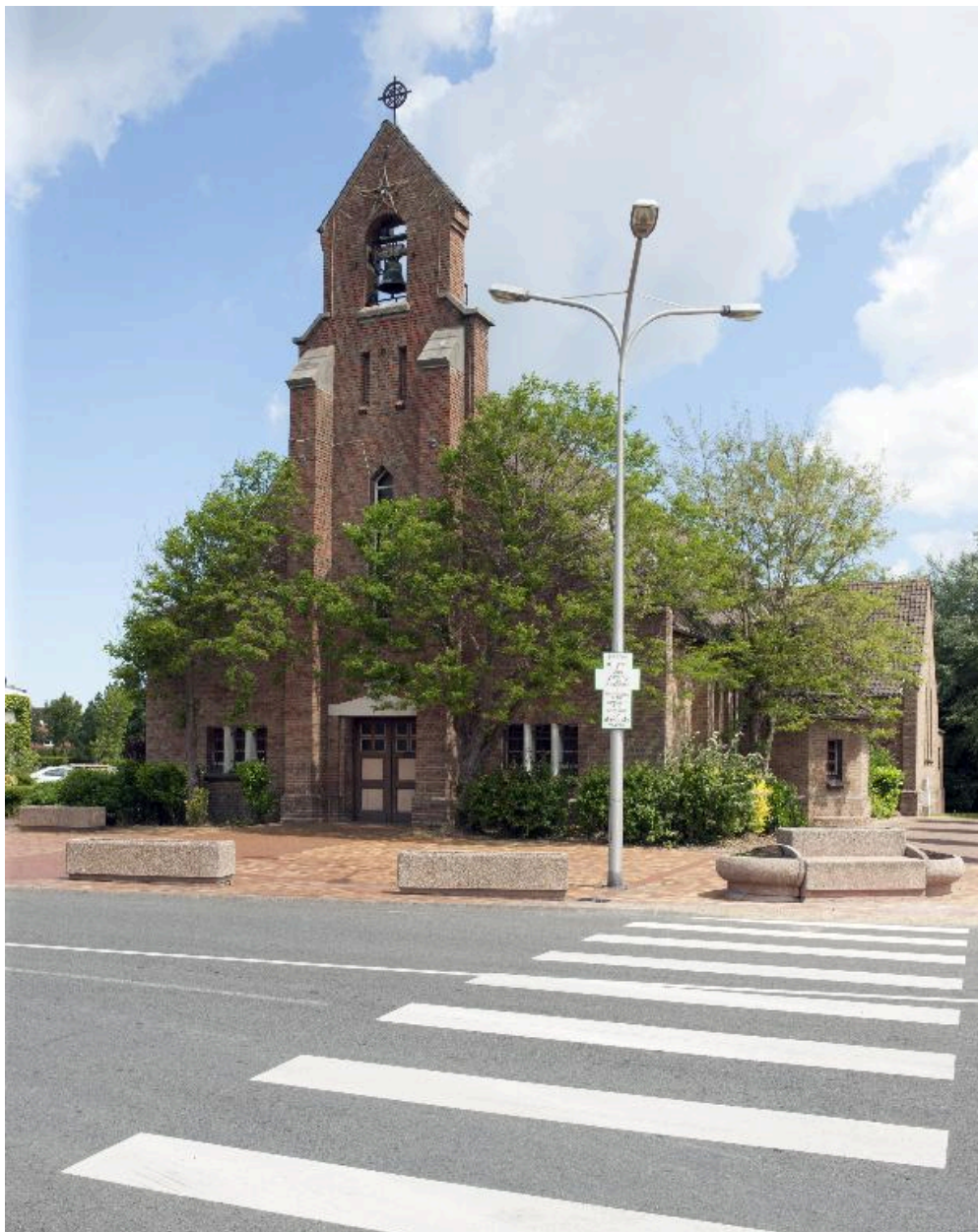
Vue de trois-quart de l'élévation antérieure et côté droit.