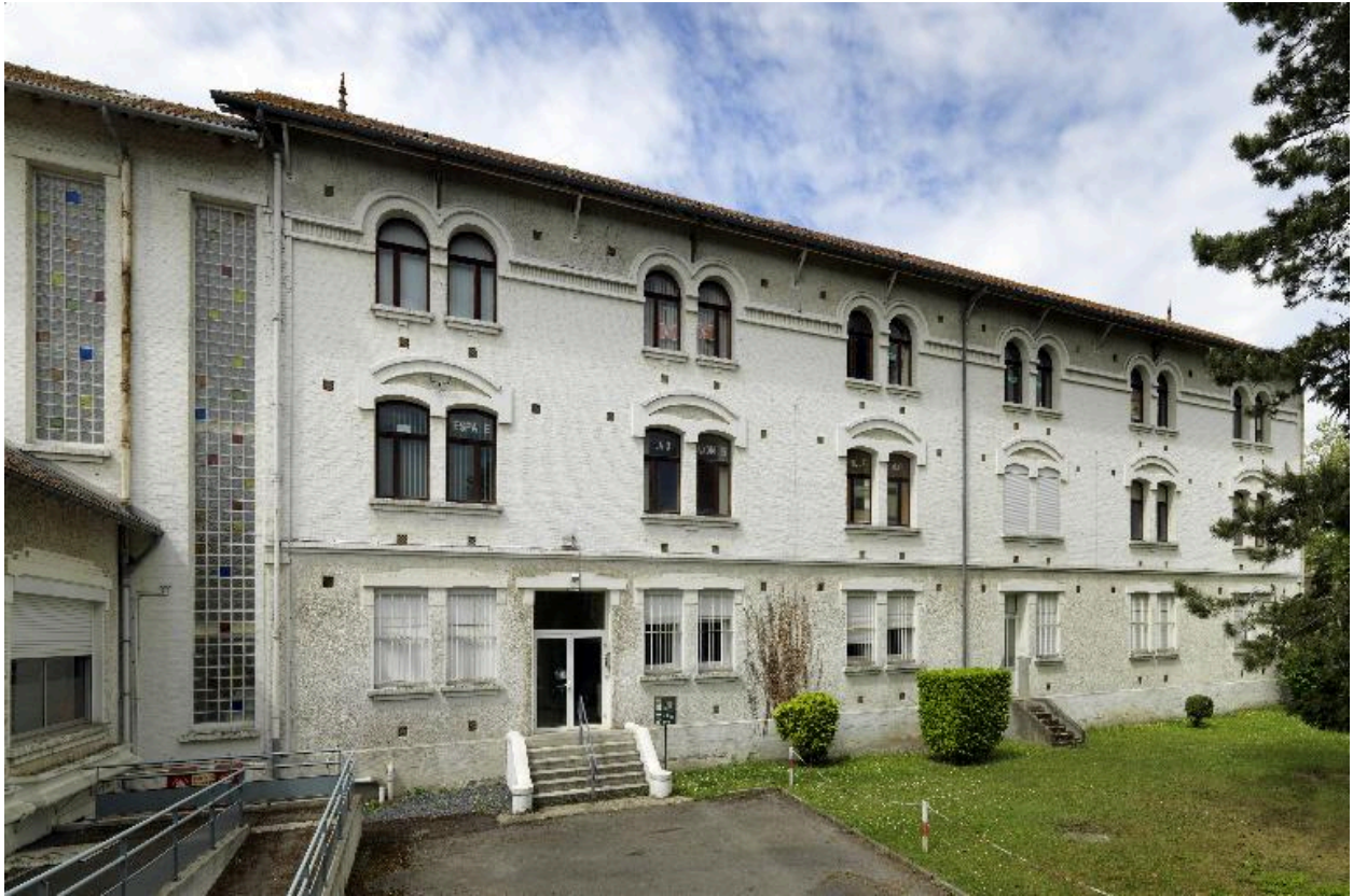
Le bâtiment des chambres et la cage d'escalier (à gauche sur l'image). Façade est sur la cour-jardin.