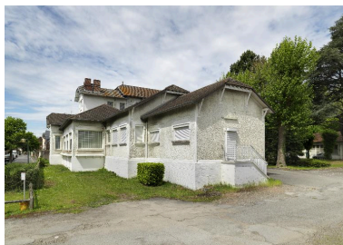
Le bâtiment abritant initialement les lavabos et les bains-douches (au premier plan), la cuisine et le réfectoire (à l'arrière-plan). Vue depuis le sud-est.