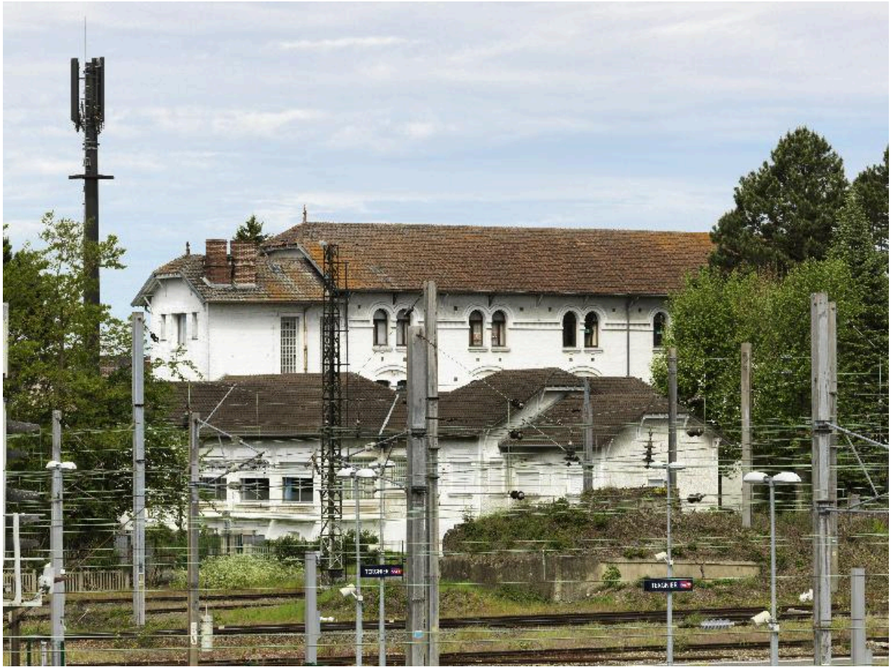
Vue de situation depuis la passerelle desservant les quais de la gare.