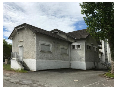
Le bâtiment abritant initialement les lavabos et les bains-douches (au premier plan), la lingerie (à l'arrière-plan). Vue depuis le nord-est.