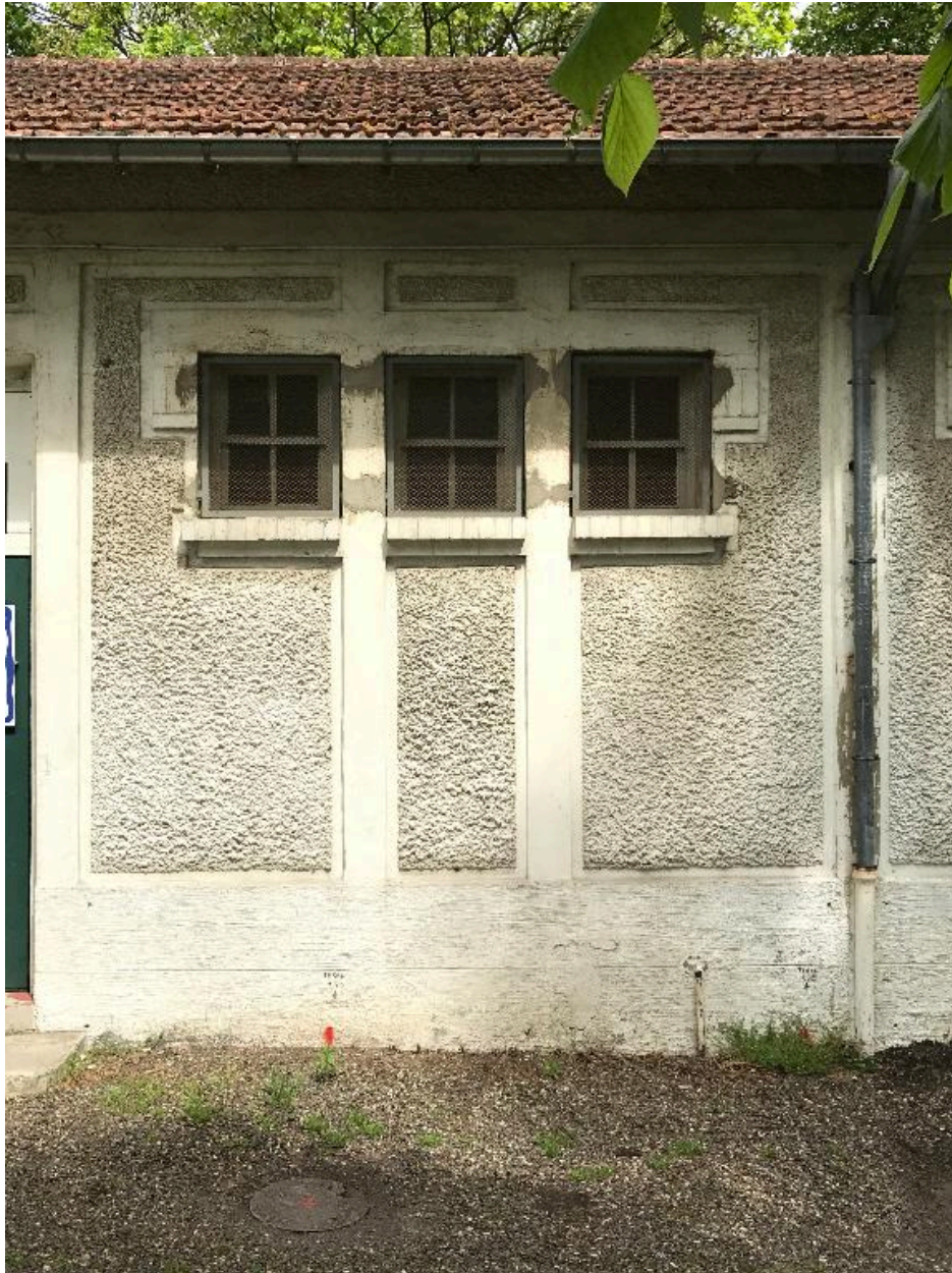
Détail d'une travée.