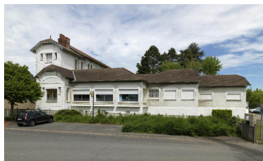
Le bâtiment abritant initialement, de gauche à droite, la salle de lecture, la cuisine et le réfectoire, les lavabos et les bains-douches. Vue de la façade sud sur la rue. IVR32_20170200182NUC2A