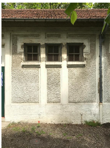
Détail d'une travée. IVR32_20170205090NUC2A