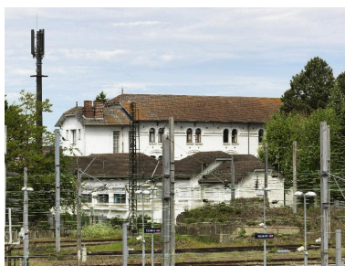
Vue de situation depuis la passerelle desservant les quais de la gare. IVR32_20170200180NUC2A