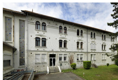
Le bâtiment des chambres et la cage d'escalier (à gauche sur l'image). Façade est sur la cour-jardin.