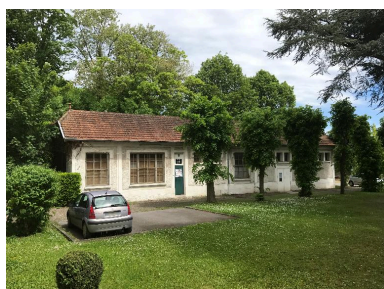
A légènder.