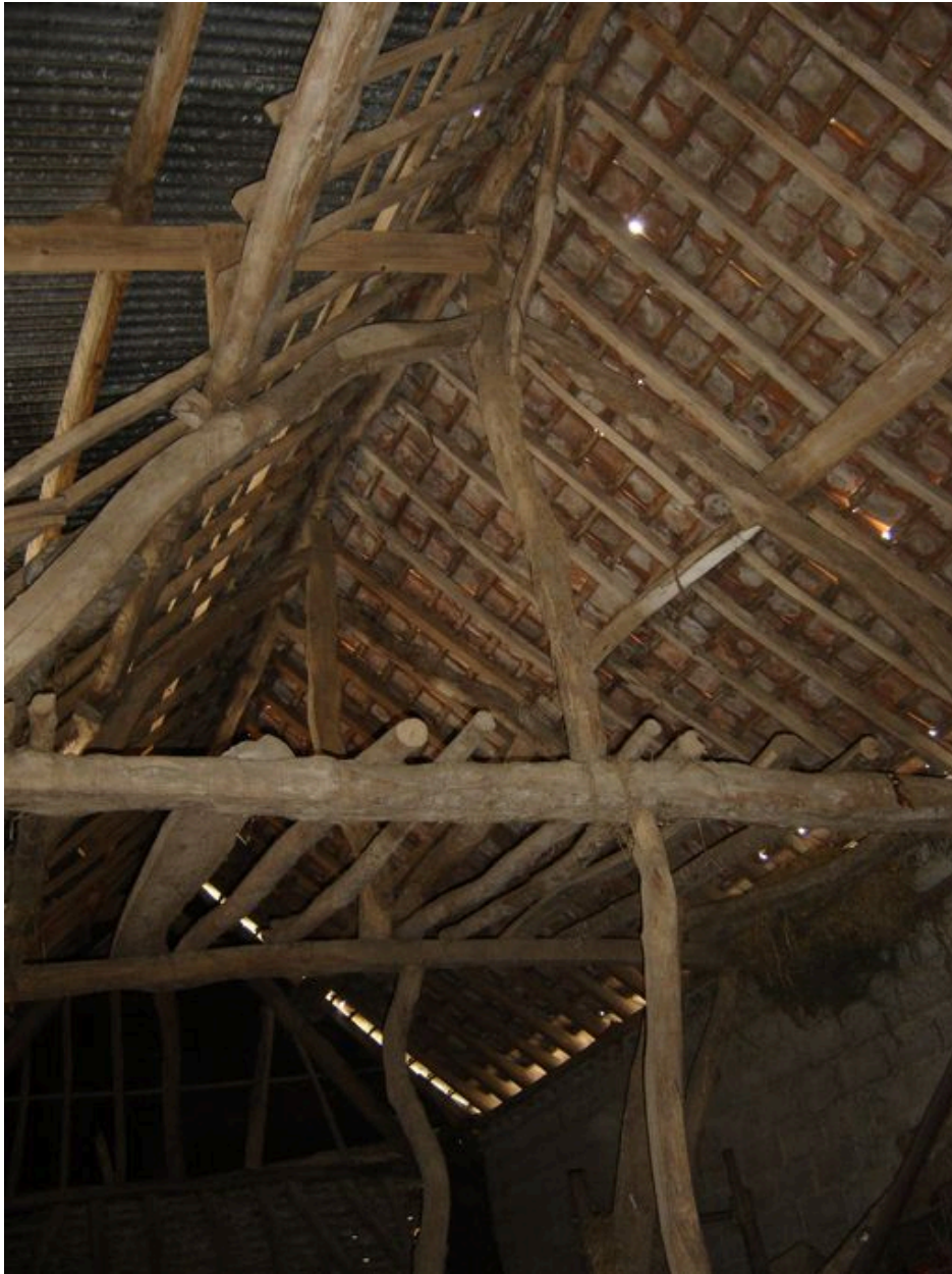
Vue de la charpente de la grange.