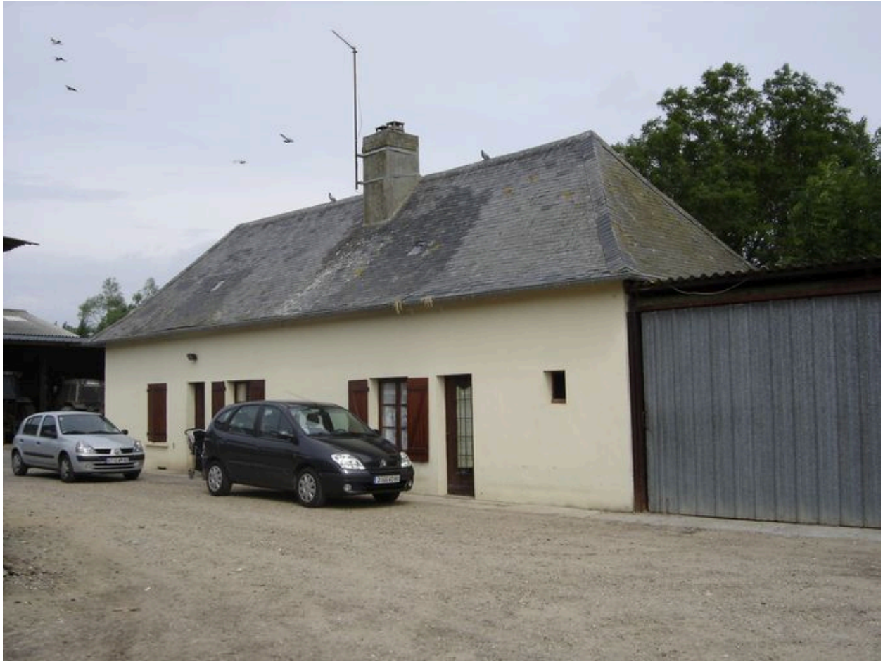
Vue du logis depuis la cour.