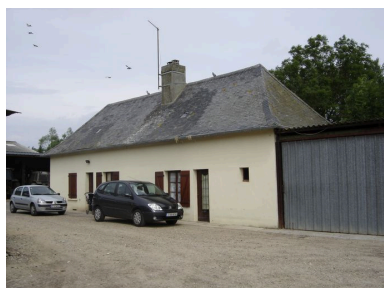
Vue du logis depuis la cour. IVR22_20058006067NUCA