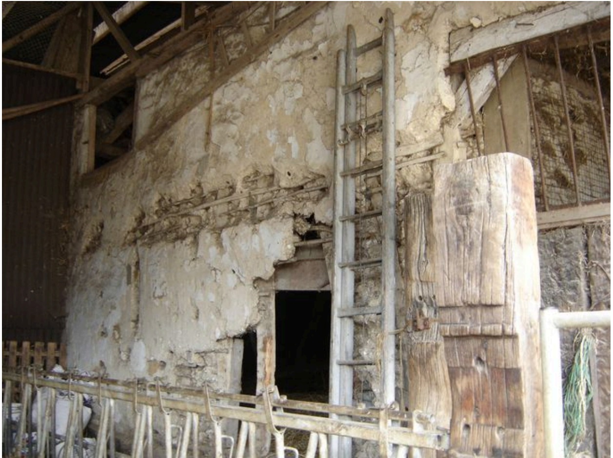
Vue du mur gouttereau sur cour.