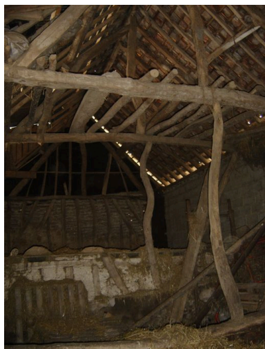
Vue intérieure.