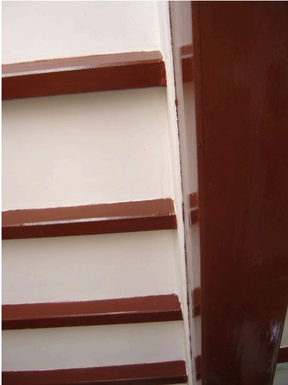
Vue des poutres et solives de la salle.