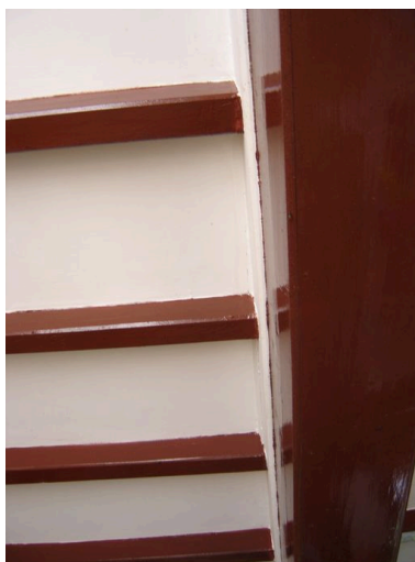
Vue des poutres et solives de la salle. IVR22_20058006069NUCA