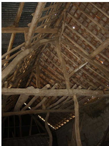
Vue de la charpente de la grange.