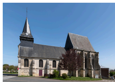
Vue générale depuis le sud. IVR32_20236000545NUCA