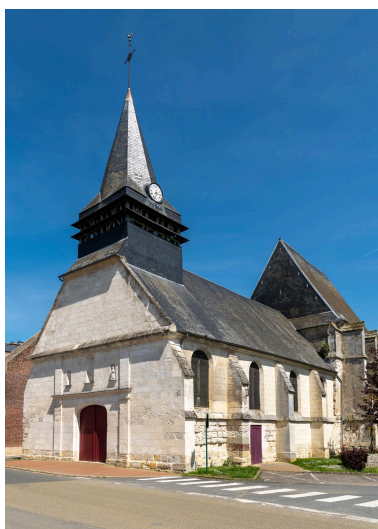
Vue générale depuis le sud-ouest. IVR32_20236000543NUCA