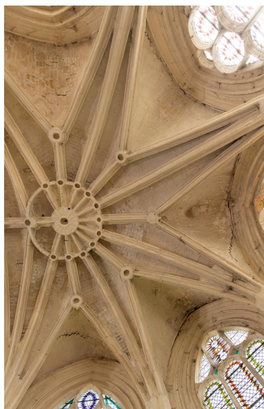
Voûtes du sanctuaire.