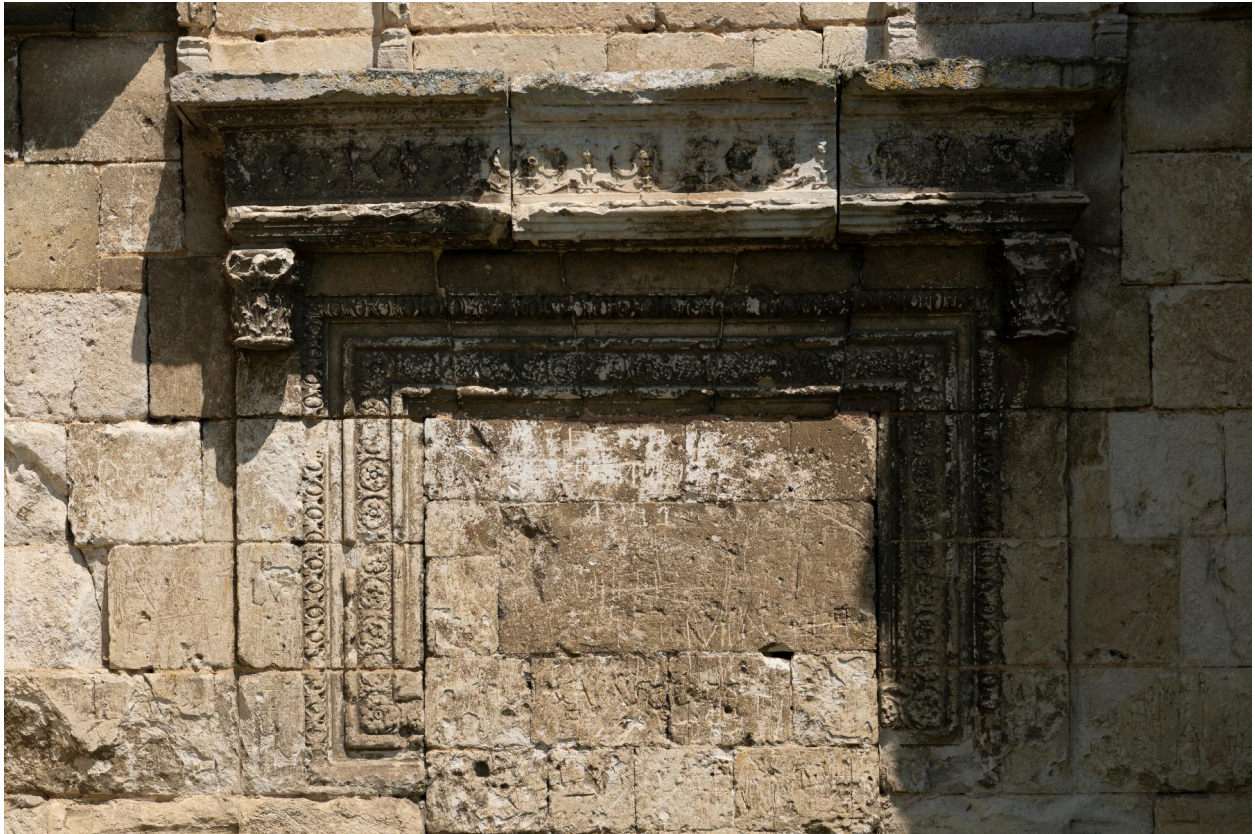
Détail du portail Renaissance, élévation sud.