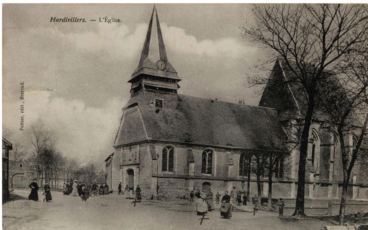
Hardivillers (Oise). Église, carte postale, éd. Peltier à Breteuil, [premier quart du XXe siècle] (coll. part.).