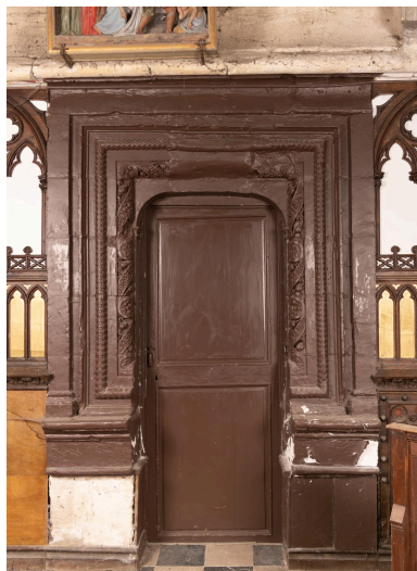
Entrée de la sacristie. IVR32_20236000446NUCA