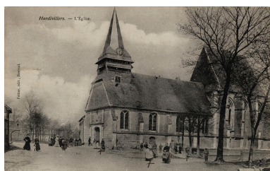
Hardivillers (Oise). Église, carte postale, éd. Peltier à Breteuil, [premier quart du XXe siècle]. IVR32_20226000116NUCA