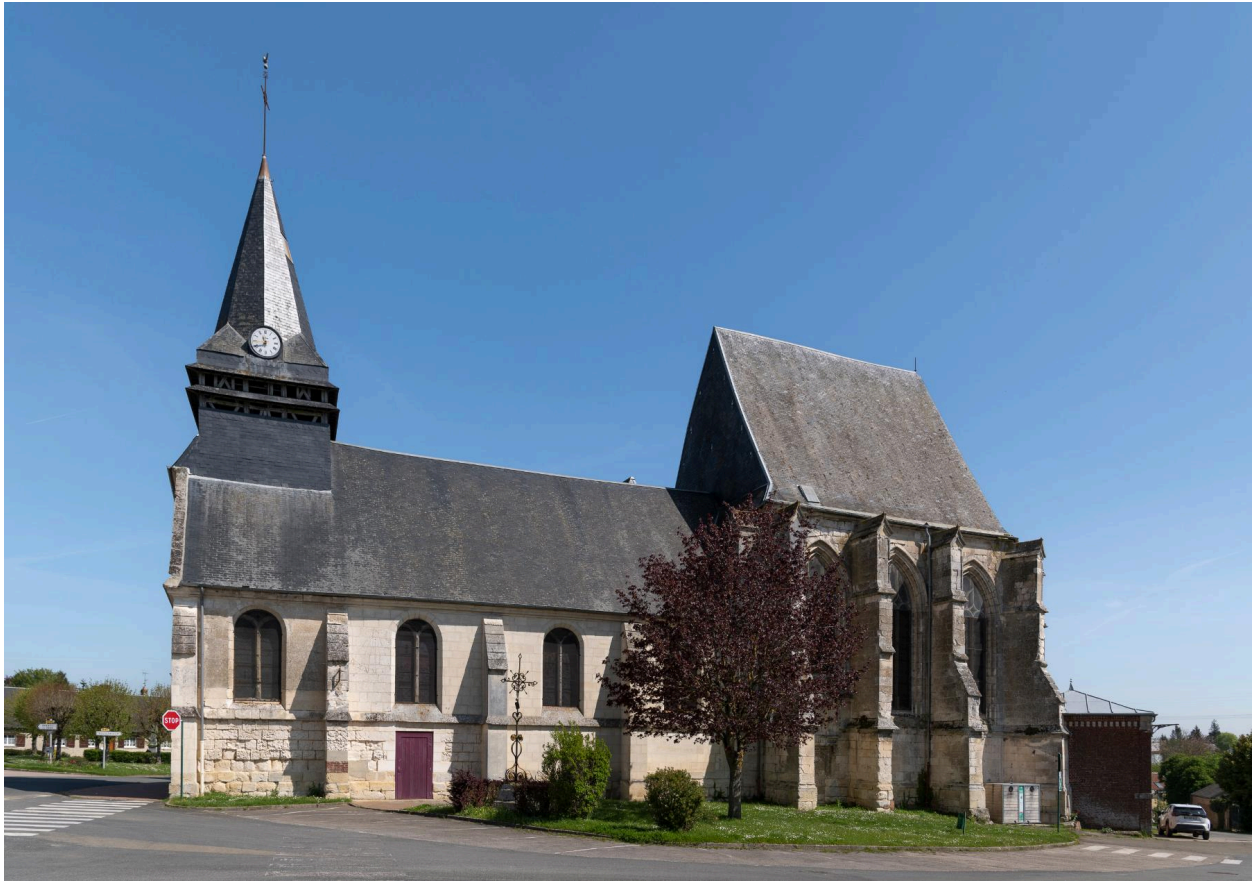
Vue générale depuis le sud.