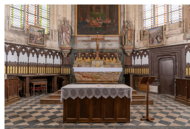
Vue générale du sanctuaire. IVR32_20236000432NUCA