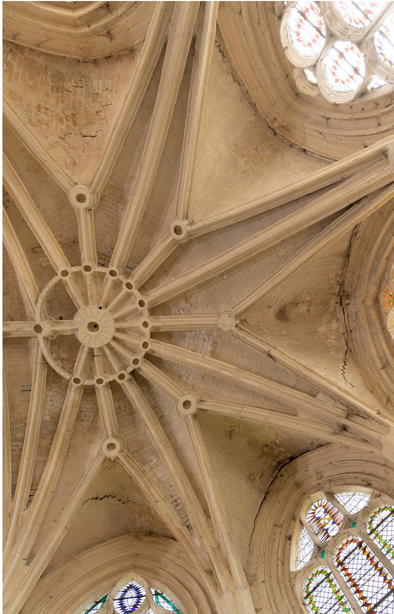
Voûtes du sanctuaire.