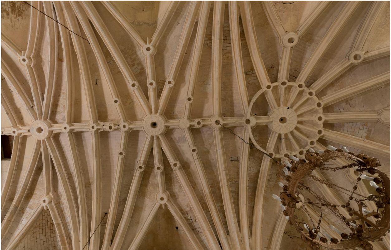
Voûtes du sanctuaire et des deux travées du chœur.