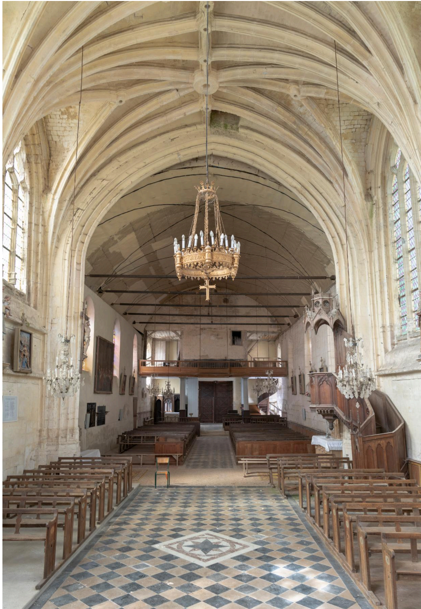
Vue intérieure vers la nef.