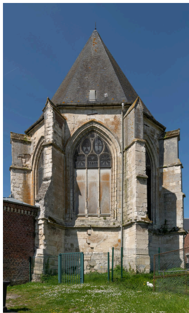
Chevet.