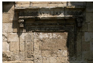
Détail du portail Renaissance, élévation sud. IVR32_20236000794NUCA