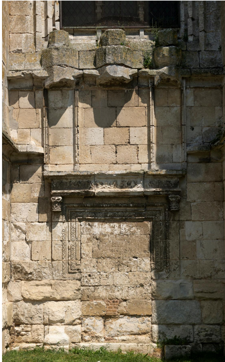
Portail Renaissance, élévation sud.