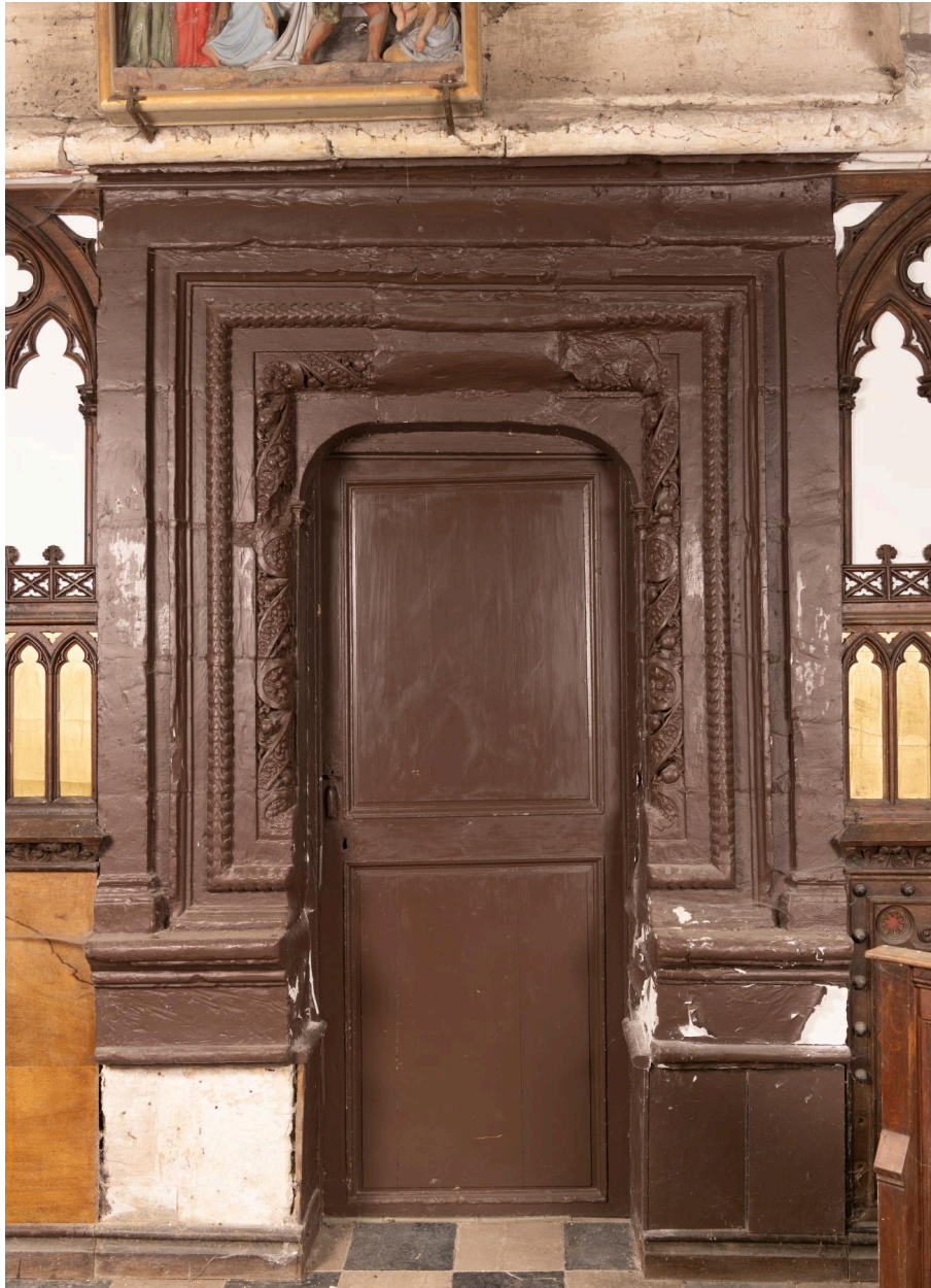
Entrée de la sacristie.