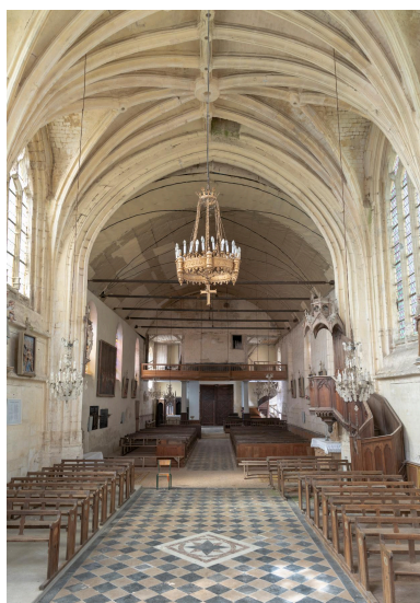
Vue intérieure vers la nef.