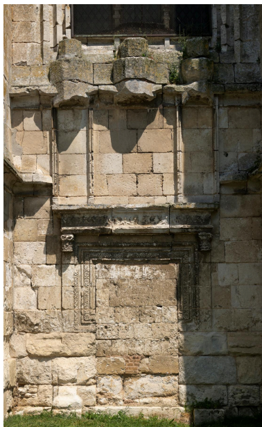
Portail Renaissance, élévation sud. IVR32_20236000795NUCA