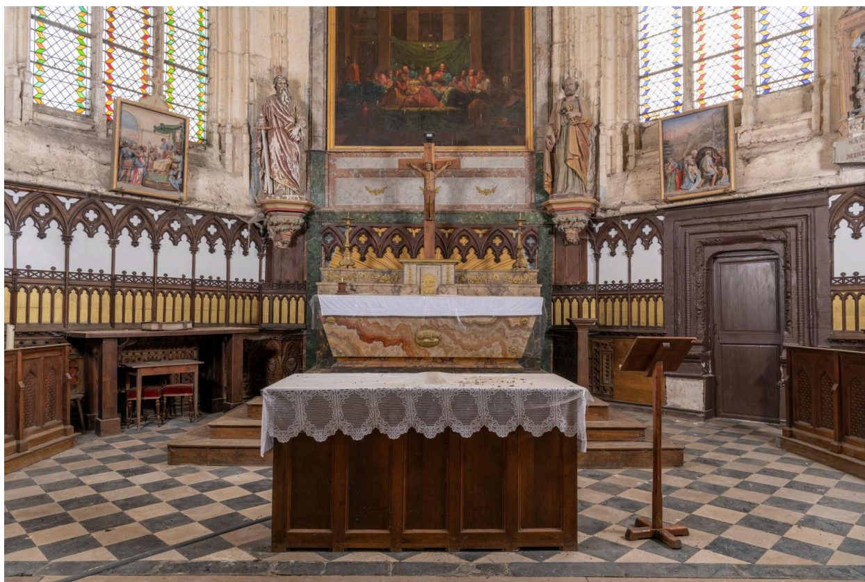
Vue générale du sanctuaire.