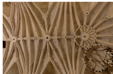
Voûtes du sanctuaire et des deux travées du chœur. IVR32_20236000455NUCA