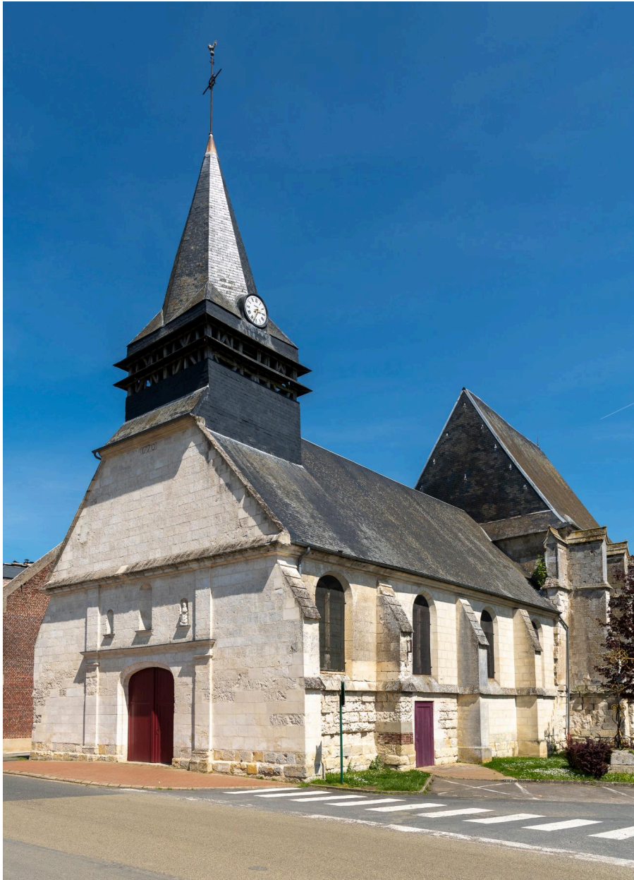
Vue générale depuis le sud-ouest.