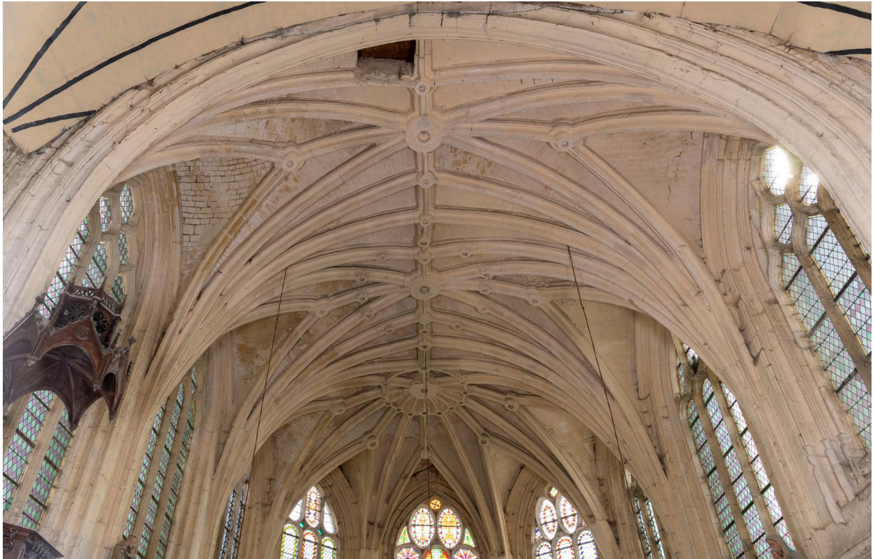
Voûtes à liernes et tiercerons du chœur.