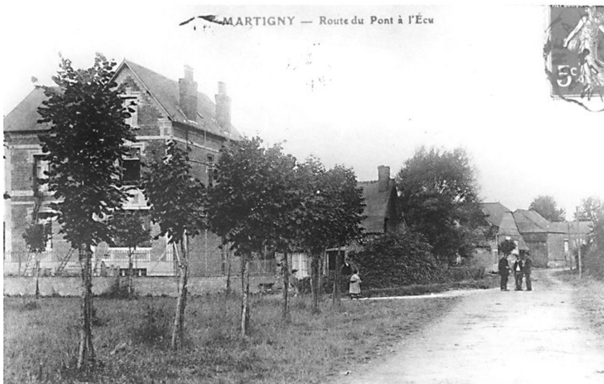
Vue ancienne de la première maison patronale située 6 place Maréchal-Foch (AP).