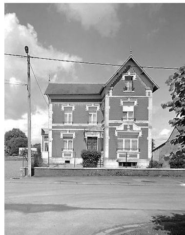
Premier logement patronal.