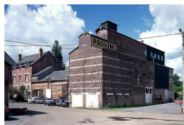
Vue générale. IVR22_19980201262XA