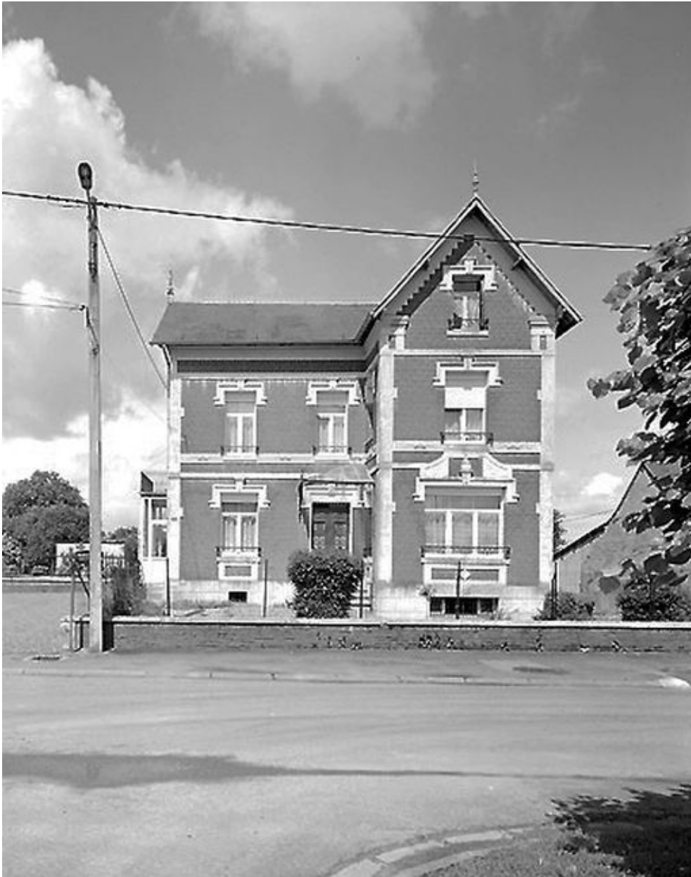
Premier logement patronal.