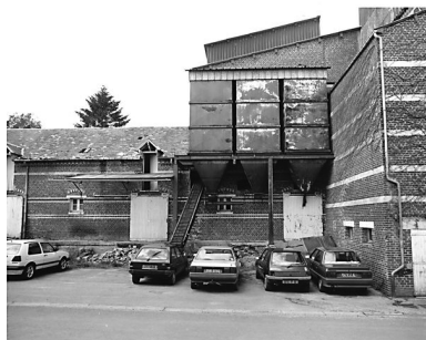
Partie ancienne de l'usine (sur la gauche) et bâtiments construits en 1962 avec les silos datant des années 1970.