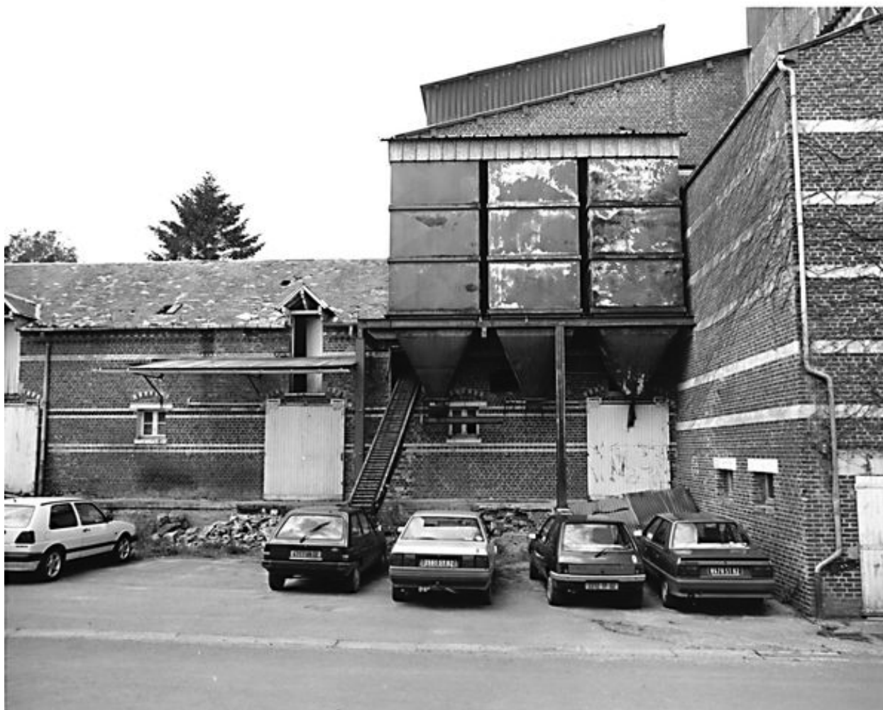
Partie ancienne de l'usine (sur la gauche) et bâtiments construits en 1962 avec les silos datant des années 1970.