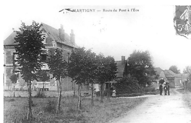
Vue ancienne de la première maison patronale située 6 place Maréchal-Foch (AP).