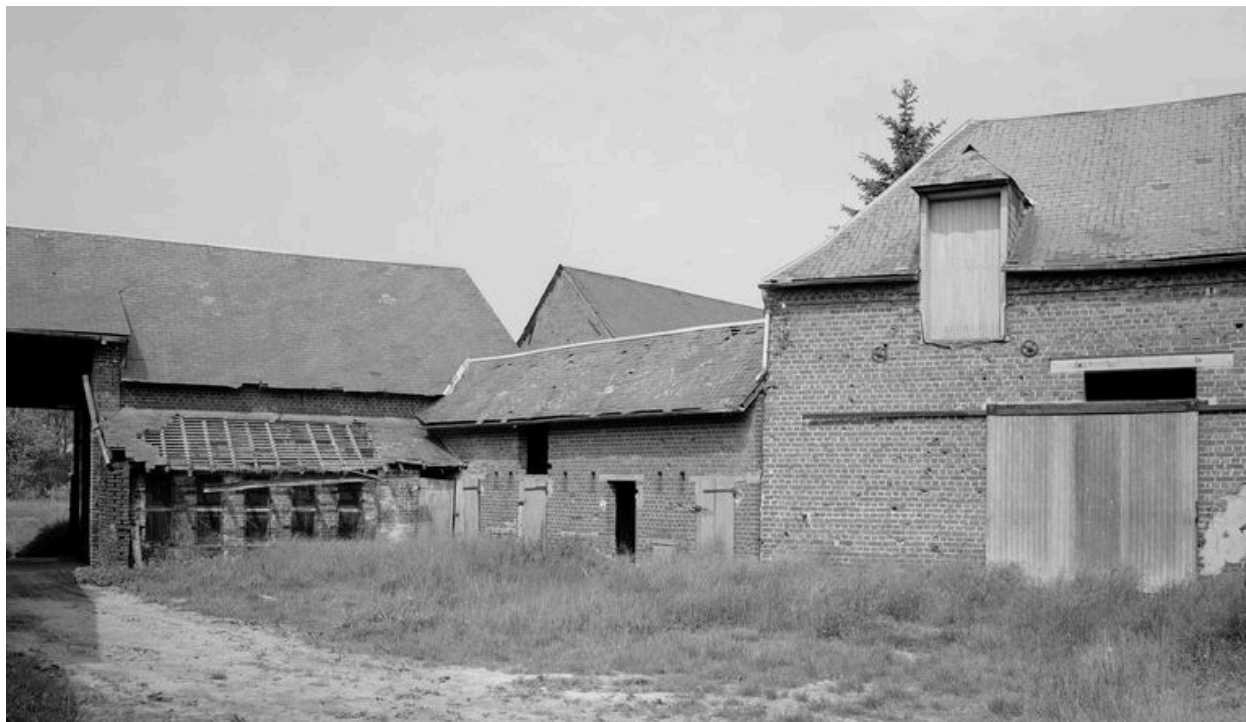
Grange et étable.