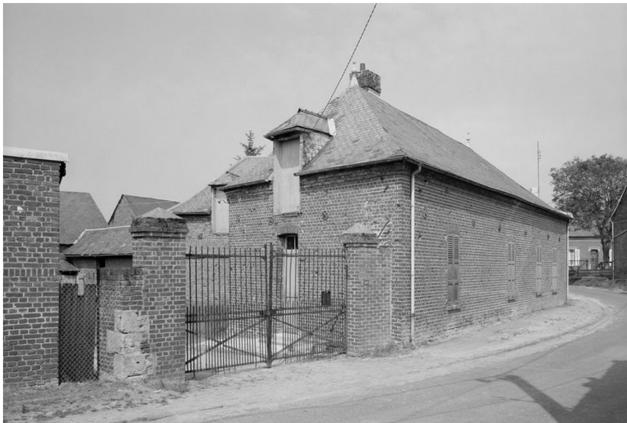
Logis. Elévation sur rue.