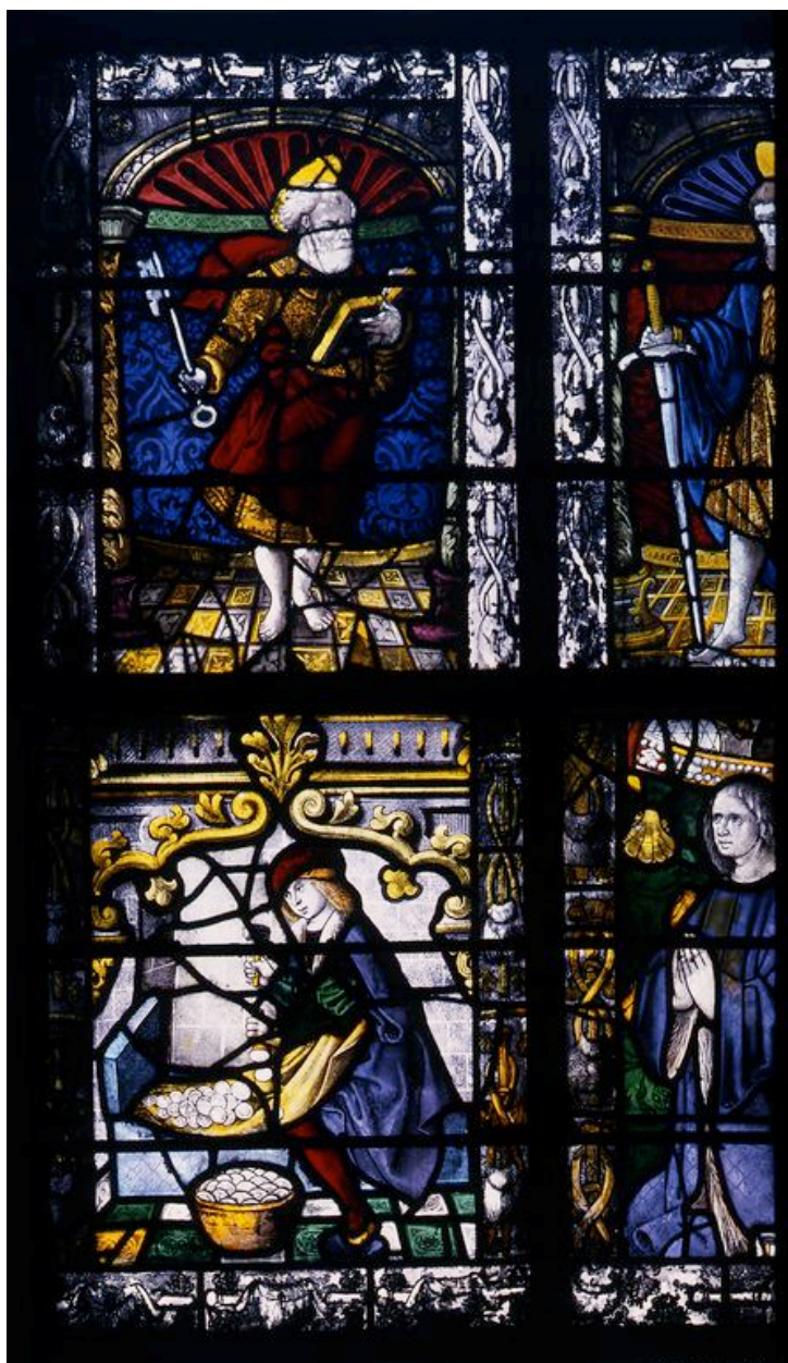
Vue des deux panneaux de gauche.