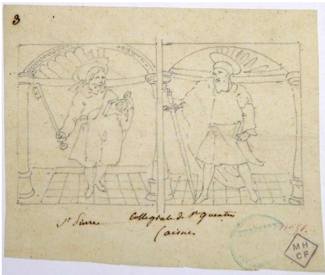
Dessin des panneaux représentant saint Pierre et saint Paul, vers le milieu du 19e siècle (Médiathèque du Patrimoine : 82/02/2050, n° 51).