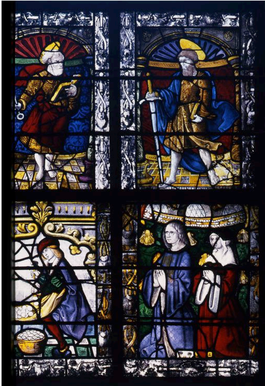
Vue des deux panneaux de droite.