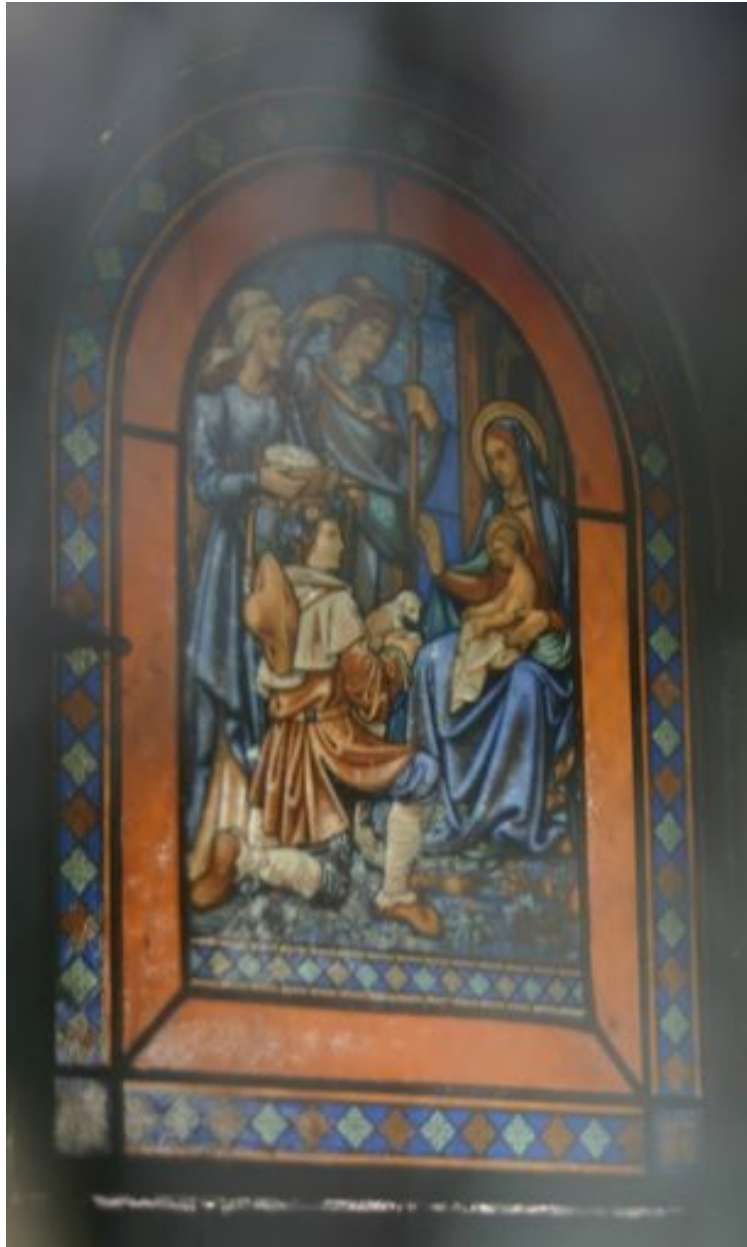
Détail du vitrail droit, représentant l'Adoration des bergers.