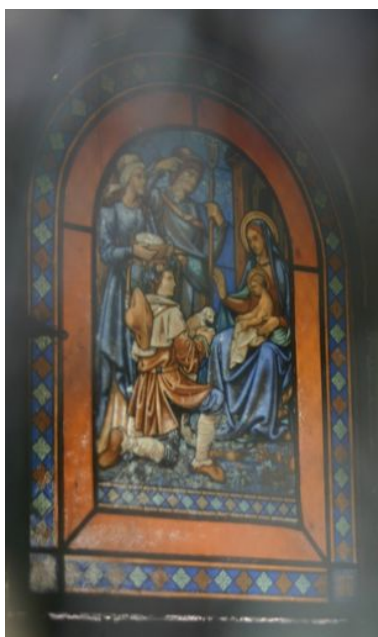
Détail du vitrail droit, représentant l'Adoration des bergers. IVR22_20098001065NUCA

IVR22_20098001064NUCA