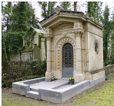
Vue générale. IVR22_20098001062NUCA

(reproduction) IVR22_20098001582NUCA