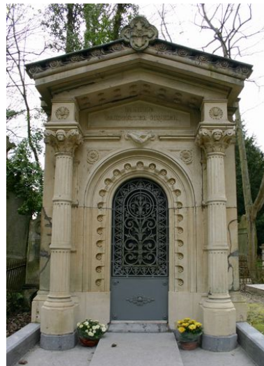
Tombeau en forme de chapelle, de face. IVR22_20098001063NUCA