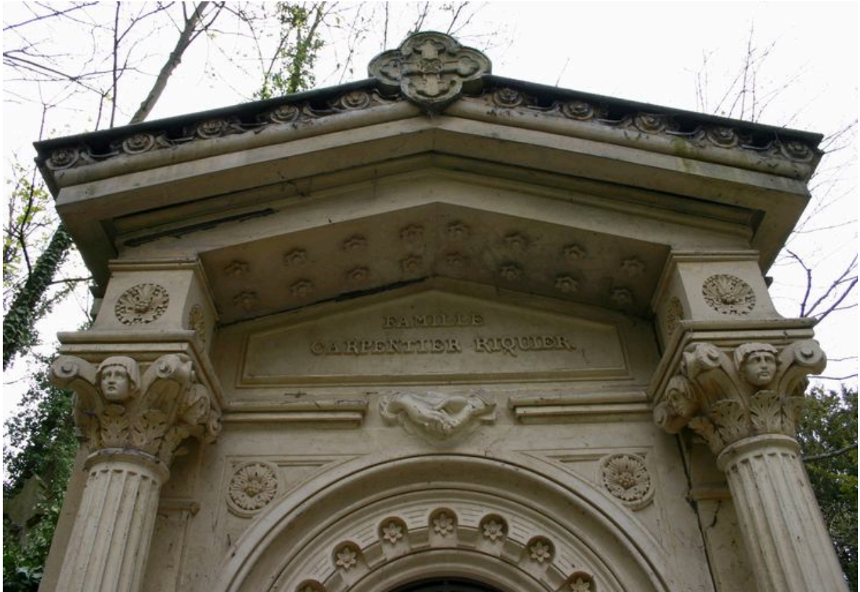
Détail des décors sculptés du fronton du tombeau en forme de chapelle.