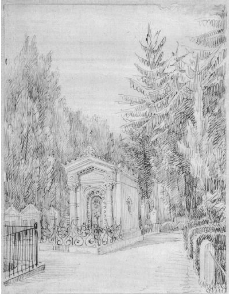
Dessin des Duthoit : chapelle funéraire au cimetière de la Madeleine, vers 1850 (Amiens, Musée de Picardie, MP Duthoit).