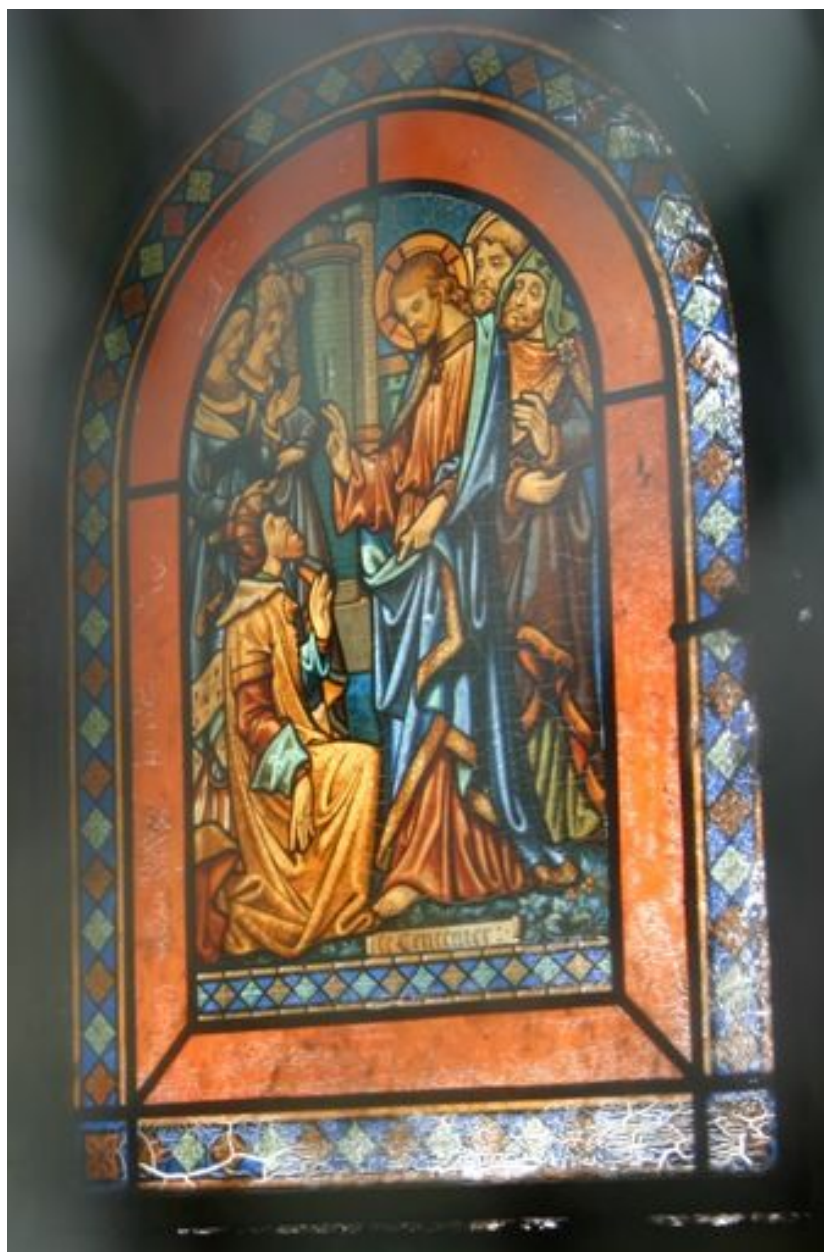
Détail du vitrail droit, représentant le Christ bénissant un riche personnage.