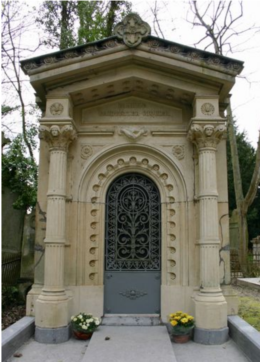
Tombeau en forme de chapelle, de face.