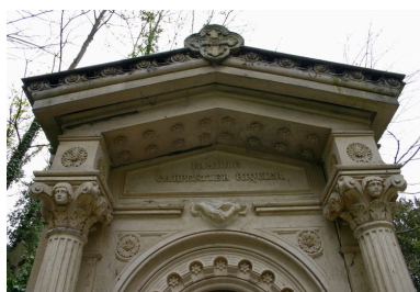
Détail des décors sculptés du fronton du tombeau en forme de chapelle.

Phot. Caroline Vincent IVR22_20098001064NUCA