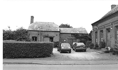
Vue du logis sur la droite et au fond de la cour, atelier de tonnelier (à gauche), étable à vaches (à droite).