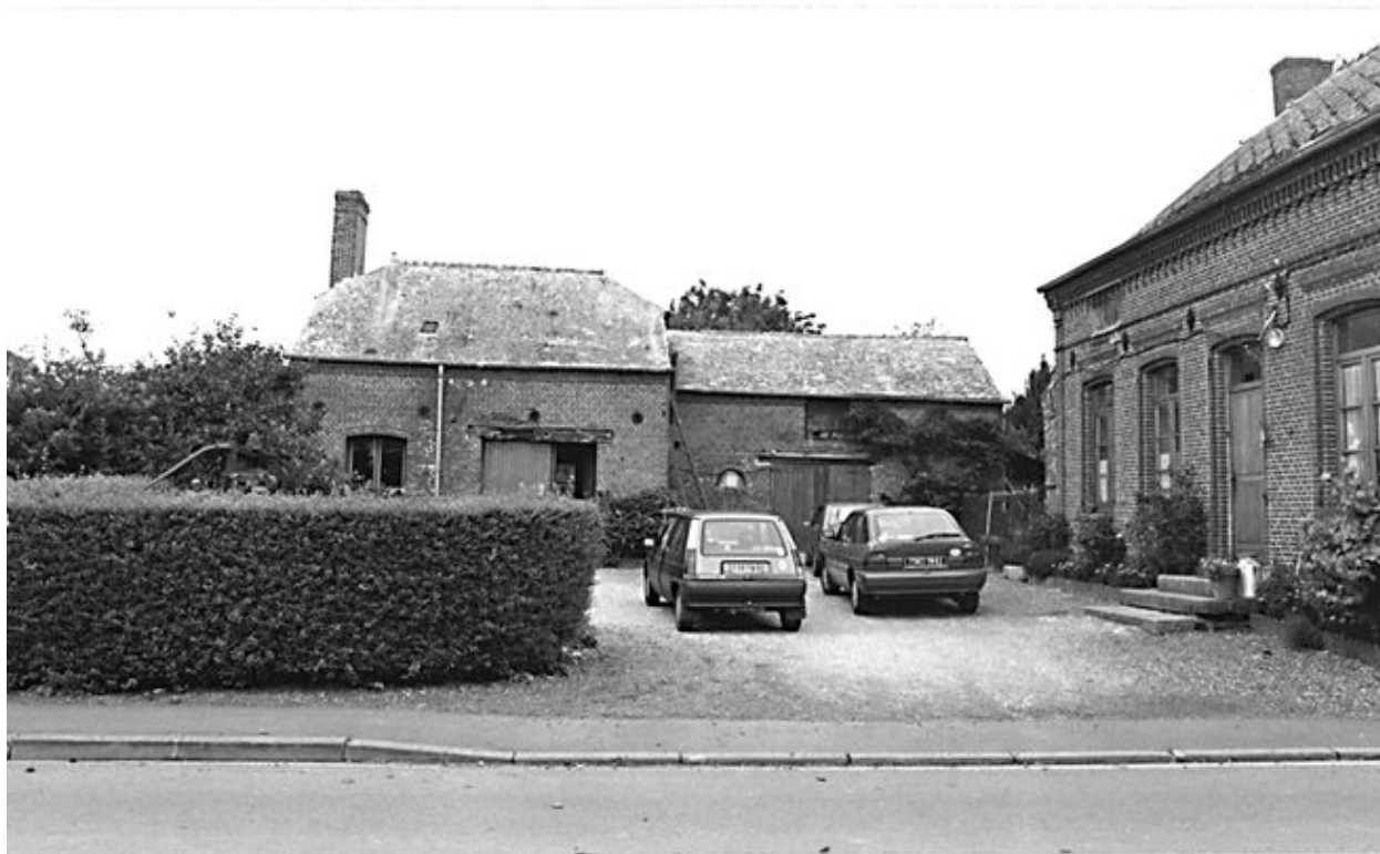
Vue du logis sur la droite et au fond de la cour, atelier de tonnelier (à gauche), étable à vaches (à droite).