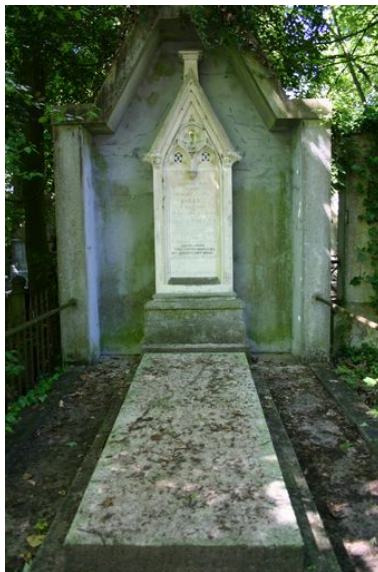
Stèle néogothique.