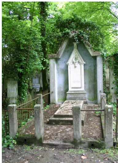
Vue générale. IVR22_20098001245NUCA