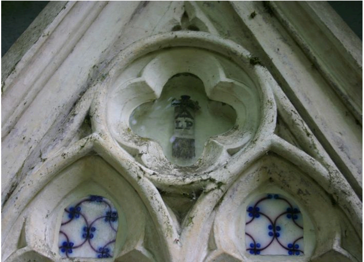
Vue de détail sur l'insigne de confrérie.