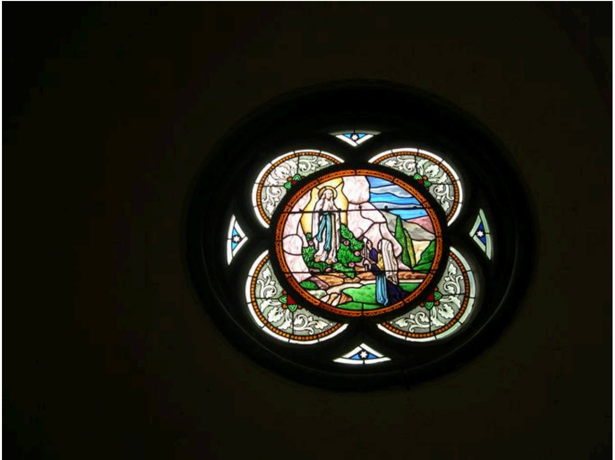
Verrière du chevet (mur sud) : l'Apparition de la Vierge de Lourdes.