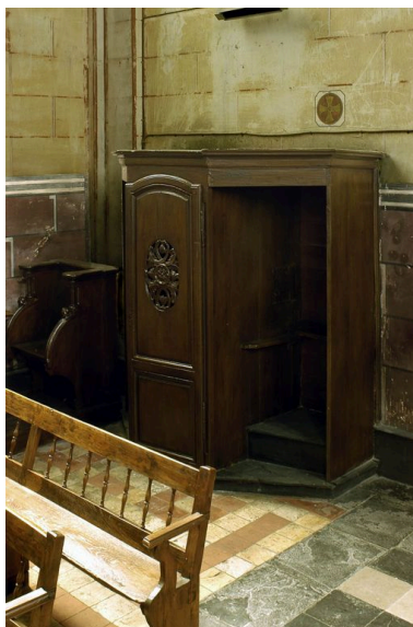
Le confessionnal. IVR22_20068000217NUCA