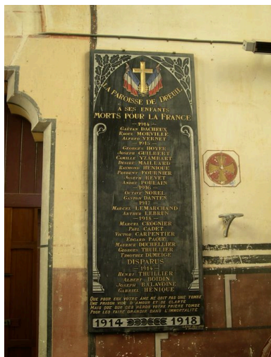
Le monument aux morts (Lesot-Helleux).