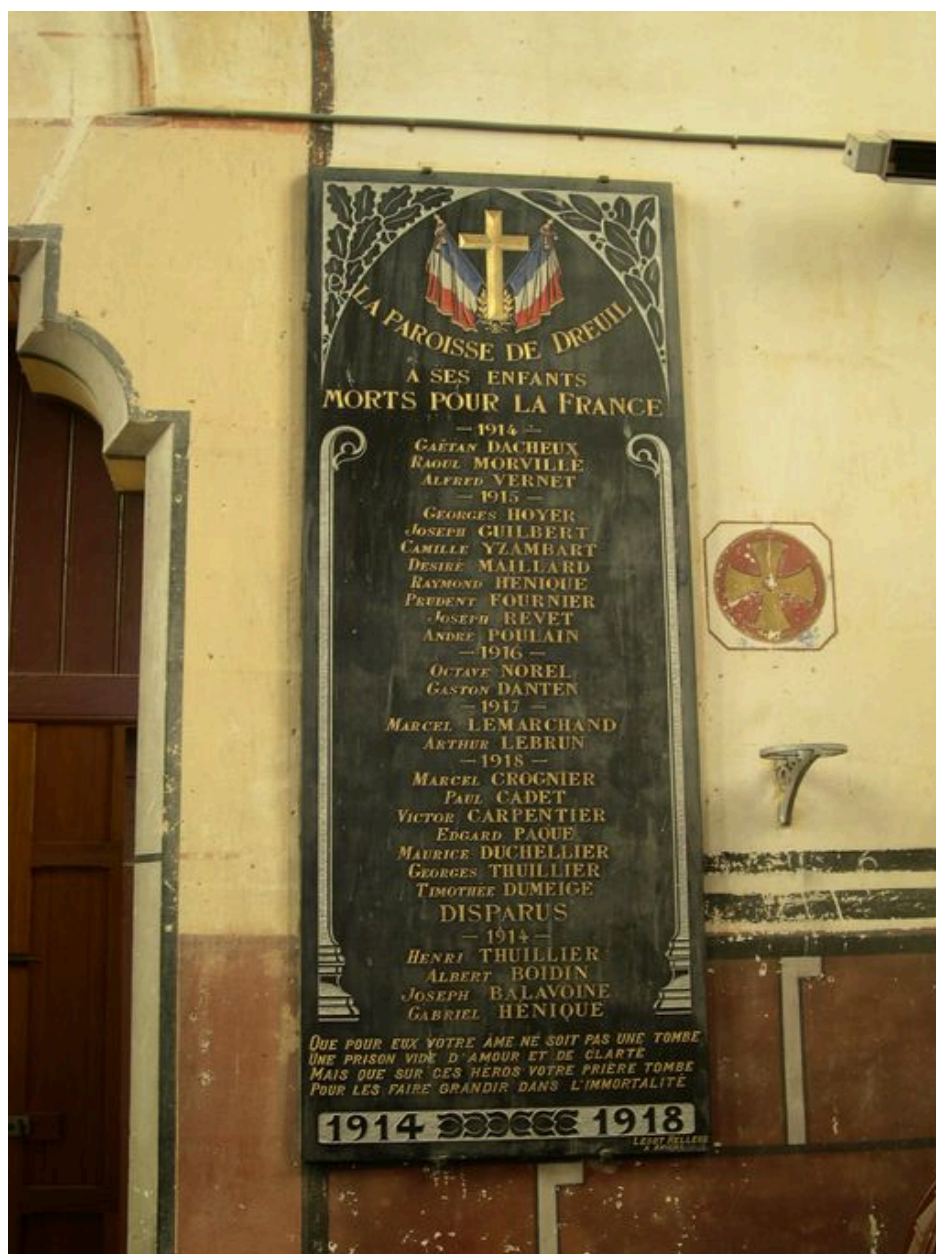
Le monument aux morts (Lesot-Helleux).