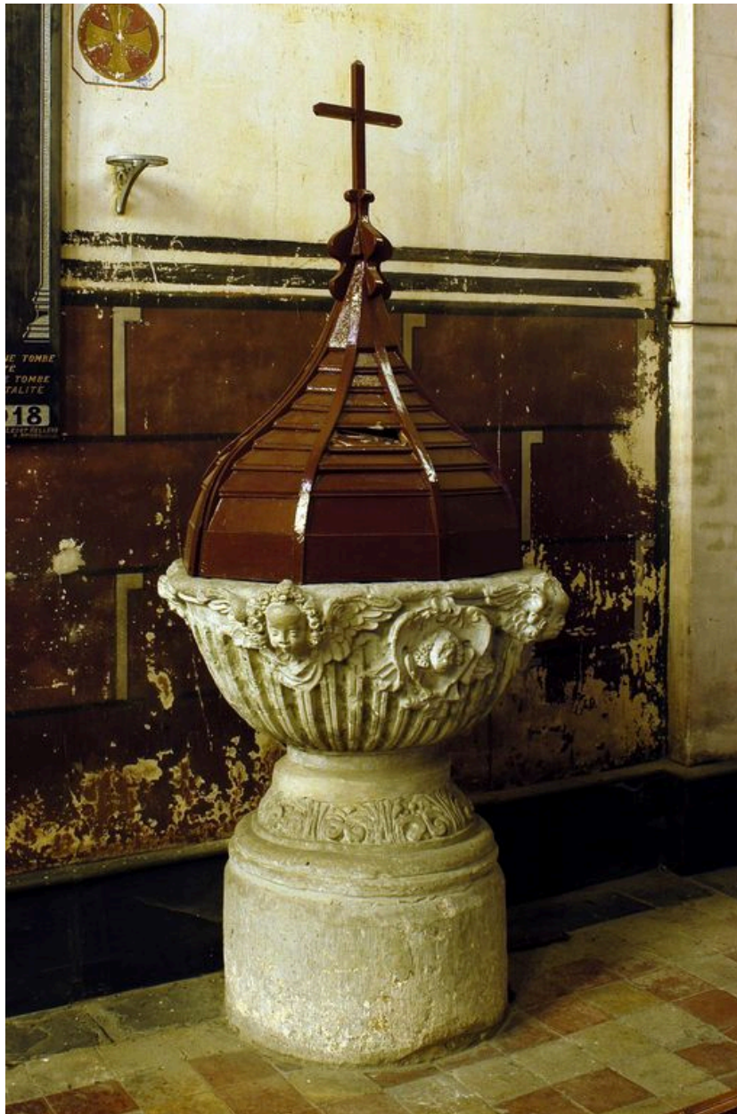
Les fonts baptismaux.