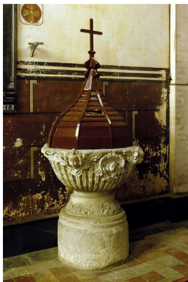
Les fonts baptismaux. IVR22_20068000218NUCA