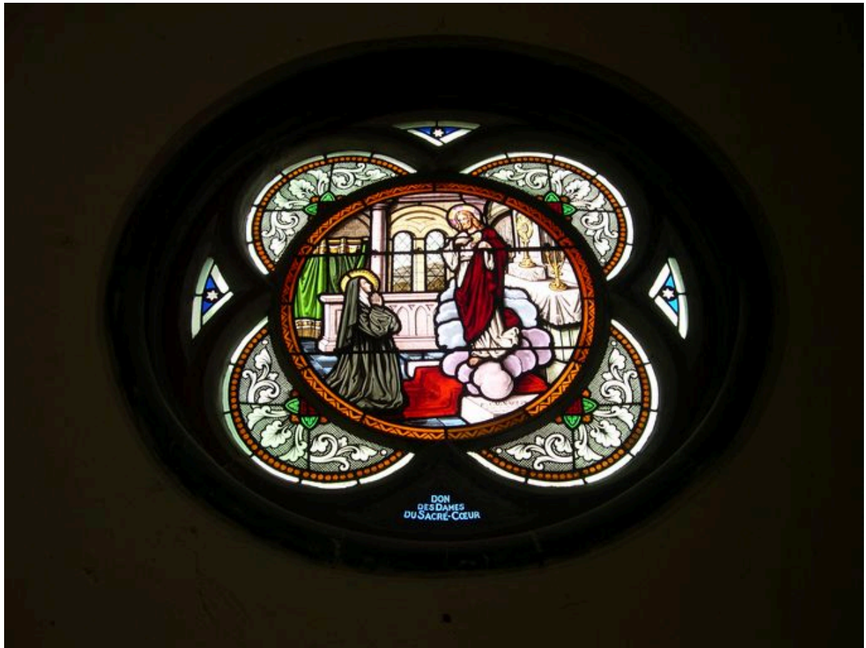
Verrière du chevet (mur nord) : l'Apparition du Sacré-Coeur, R. Cagnart (peintre verrier).