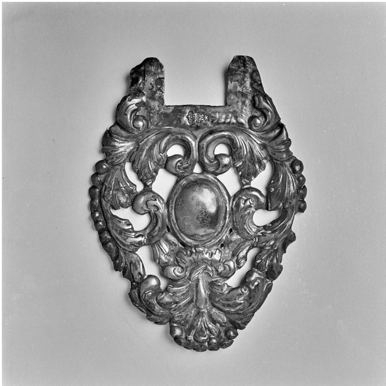
Croix d'autel : élément décoratif en argent destiné à être fixé à chacune des extrémités des bras de la croix.