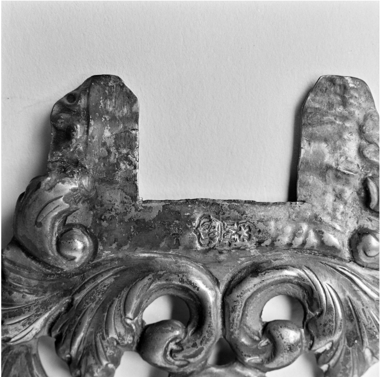
Croix d'autel : élément décoratif en argent destiné à être fixé à chacune des extrémités des bras de la croix, détail du poinçon.