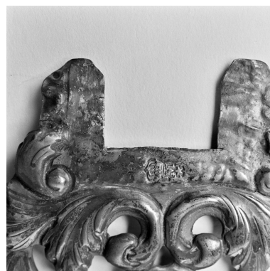
Croix d'autel : élément décoratif en argent destiné à être fixé à chacune des extrémités des bras de la croix, détail du poinçon. IVR31_19965901182X