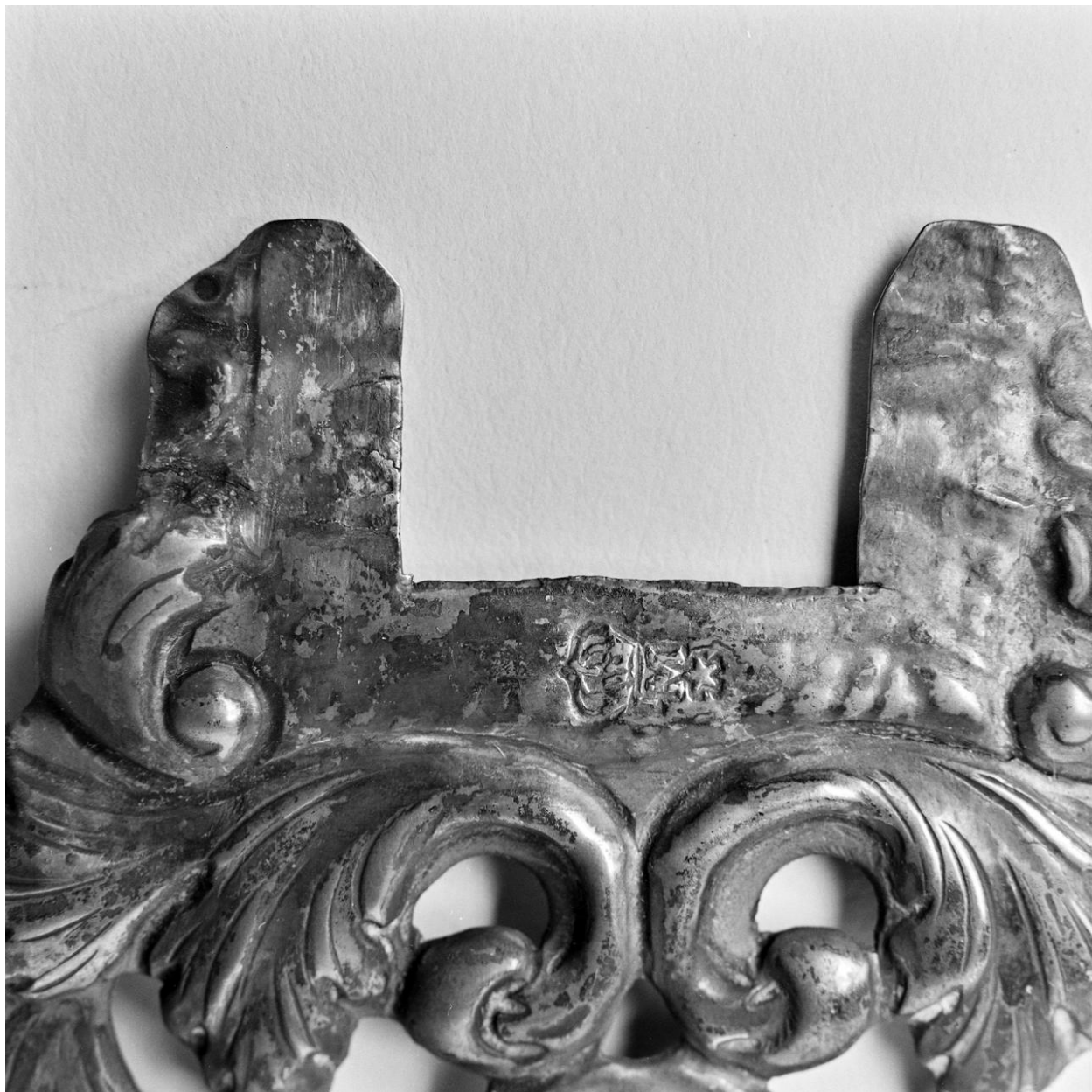
Croix d'autel : élément décoratif en argent destiné à être fixé à chacune des extrémités des bras de la croix, détail du poinçon.