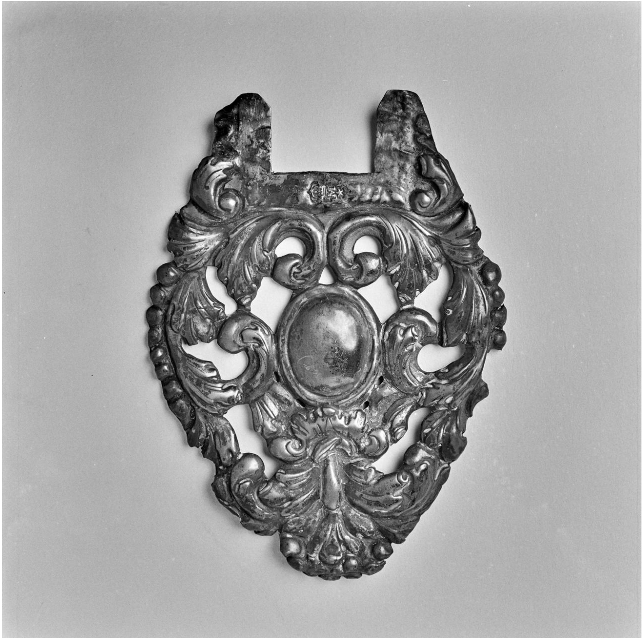
Croix d'autel : élément décoratif en argent destiné à être fixé à chacune des extrémités des bras de la croix.