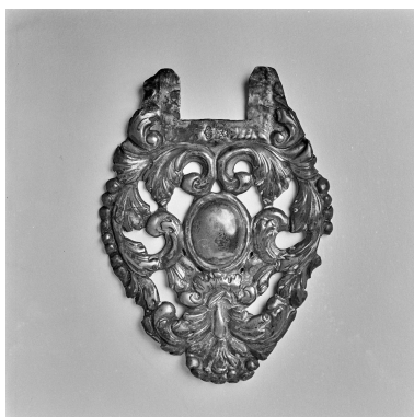
Croix d'autel : élément décoratif en argent destiné à être fixé à chacune des extrémités des bras de la croix. IVR31_19965901183X