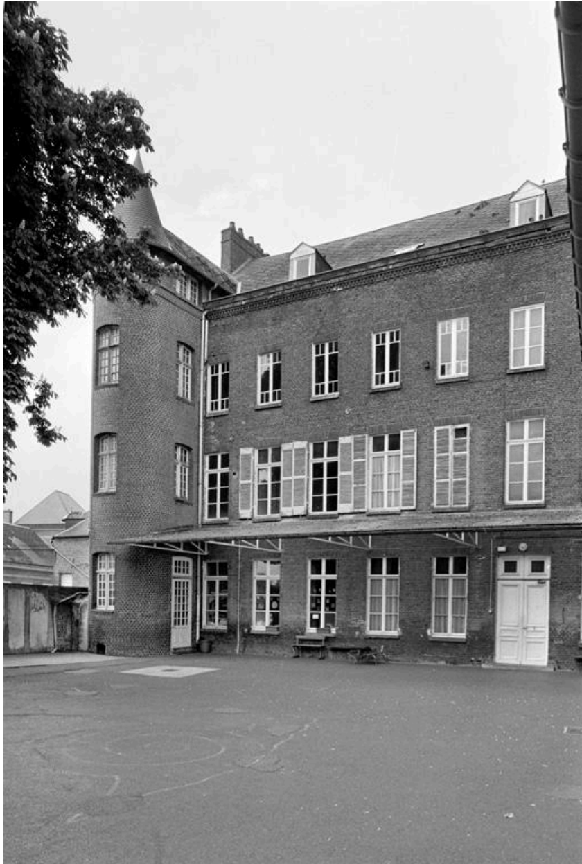
Vue de la façade sur la cour.