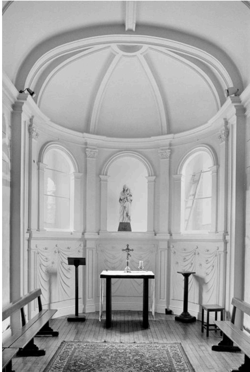
Vue intérieure de la chapelle (des soeurs ?), édifée en 1919.