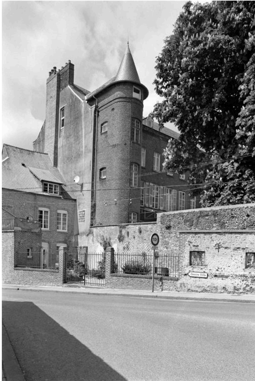
Vue de l'escalier hors-oeuvre, élevé sur la façade postérieure.