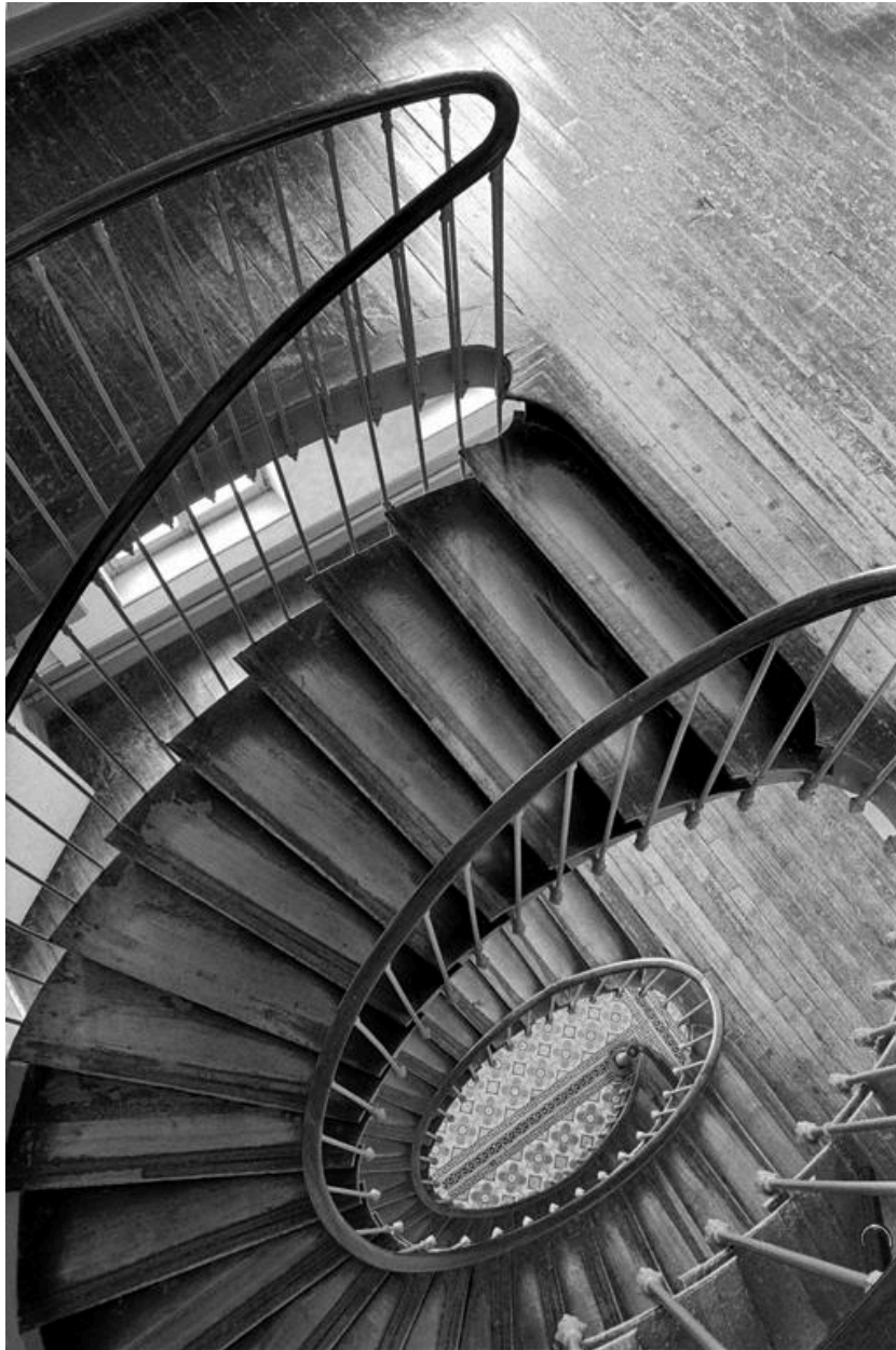
Vue intérieure en plongée de l'escalier suspendu du bâtiment principal.