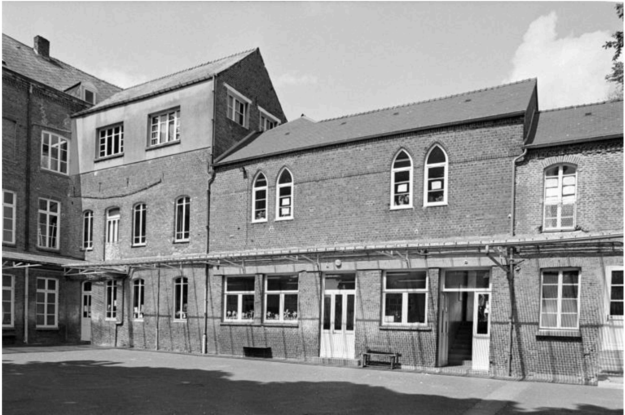
Vue de l'ancien préau surmonté de la chapelle (élevé dans la 2e moitié du 19e siècle).