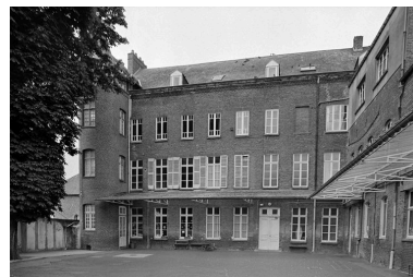
Vue de la façade sur cour.