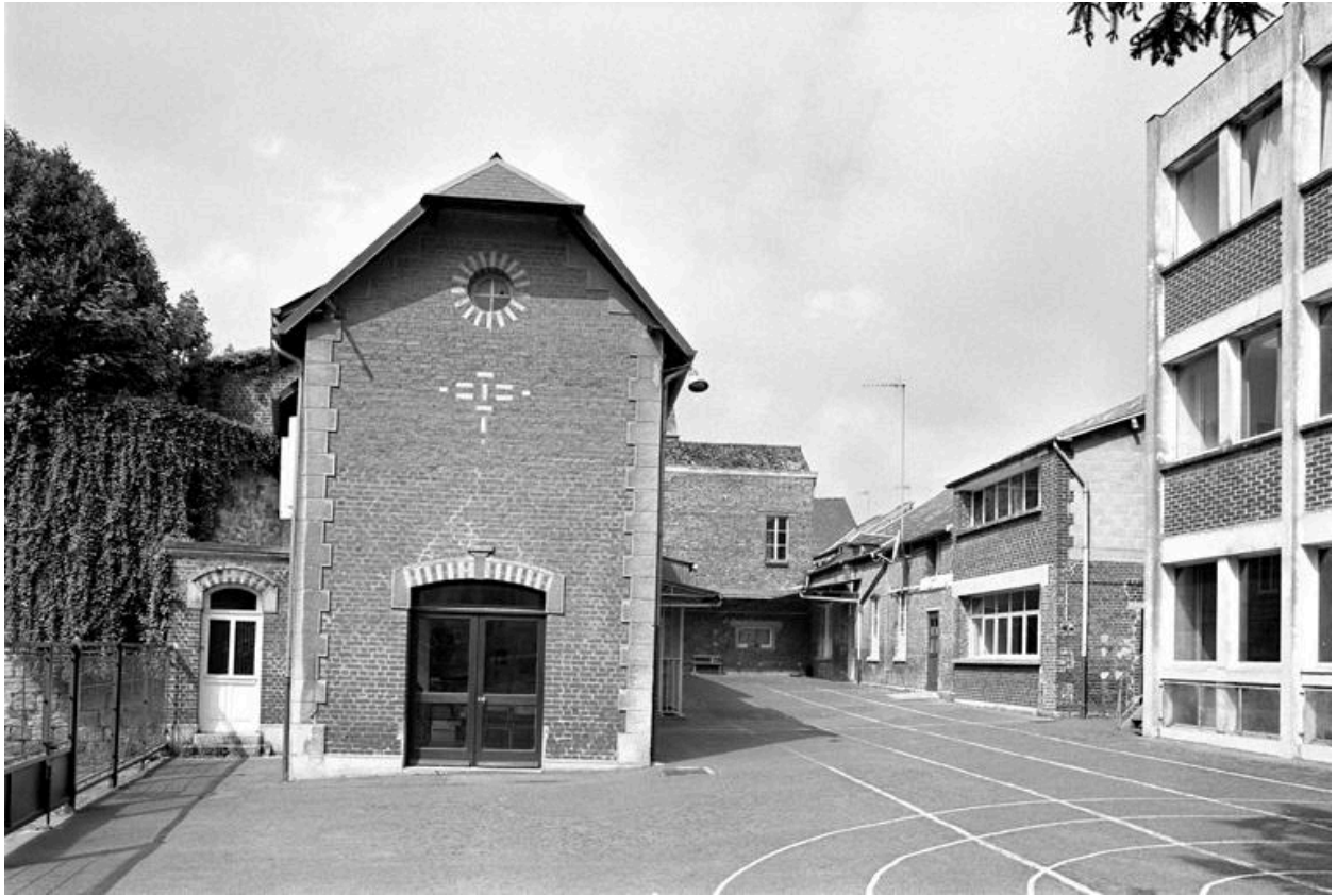
Vue de la cour.