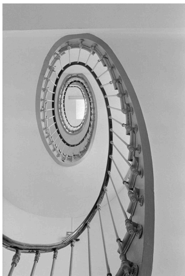
Vue intérieure en contre-plongée de l'escalier suspendu du bâtiment principal.