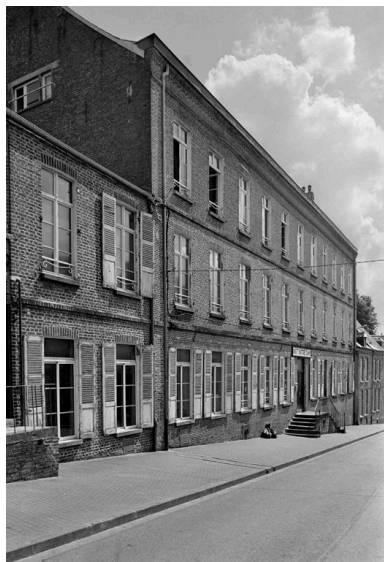
Vue de la façade sur rue. IVR22_19990201849Z