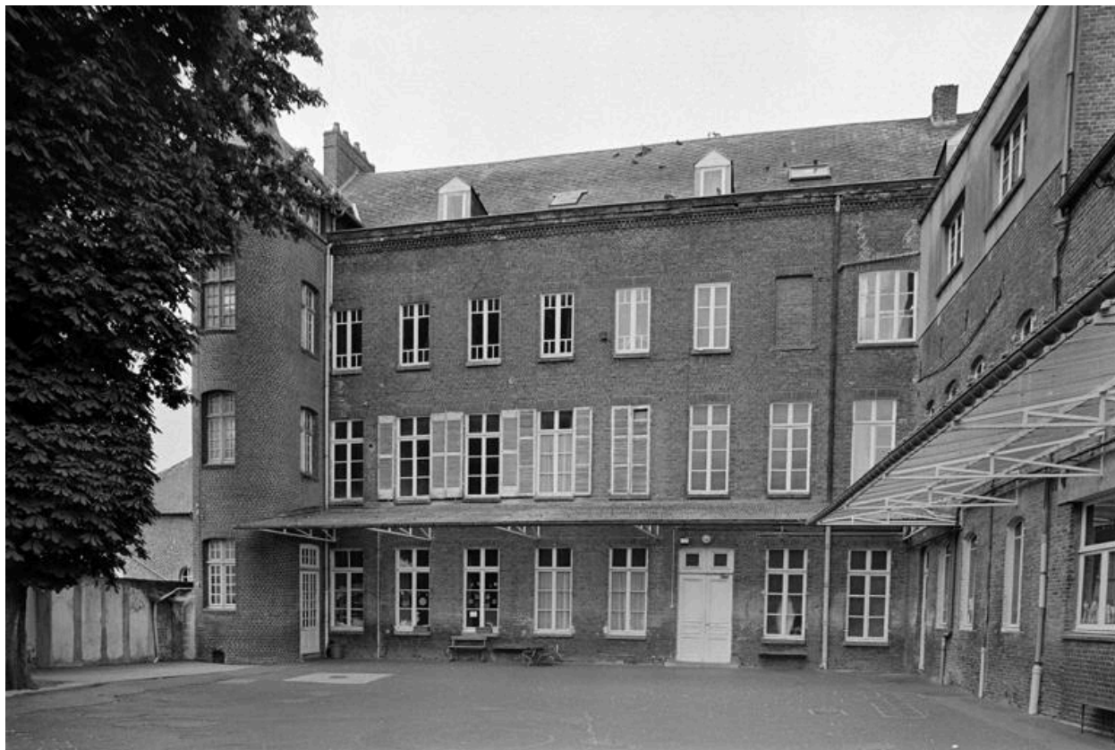
Vue de la façade sur cour.