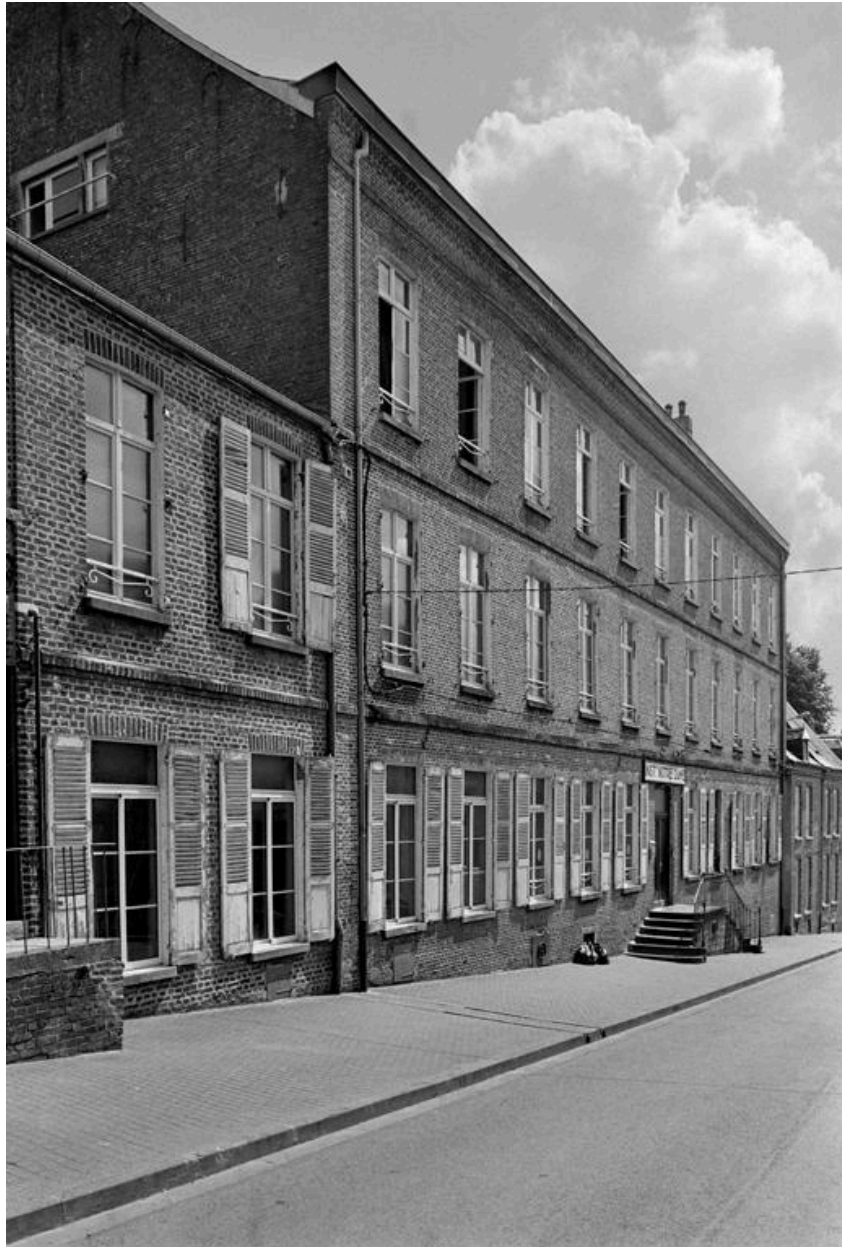
Vue de la façade sur rue.