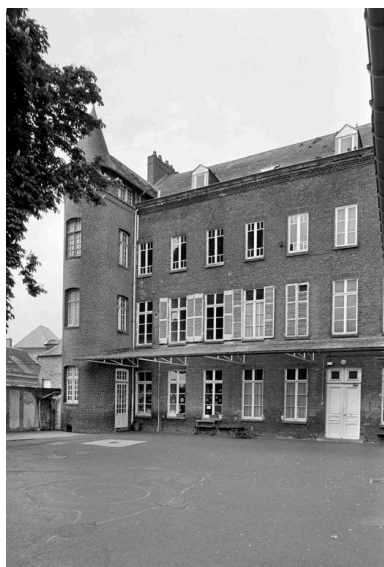
Vue de la façade sur la cour. IVR22_19990201835Z