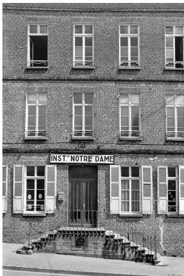
Vue de la façade sur rue.