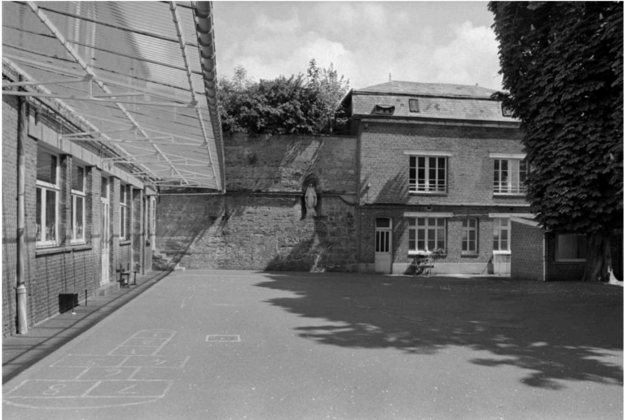
Vue de la cour, avec l'ancien préau à gauche et la fortification d'agglomération au fond.