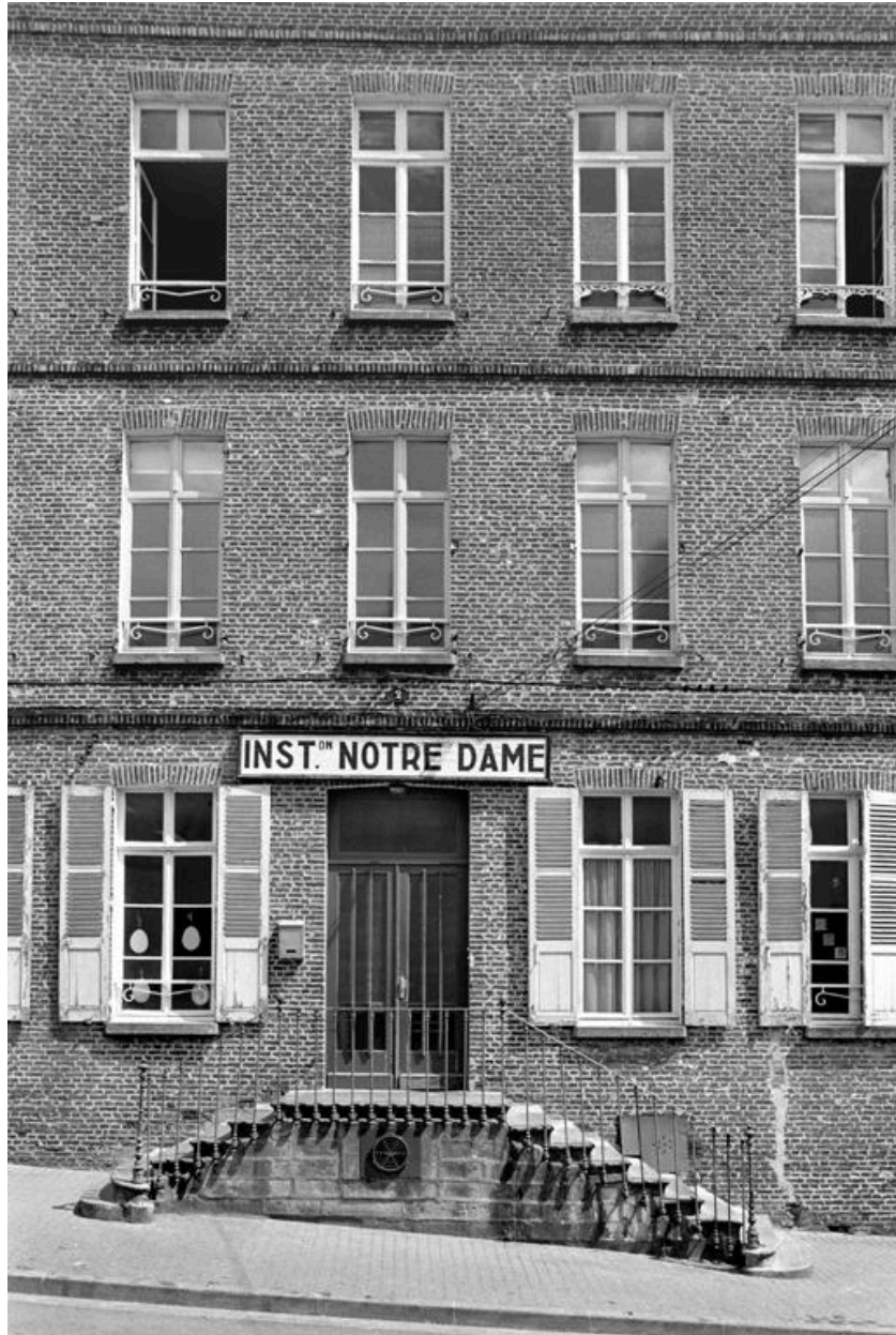
Vue de la façade sur rue.