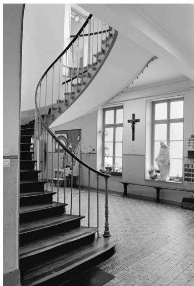
Vue intérieure : vestibule du bâtiment principal. IVR22_19990201842Z