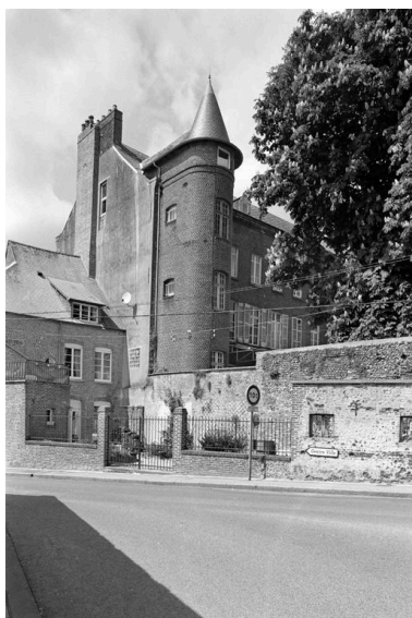
Vue de l'escalier hors-oeuvre, élevé sur la façade postérieure.