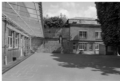
Vue de la cour, avec l'ancien préau à gauche et la fortification d'agglomération au fond. IVR22_19990201848Z