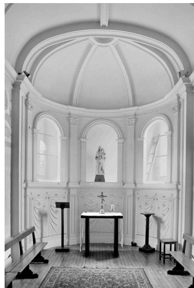
Vue intérieure de la chapelle (des soeurs ?), édifée en 1919. IVR22_19990201832Z