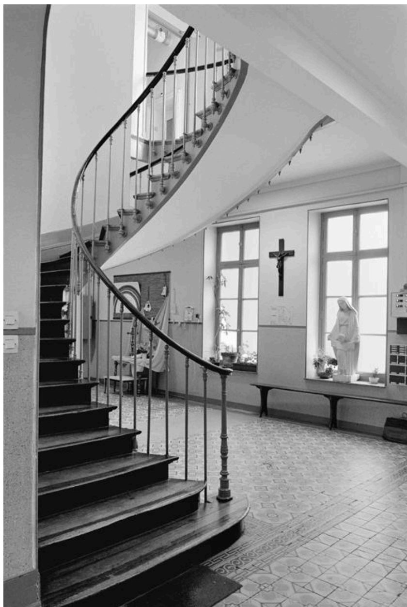
Vue intérieure : vestibule du bâtiment principal.