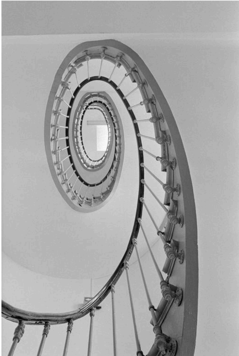
Vue intérieure en contre-plongée de l'escalier suspendu du bâtiment principal.