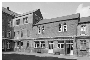
Vue de l'ancien préau surmonté de la chapelle (élevé dans la 2e moitié du 19e siècle). IVR22_19990201847Z