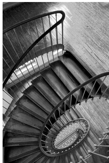
Vue intérieure en plongée de l'escalier suspendu du bâtiment principal. IVR22_19990201845Z