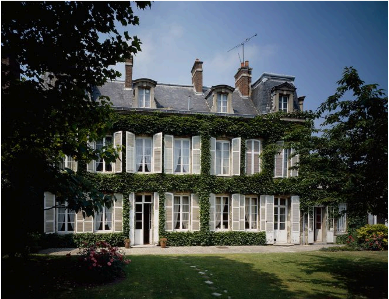
Elévation postérieure sur jardin.