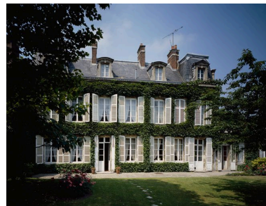
Élévation postérieure sur jardin.