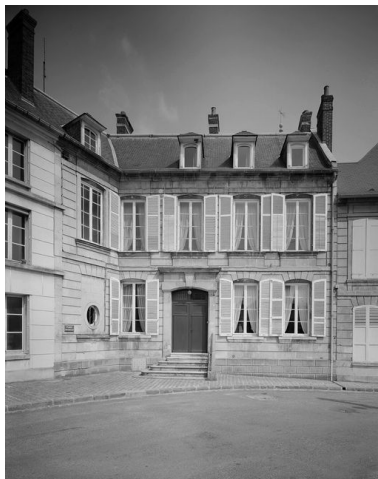
Élévation antérieure. IVR22_19866000090V