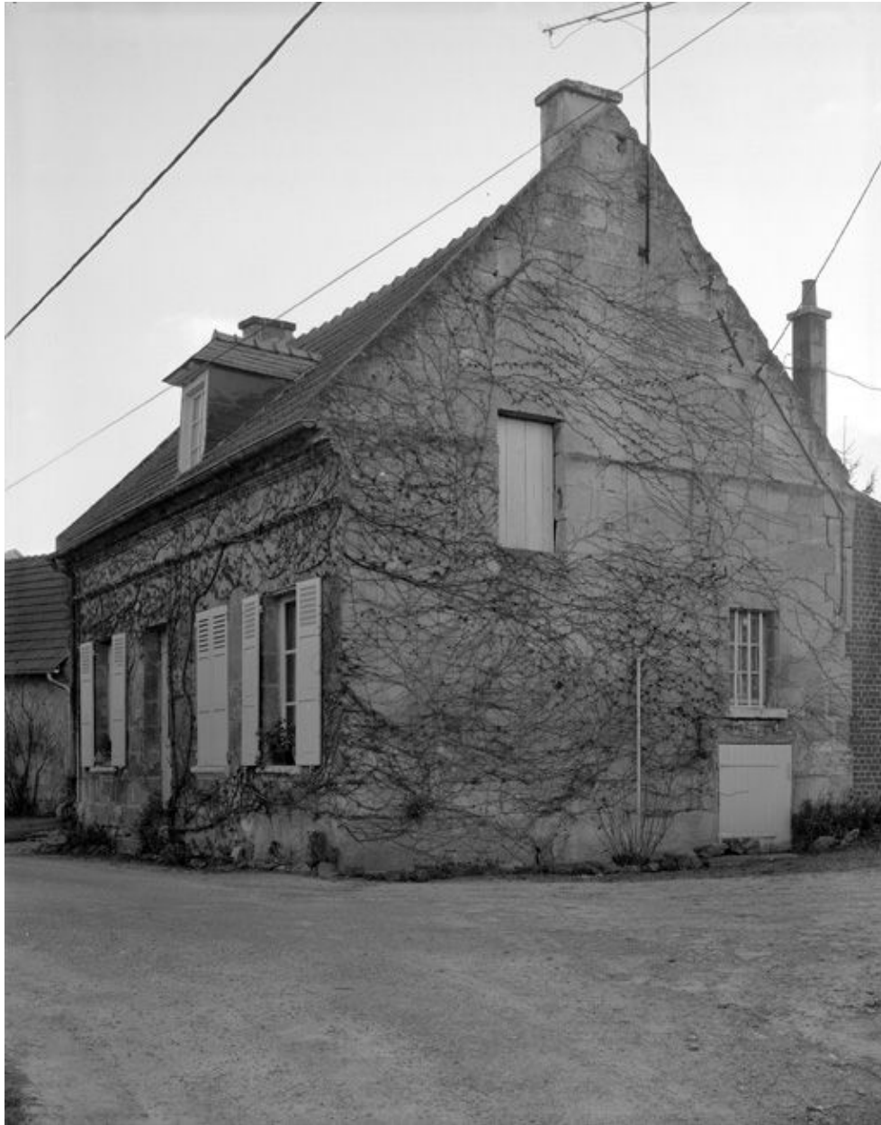
Logis. Vue générale.