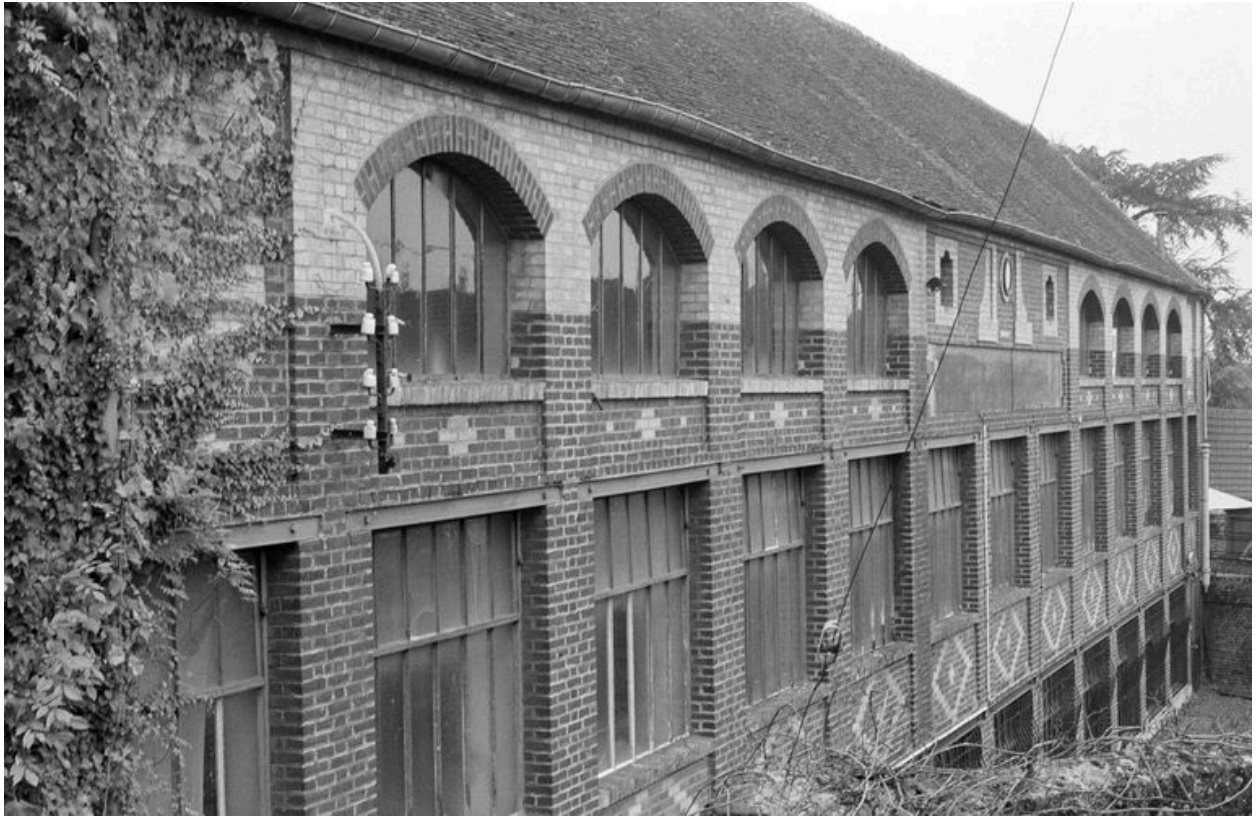
Atelier de fabrication, façade est, vue vers le nord.