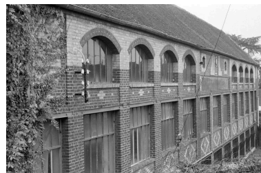
Atelier de fabrication, façade est, vue vers le nord. IVR22_19996001453Z