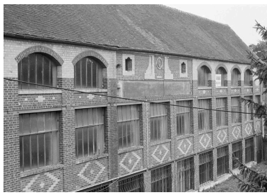
Atelier de fabrication, façade est : vue vers le nord. IVR22_19996001452Z