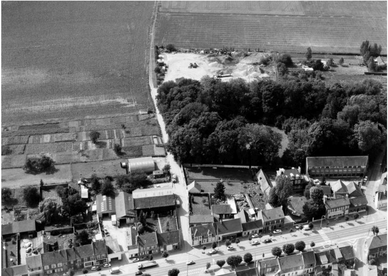
Vue aérienne, en 1991.