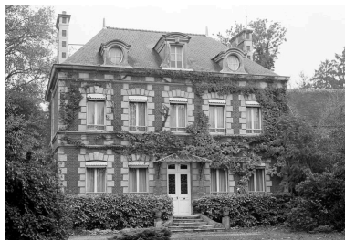
Maison patronale : façade antérieure. IVR22_19996001449Z