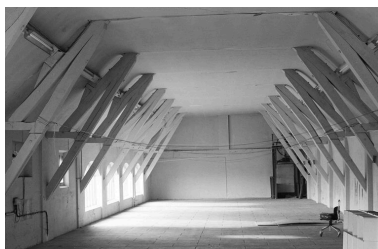
Atelier de fabrication, intérieur de l'étage de comble : vue vers le sud. IVR22_19996001444Z