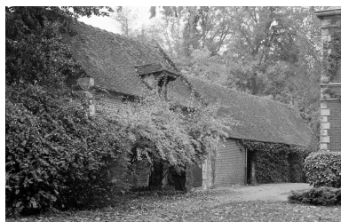
Remises.