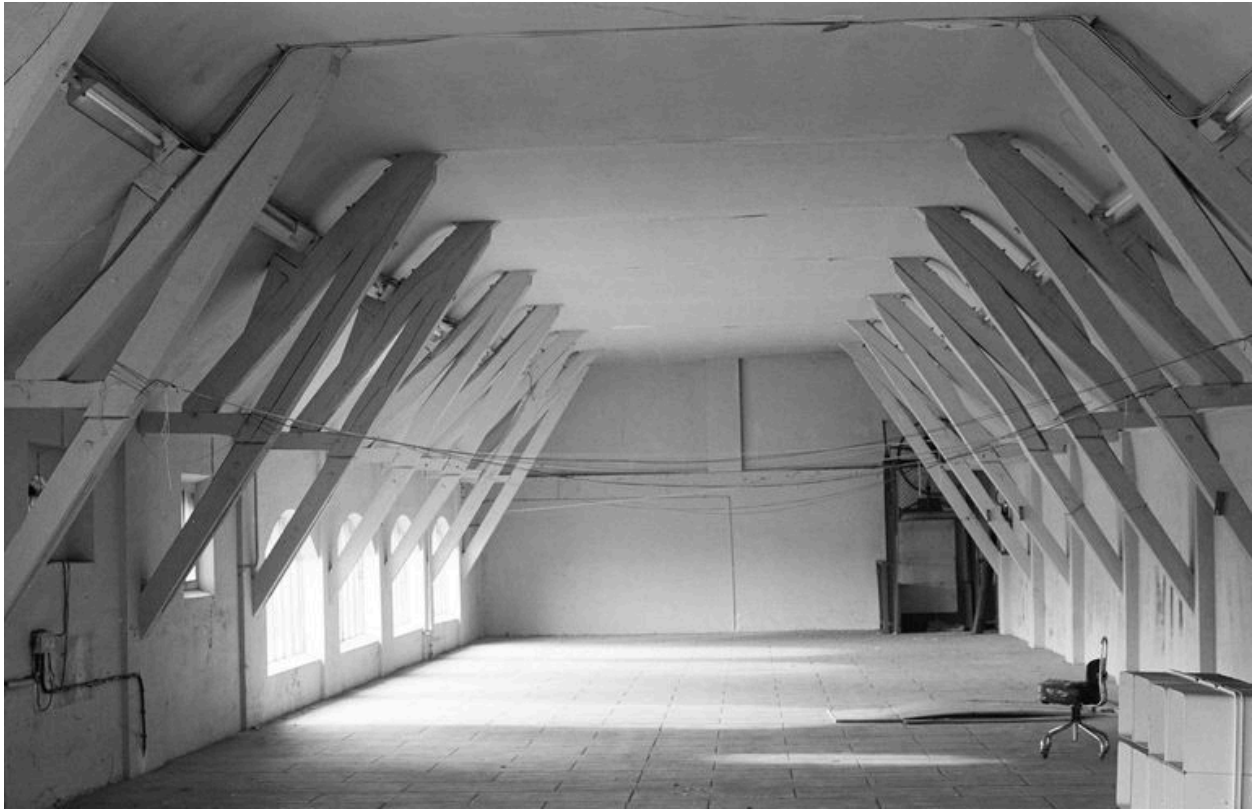
Atelier de fabrication, intérieur de l'étage de comble : vue vers le sud.