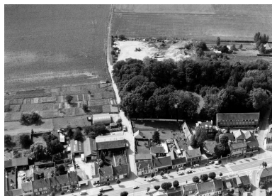
Vue aérienne, en 1991.