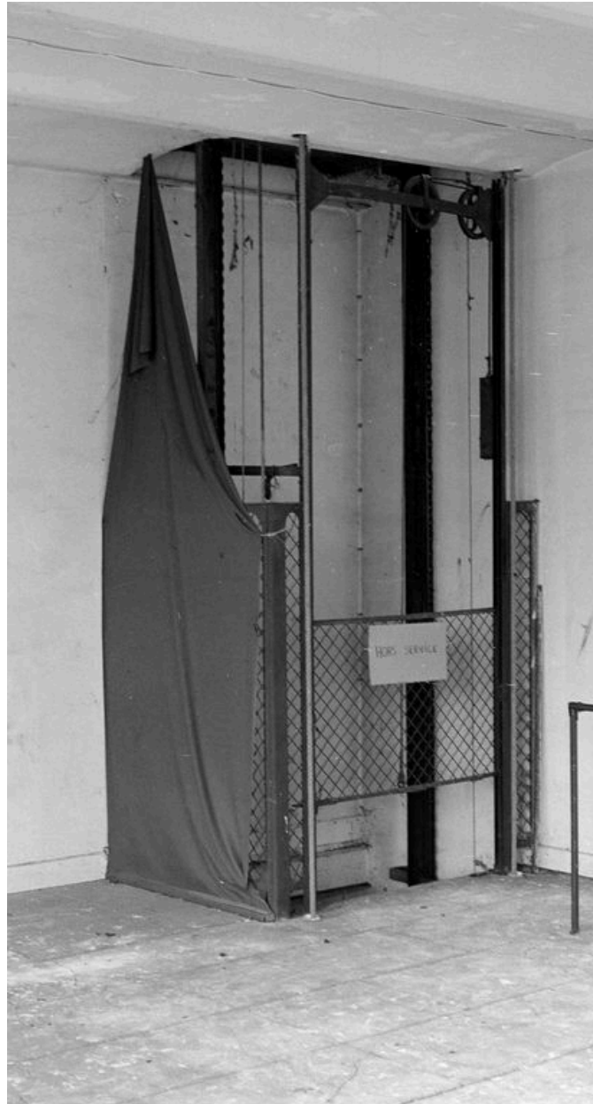
Atelier de fabrication, monte-charge situé dans l'angle sud-ouest du premier étage.