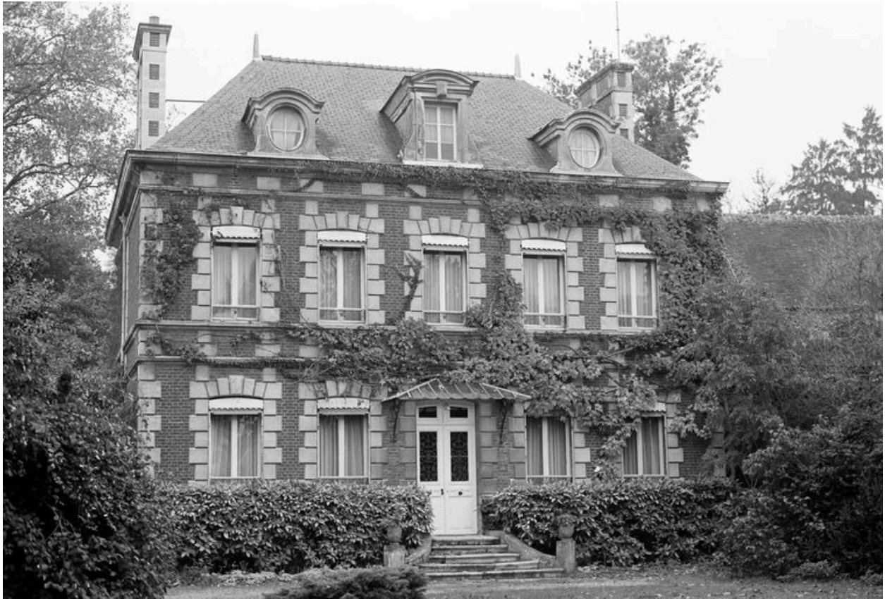
Maison patronale : façade antérieure.