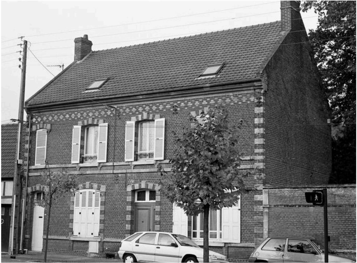
Bureaux : façade sur rue.