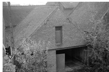
Dépendance à usage de garage.