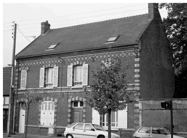
Bureaux : façade sur rue. IVR22_19996001448Z