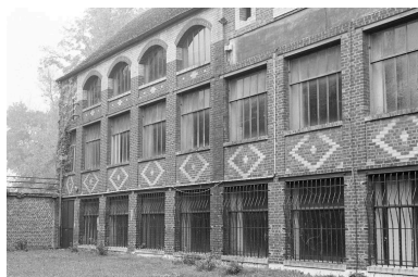
Atelier de fabrication, façade est, vue vers le sud.