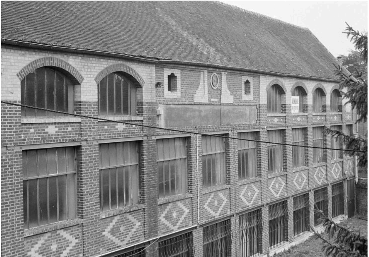
Atelier de fabrication, façade est : vue vers le nord.