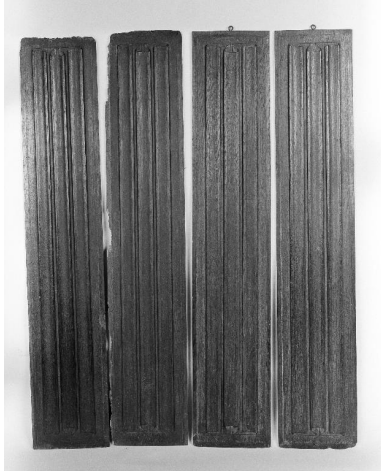
Vue des quatre panneaux. IVR22_19966003898X