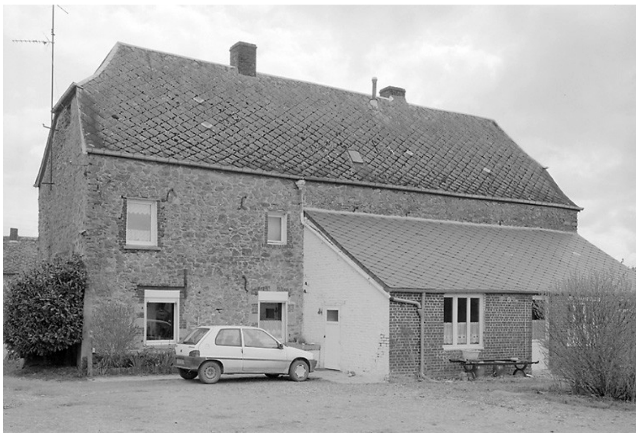
Vue de l'élévation postérieure du logis.