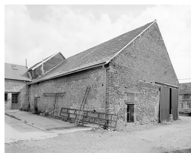
Vue de la grange, depuis la cour.