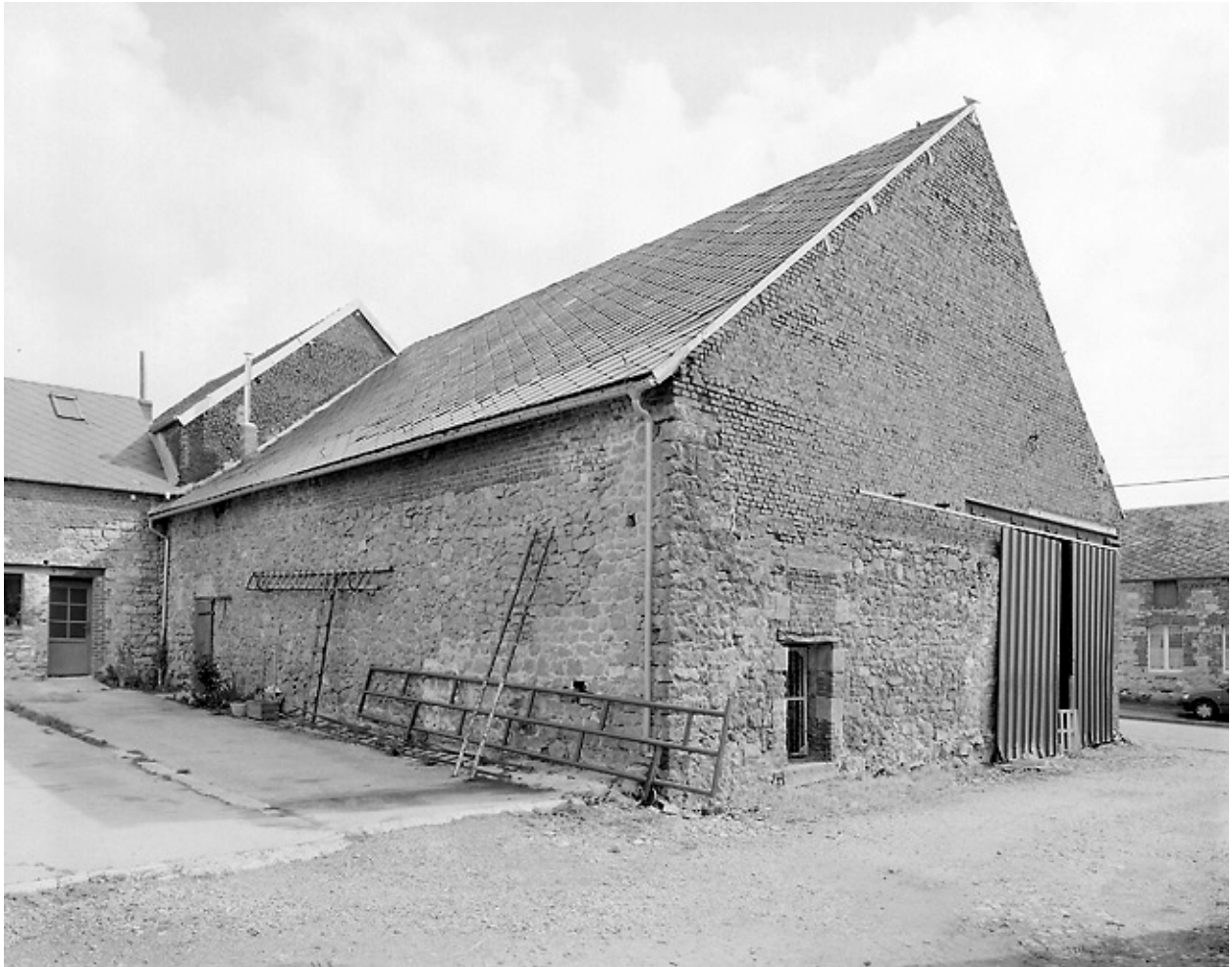
Vue de la grange, depuis la cour.