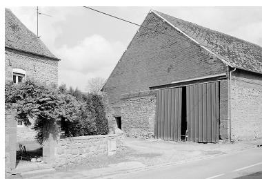
Vue de la grange, depuis la voie.