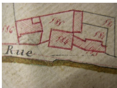
Extrait de la feuille cadastrale A2. Plan de situation en 1810.