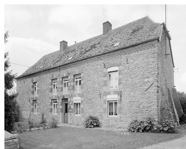
Vue générale du logis.