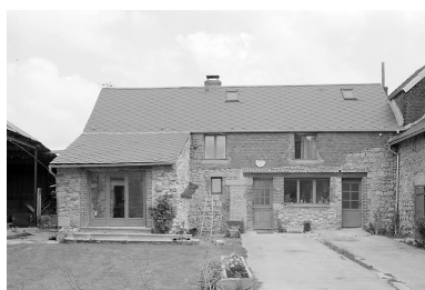
Vue des anciennes étables-fenil.