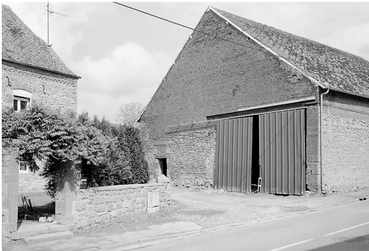
Vue de la grange, depuis la voie.