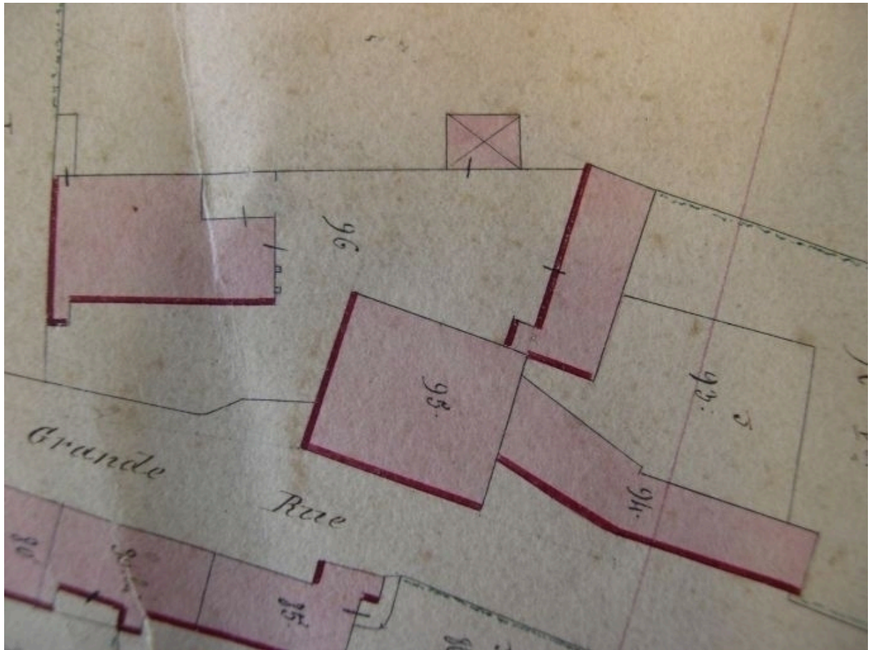
Extrait de la feuille cadastrale D1. Plan de situation en 1845.