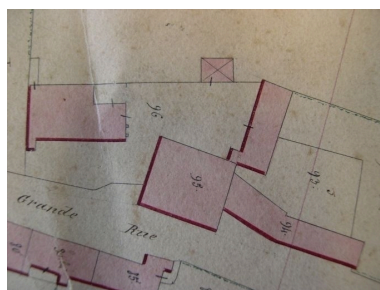
Extrait de la feuille cadastrale D1. Plan de situation en 1845.