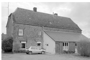
Vue de l'élévation postérieure du logis.