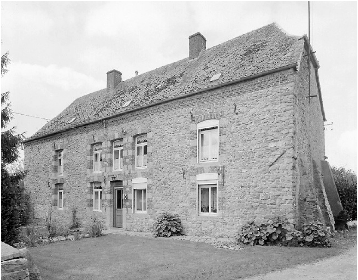
Vue générale du logis.