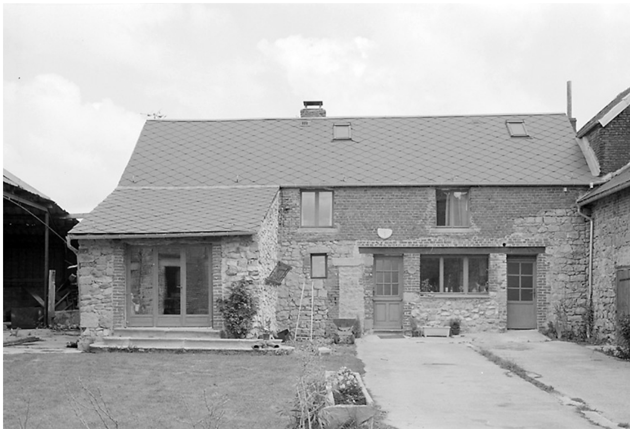
Vue des anciennes étables-fenil.