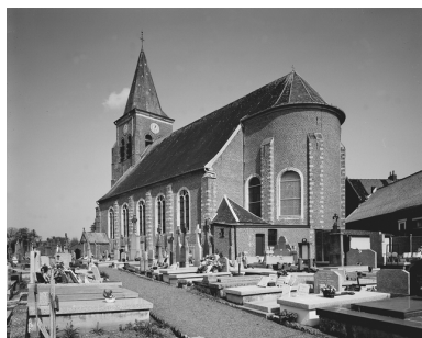
Vue générale extérieure, depuis le cimetière.