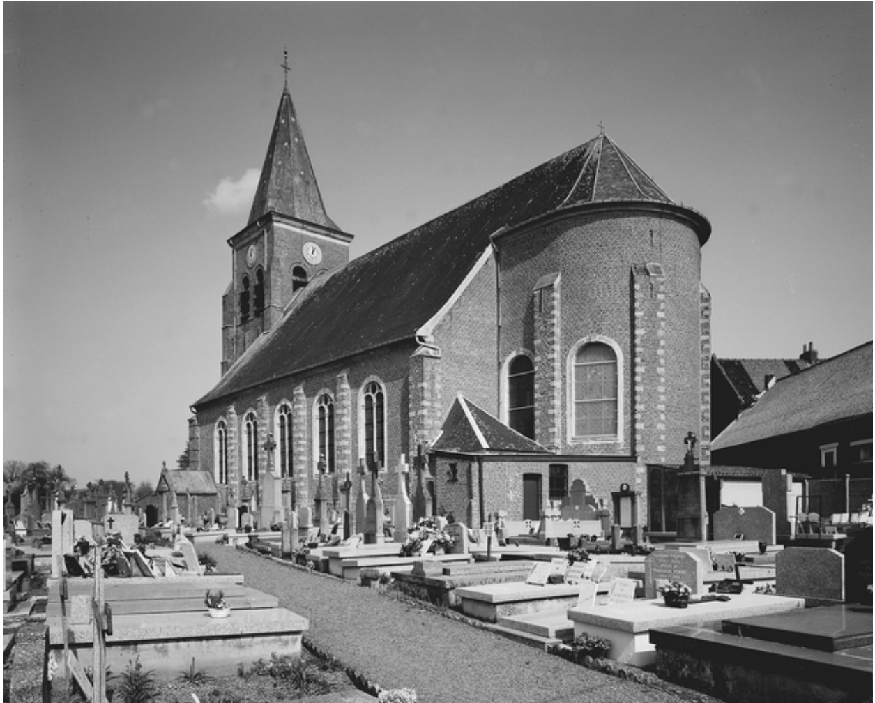
Vue générale extérieure, depuis le cimetière.