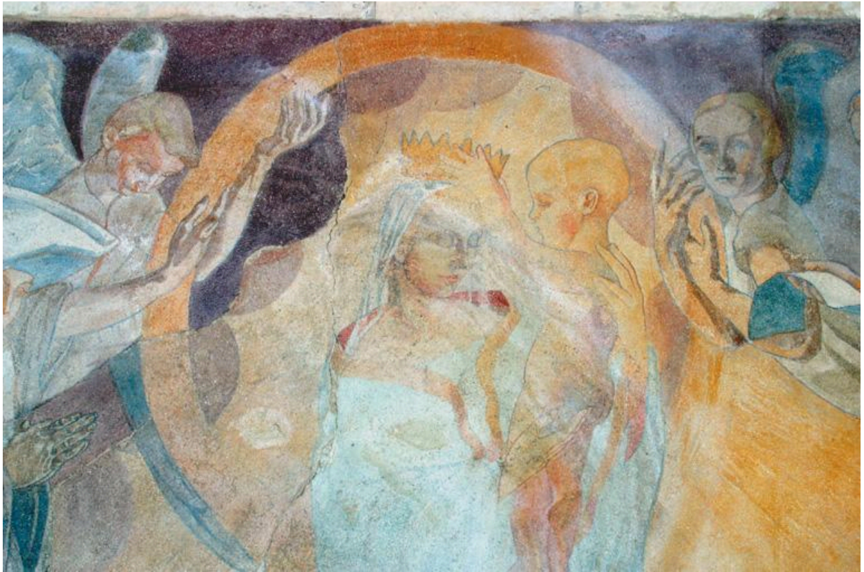
Détail de la partie centrale de la peinture.