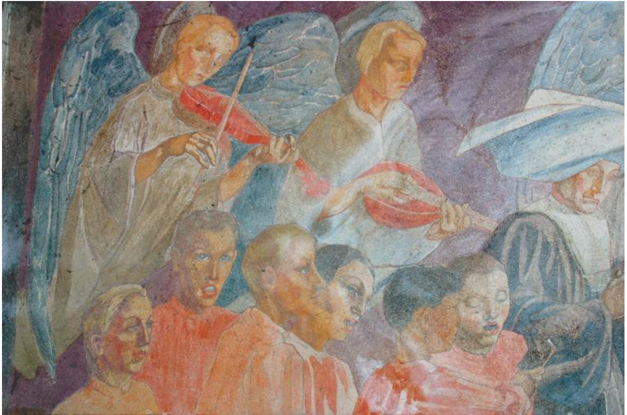
Détail de la partie gauche de la peinture.