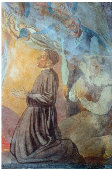
Détail de la partie droite de la peinture.