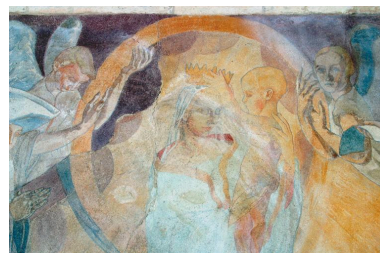
Détail de la partie centrale de la peinture. IVR22_20040202613NUC1A