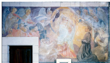
Vue générale. IVR22_20050201588VA