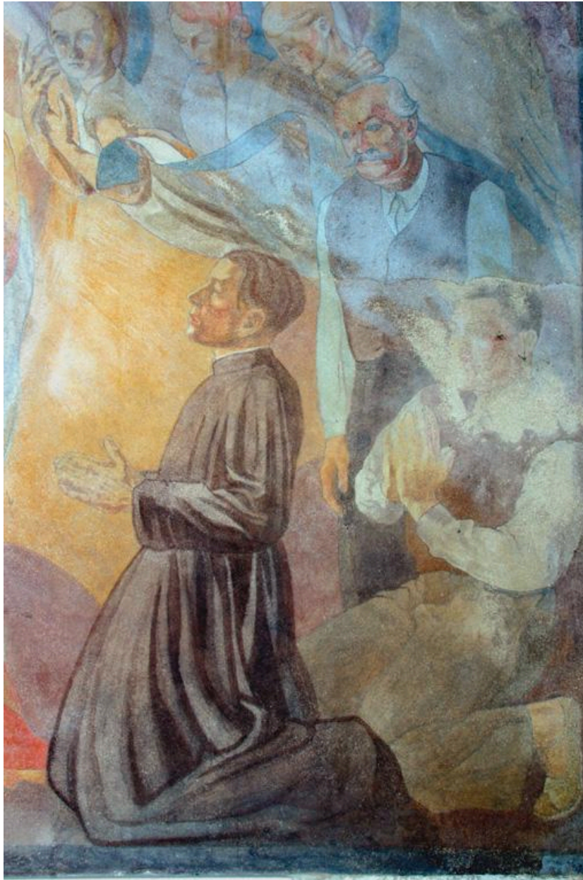
Détail de la partie droite de la peinture.

IVR22_20040202612NUC1A Auteur de l'illustration : Irwin Leullier (c) Région Hauts-de-France - Inventaire général reproduction soumise à autorisation du titulaire des droits d'exploitation