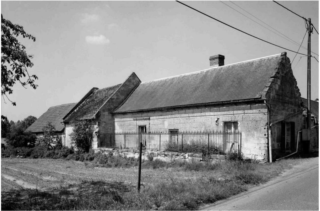
Logis. Elévation postérieure.