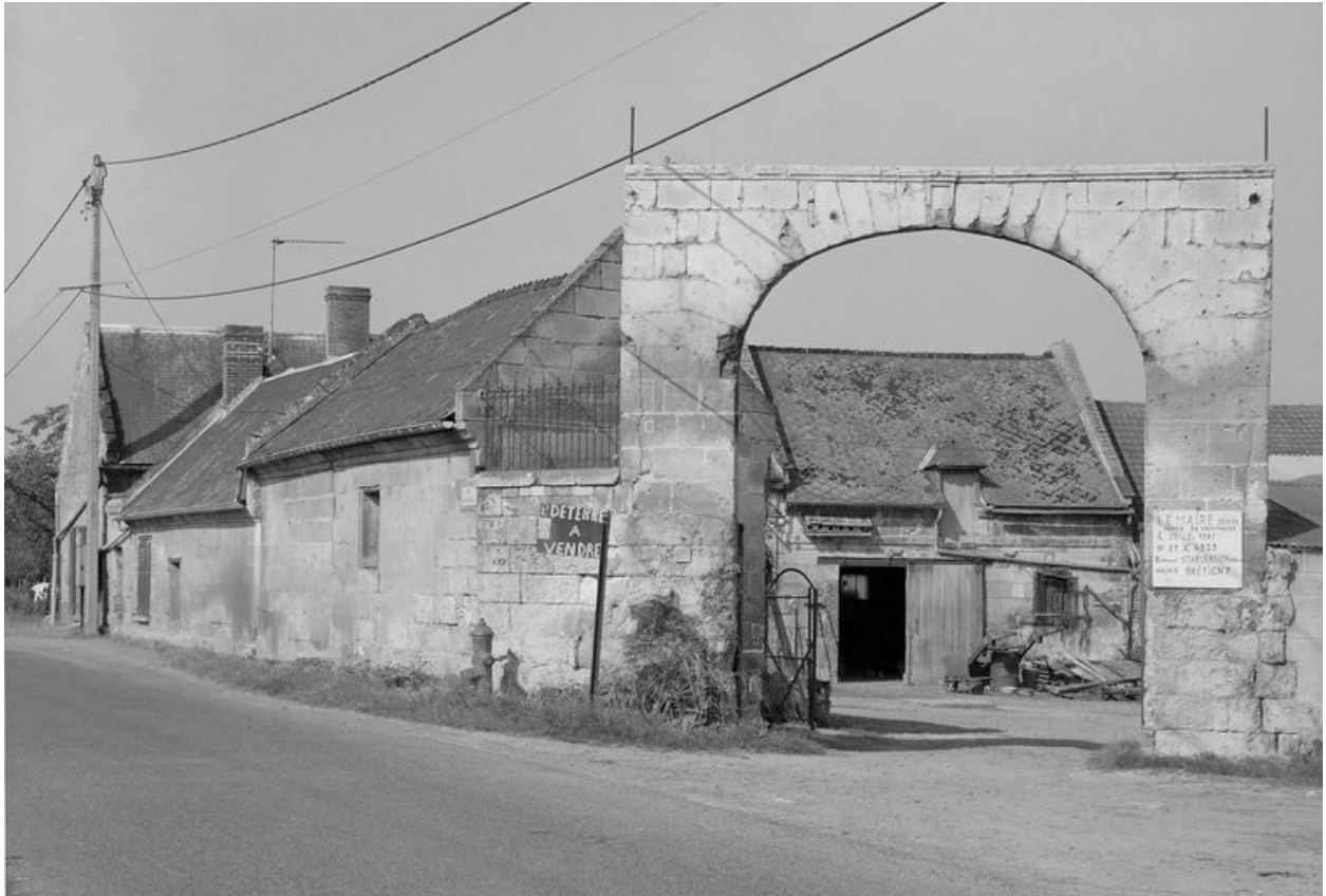
Vue générale depuis la rue.