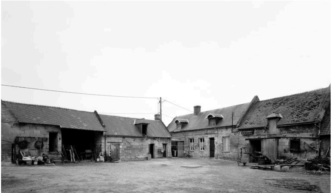
Vue des bâtiments sur cour.