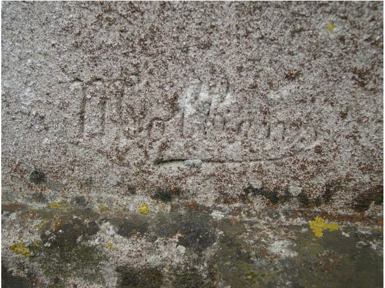
Vue de détail sur la signature du sculpteur Charles Molliens.