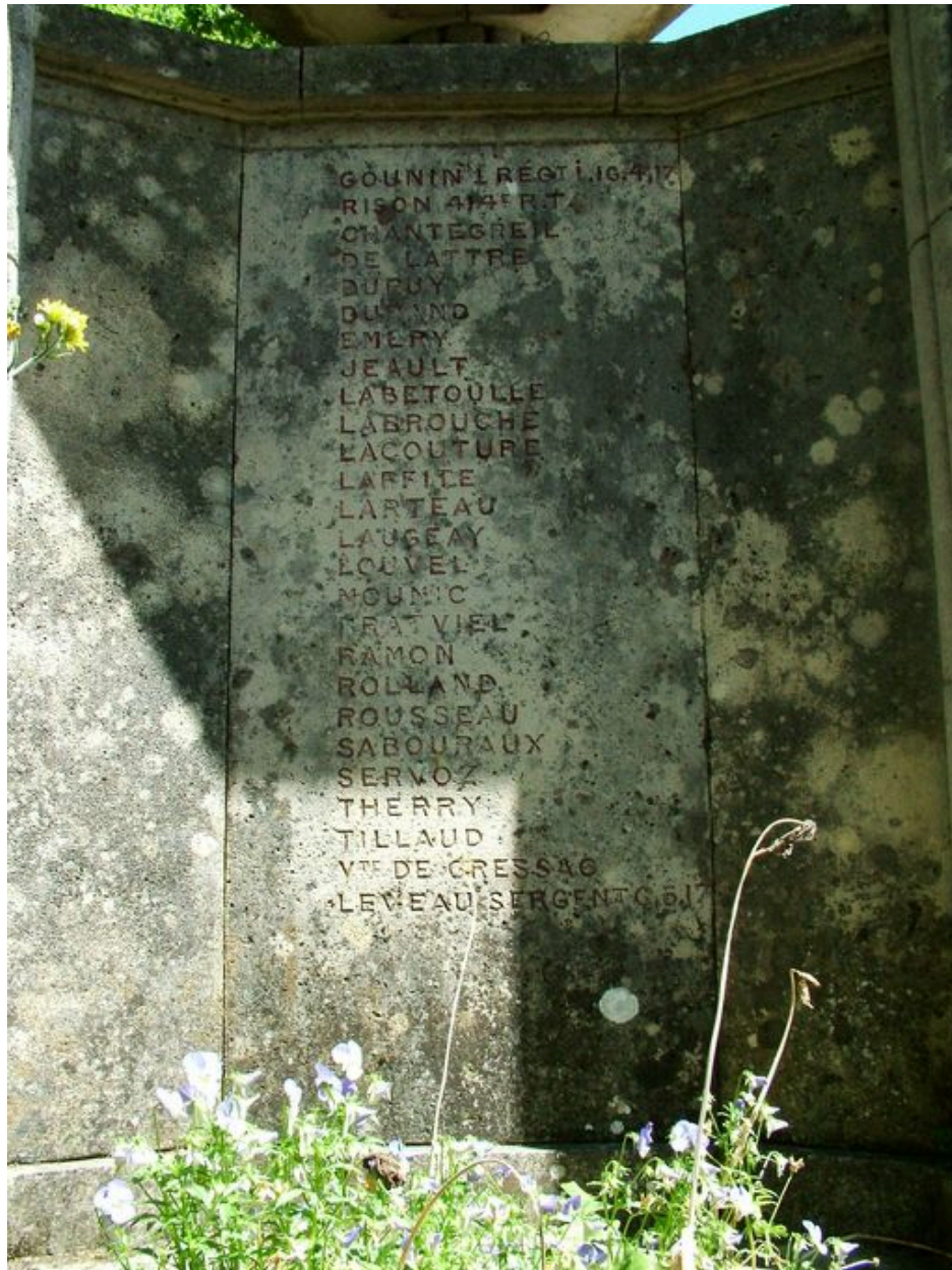
Détail des inscriptions.