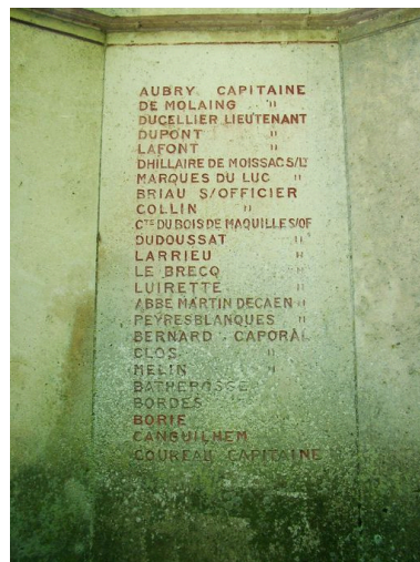
Détail des inscriptions.