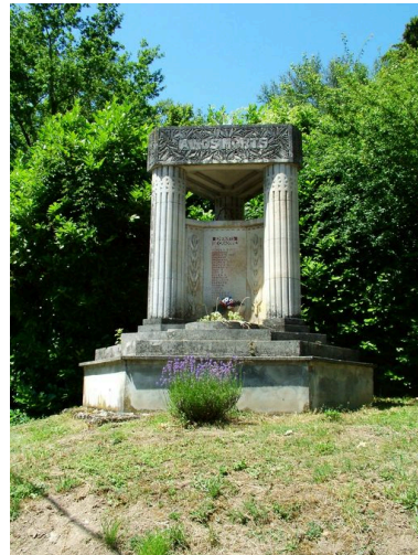
Vue de face. IVR22_20030202562NUCA