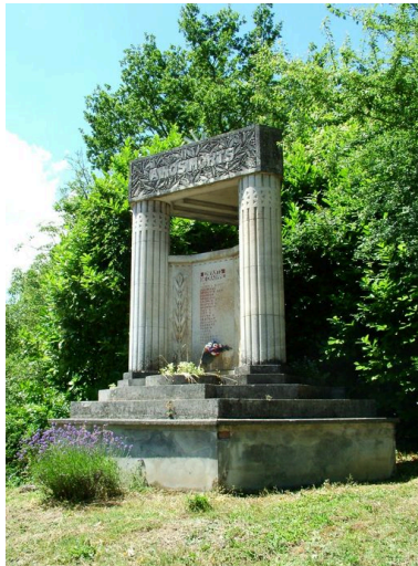
Vue générale. IVR22_20030202561NUCA