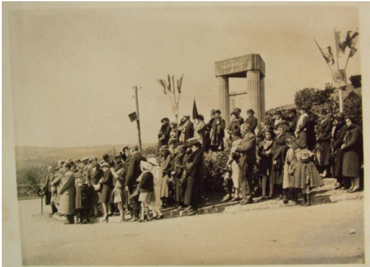
Vue de la célébration d'inauguration.