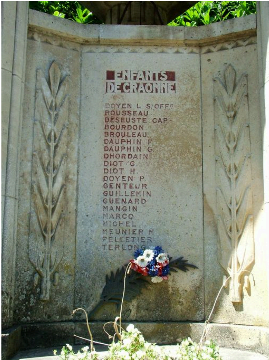
Détail des inscriptions.