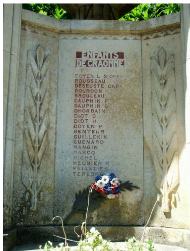
Détail des inscriptions.