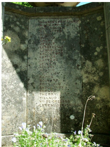
Détail des inscriptions. IVR22_20030202565NUCA