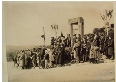
Vue de la célébration d'inauguration.