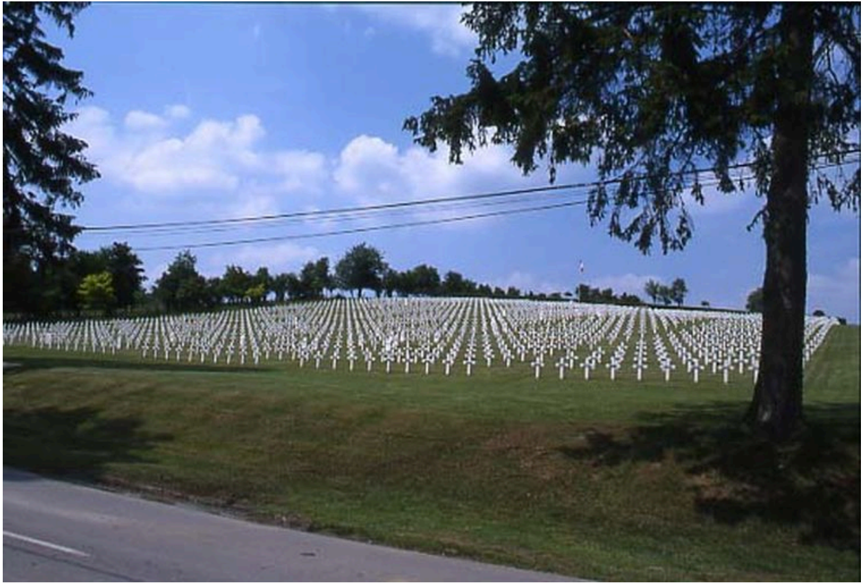
Autre vue de la nécropole nationale.