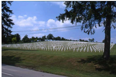
Autre vue de la nécropole nationale. IVR22_20030203210NUCA