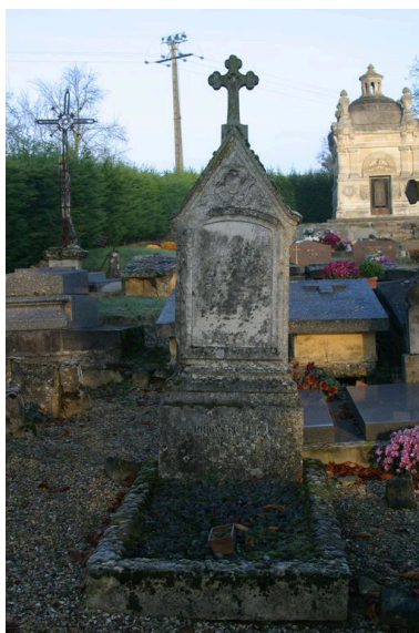
Vue d'une tombe ancienne du cimetière communal.