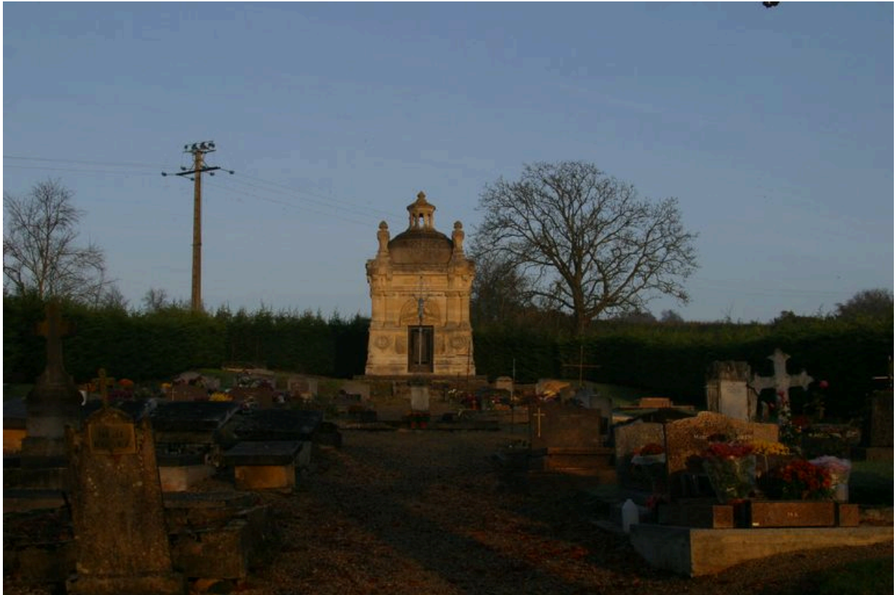
Vue du cimetière communal.