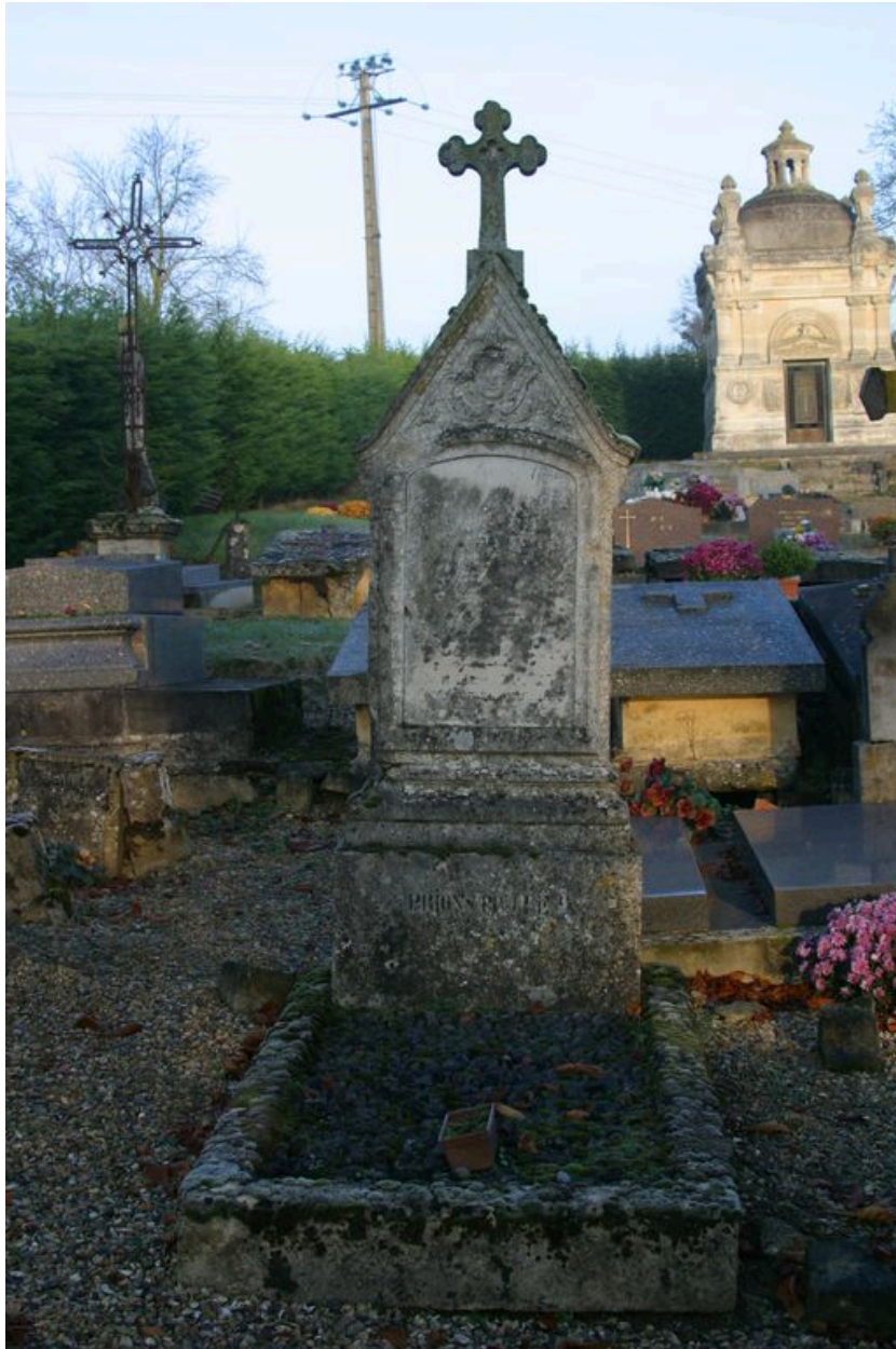
Vue d'une tombe ancienne du cimetière communal.