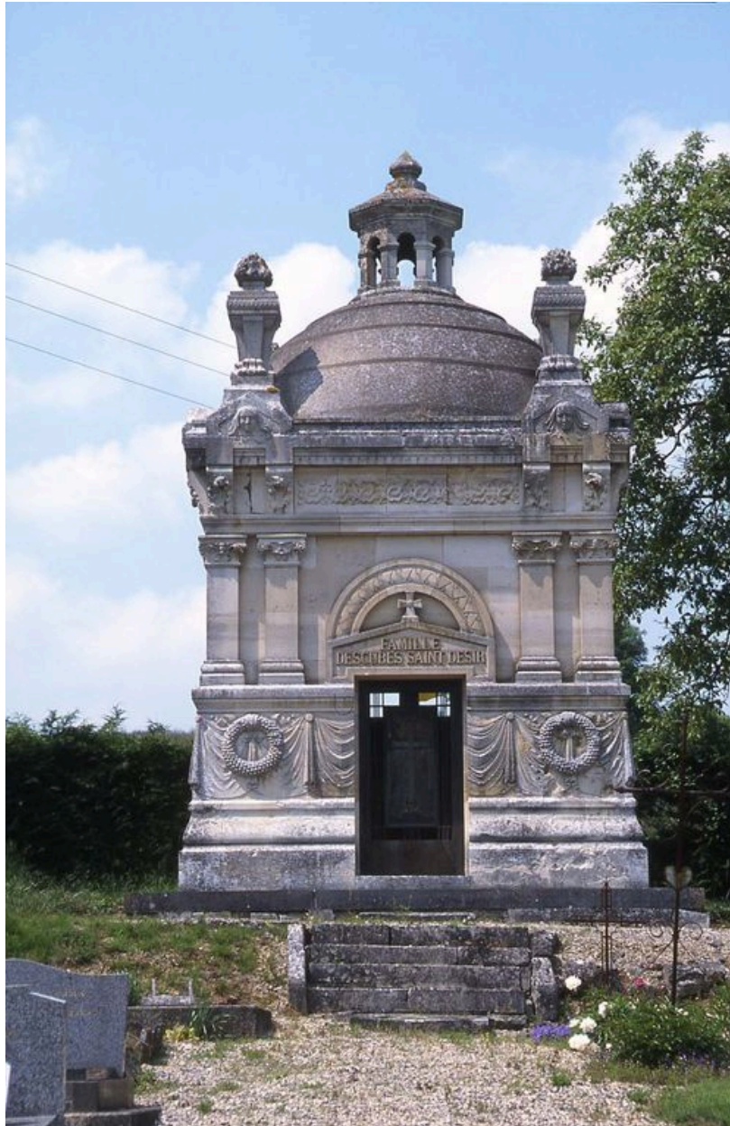
Vue du monument de la famille Descubes Saint-Désir.