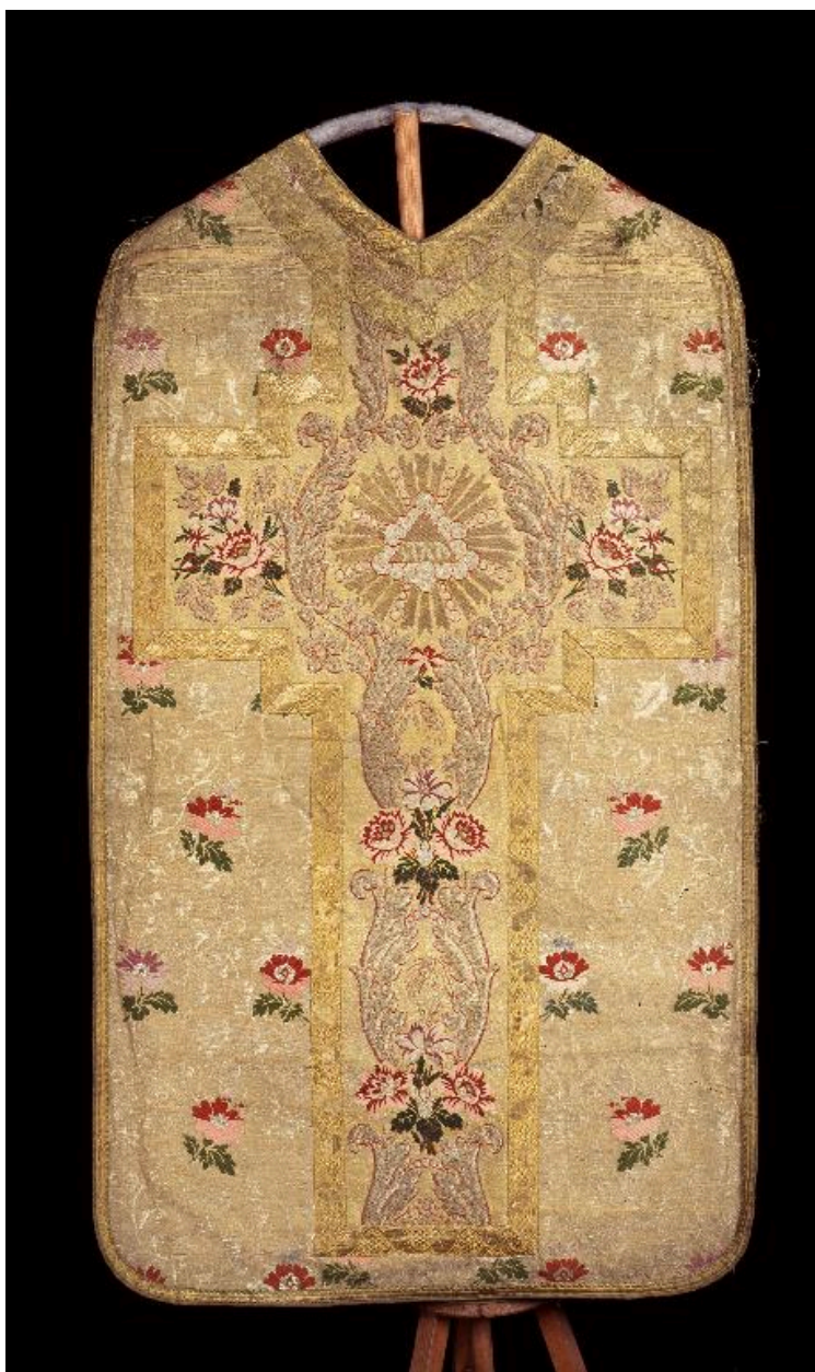
Vue du dos.