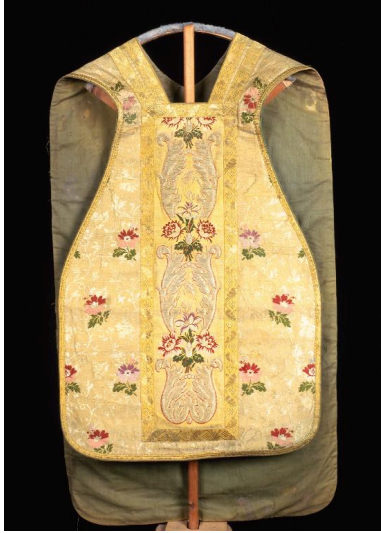
Vue du devant. IVR22_19956001039XA