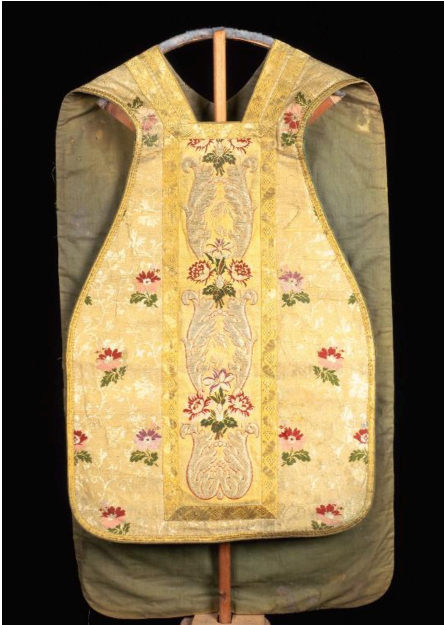
Vue du devant.