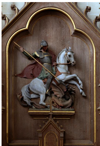
Bas-relief du retable de l'autel Saint-Georges : saint Georges terrassant le dragon.

IVR22_2014800066NUC2A