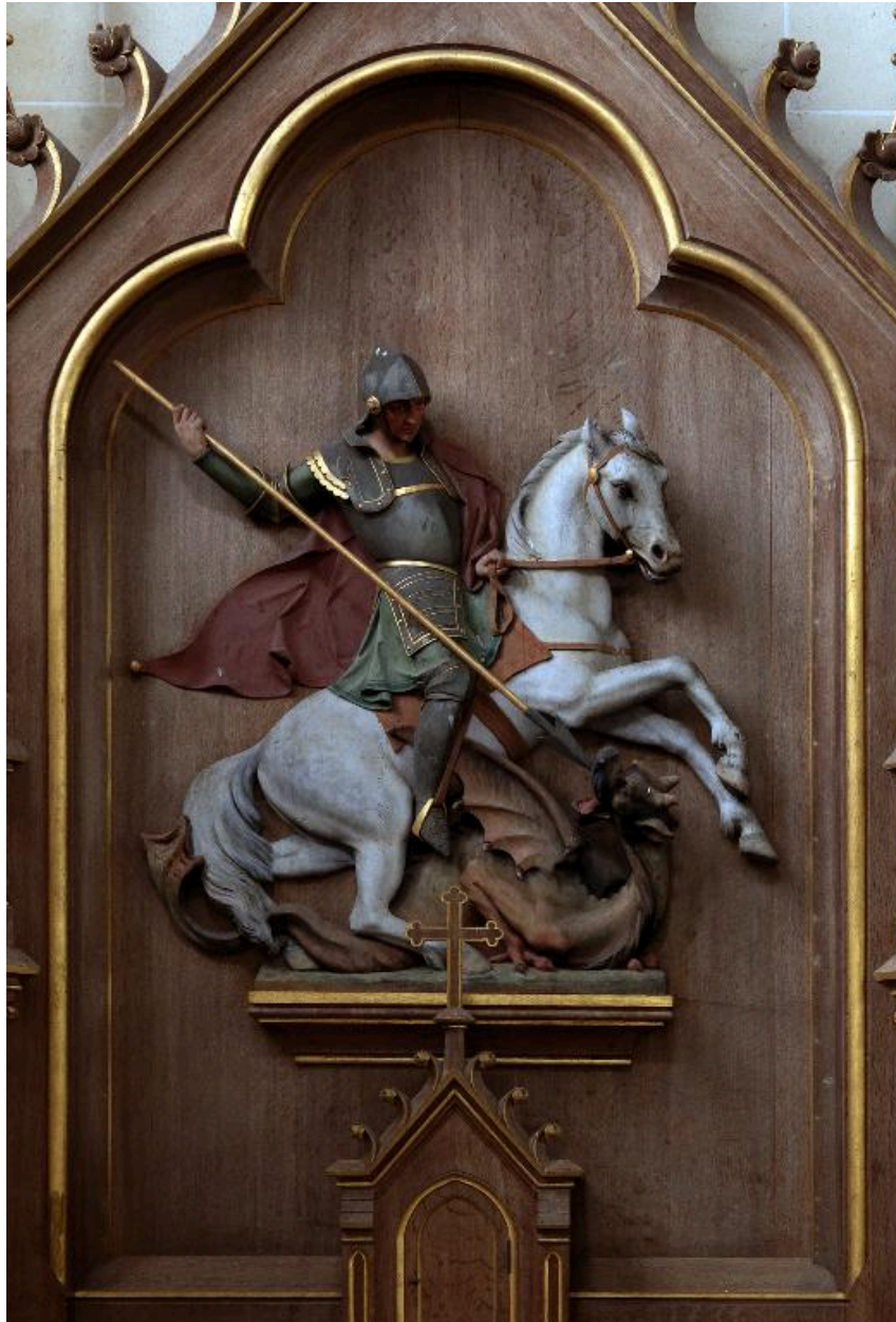
Bas-relief du retable de l'autel Saint-Georges : saint Georges terrassant le dragon.