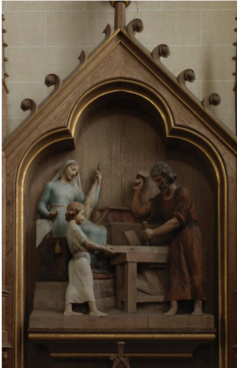
Bas-relief du retable de l'autel de la Sainte Famille : la Sainte Famille.