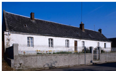
Vue de la façade du logis, portant la date de 1806, depuis le sud.

Phot. Christiane Riboulleau IVR22_19900202989ZA