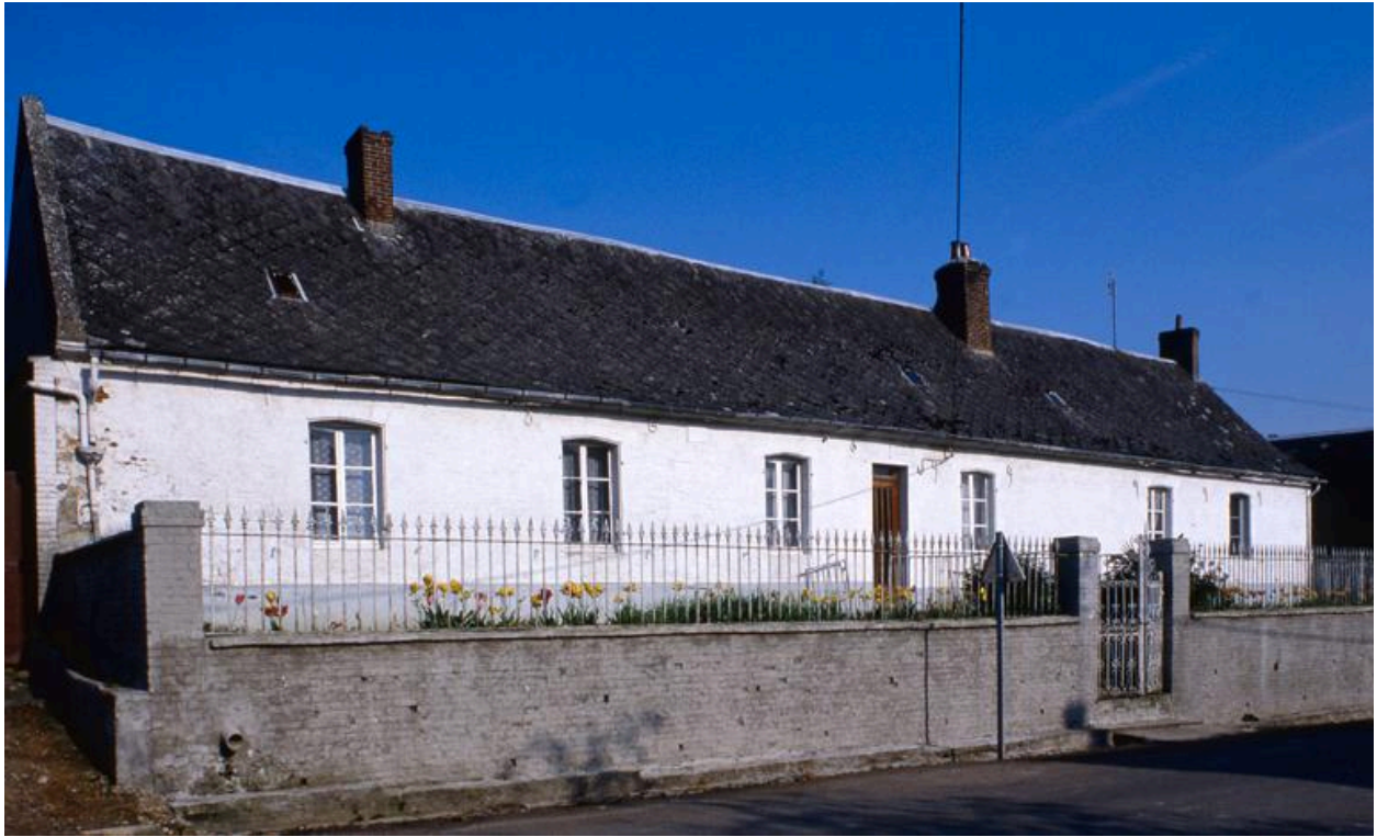
Vue de la façade du logis, portant la date de 1806, depuis le sud.