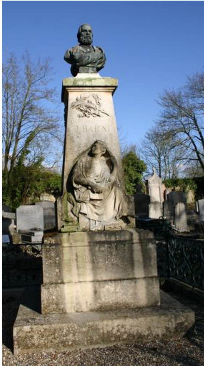
Monument funéraire de Jules Barni.