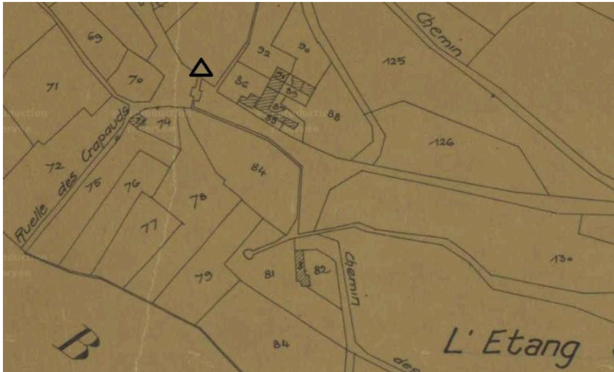
Emplacement de la fontaine, extrait de la section A du plan cadastral de 1835 (AD Aisne : 3P0366_02).