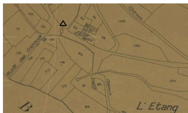
Emplacement de la fontaine, extrait de la section A du plan cadastral de 1835 (AD Aisne : 3P0366_02).

Phot. Archives départementales de l'Aisne IVR32_20170205072NUCA