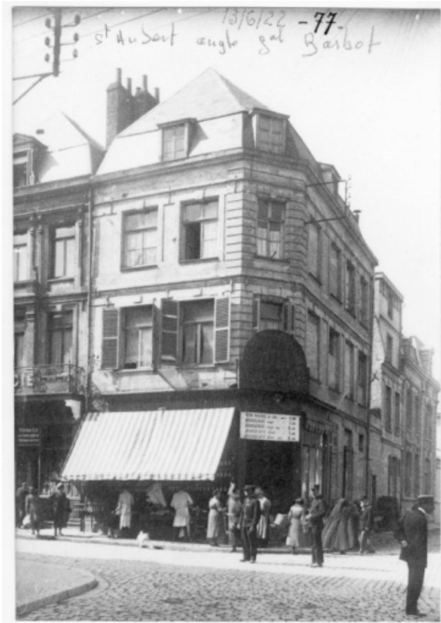
Arras. Rue Saint-Aubert. Photographie, 1922 (Médiathèque d'Arras ; 129).