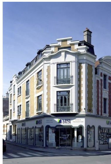
Vue générale. IVR31_20086200120XE