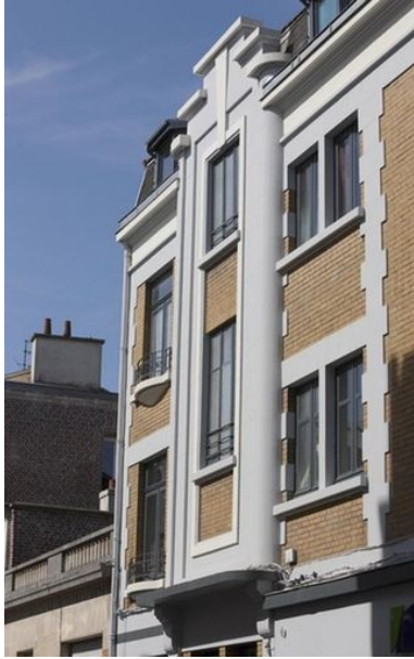
Oriel situé sur la façade rue du Général-Barbot.