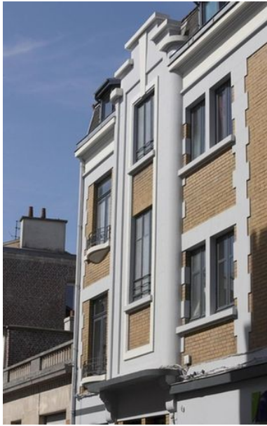
Oriel situé sur la façade rue du Général-Barbot.