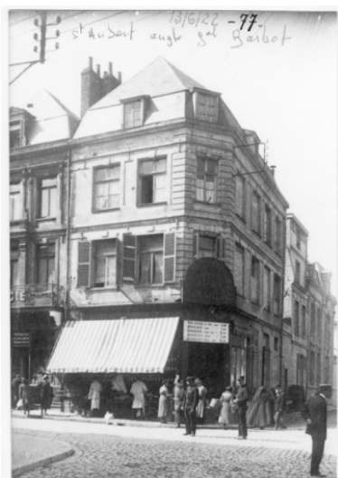
Arras. Rue Saint-Aubert. Photographie, 1922 (Médiathèque d'Arras ; 129). IVR31_20096200302NUCB