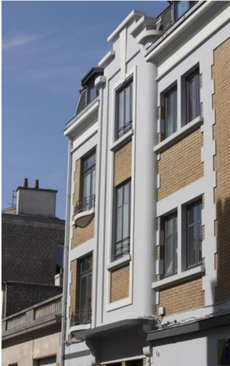
Oriel situé sur la façade rue du Général-Barbot.