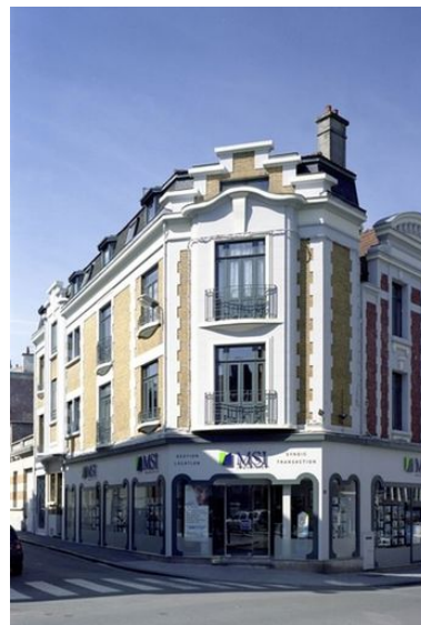
Vue générale. IVR31_20086200120XE