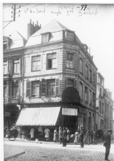
Arras. Rue Saint-Aubert. Photographie, 1922 (Médiathèque d'Arras ; 129). IVR31_20096200302NUCB