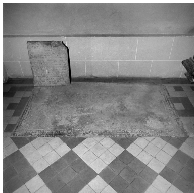
Vue générale de la dalle, encastrée dans le dallage du collatéral nord.

Phot. Christiane Riboulleau IVR22_19880200942X