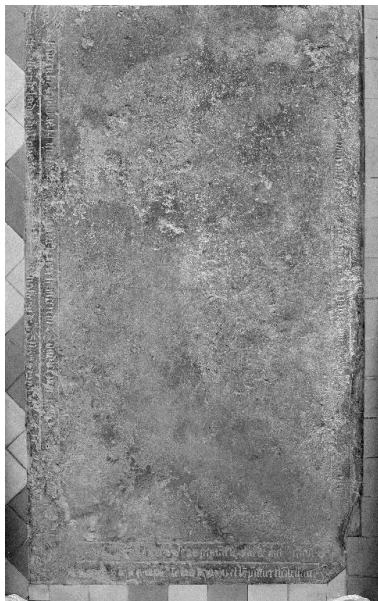
Vue générale de la dalle.

IVR22_19880200942X