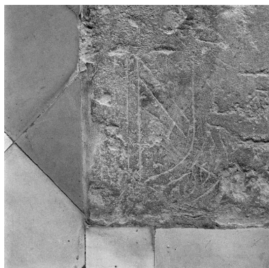
Détail : écu armorié gravé dans l'angle inférieur gauche de la dalle (armoiries d'alliance de Hugues de La Vergne et de son épouse Anne Séguier ?).

IVR22_20010202628X