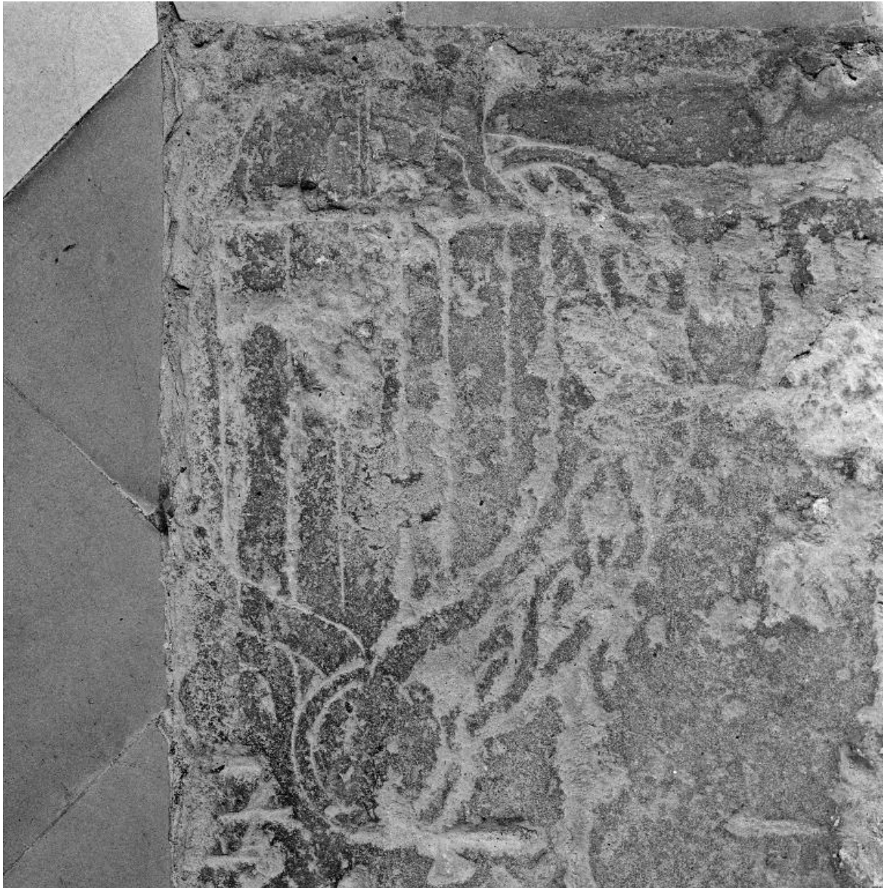
Détail : écu portant les armoiries de Hugues de La Vergne, gravé dans l'angle supérieur gauche de la dalle.