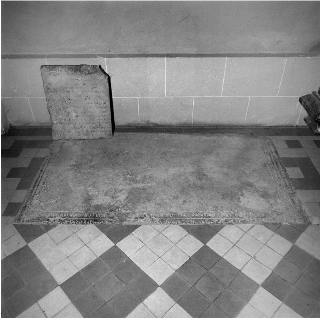
Vue générale de la dalle, encastrée dans le dallage du collatéral nord.