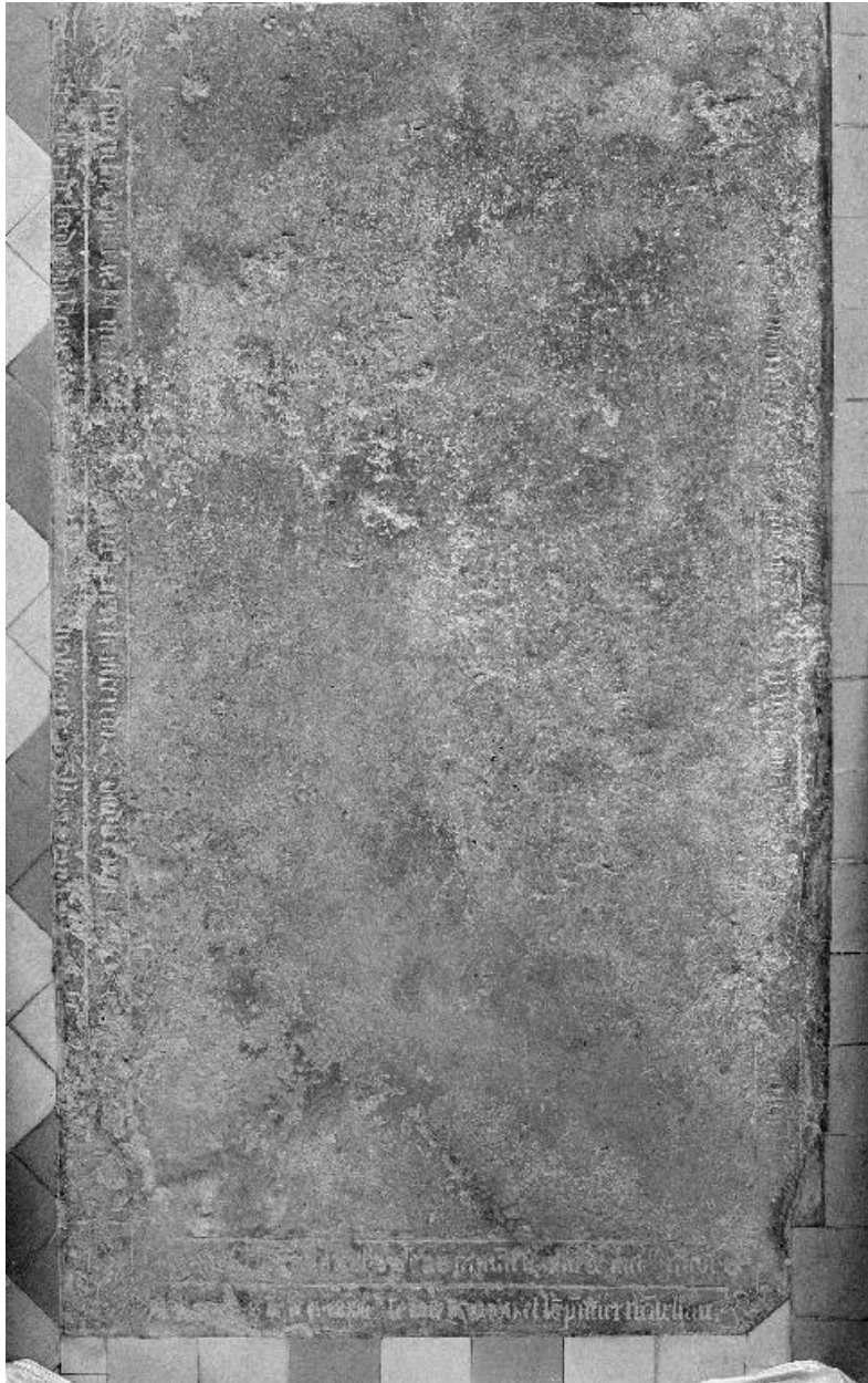
Vue générale de la dalle.