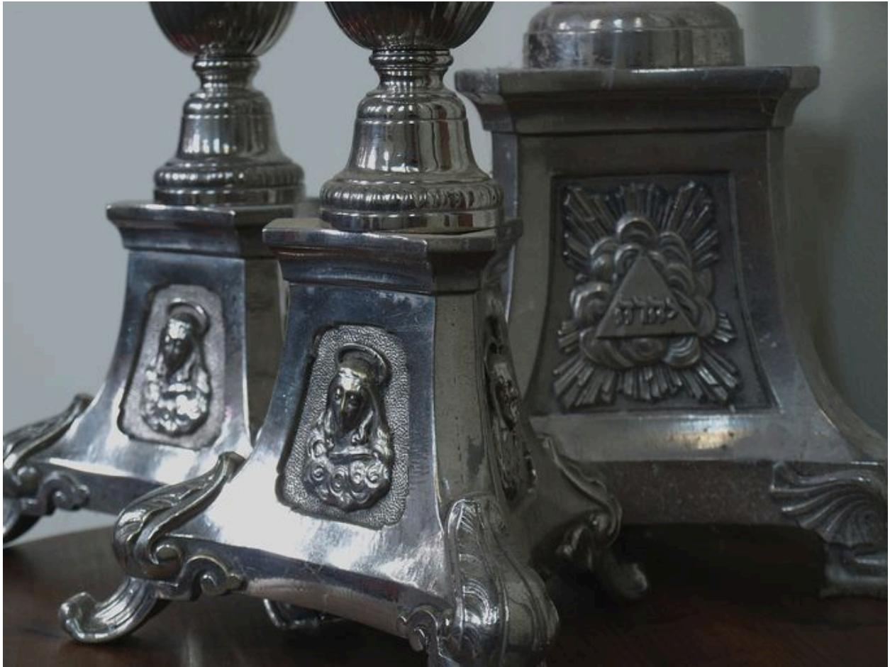
Vue de détail : ensemble des pieds