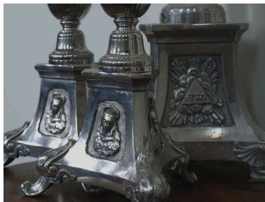
Vue de détail : ensemble des pieds IVR31_20106204011NUCA