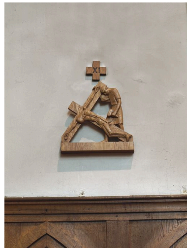
Station XI IVR31_20126201518NUCA